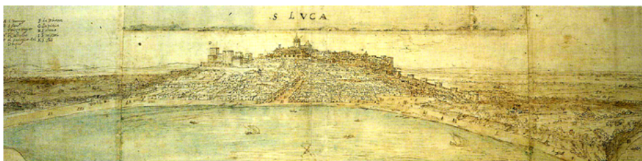
Fig. 6. Anton Van den Wyngaerde, Vista de Sanlúcar de Barrameda , 1567 (Ashmolean Museum de Oxford C.III 259).

Es de suponer que el apoyo económico, que permitió al pintor viajar por buena parte de Andalucía, se reflejó en la ejecución de los apuntes y dibujos fechados en 1567. Y como no podía ser menos, varias de las «vistas» recogen ciudades y lugares pertenecientes o vinculados a la casa ducal, esenciales en su poder económico y simbólico, Tarifa, Zahara de los Atunes y Sanlúcar de Barrameda. El documento contable aclara que parte de las mismas no se habían realizado, al emplear la expresión «que a de pintar», entrando en el lote todas o partes de las fechadas ese año. O cómo el artista se encontraba en Sanlúcar, pues se anota la carta de pago, lo que permite fechar con exactitud en abril el entorno de la «vista» sanluqueña.