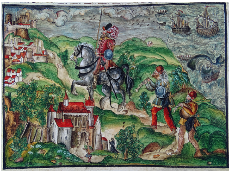
Fig. 5. Jerome Coeler, Núremberg (1560 y 1632) (Coeler al. Köler, The British Library de Londres), en Rubiales Torrejón, J. (coord). El Río Guadalquivir. Del mar a la marisma , p. 131.

Una nueva recreación visual de la ciudad la encontramos en un grabado alemán de Jerome Coeler, publicado en Núremberg entre 1560 y 1632 (Coeler al. Köler, The British Library de Londres), que representa a un capitán y a dos de sus hombres que se dirigen a caballo y a pie, respectivamente, para embarcarse en una de las naves allí fondeadas, camino de Venezuela, entrando a Sanlúcar por un camino paralelo al Guadalquivir, posiblemente desde Sevilla. El contexto es claro, pues se representa la desembocadura del río en el margen superior derecho, con dos naos y varias barcas de transporte a remos, posible referencia a la expedición, y el camino terrestre que se corresponde a la realidad que aún subsiste. Sin embargo, la interpretación de la ciudad y de sus edificios es una recreación idealizada, deformada bajo el prisma del estilo artístico gótico alemán del grabador, aunque resulta exacta su disposición topográfica. A su izquierda deja un poderoso monasterio, que identificamos no sólo por la estructura del inmueble, sino por un fraile que se le acerca, como el desaparecido de San Jerónimo que se levantaba extramuros en esa zona. Más adelante el caserío, que mira hacia la costa, con varios edificios notables, con una iglesia provista de un aguzado chapitel gótico centroeuropeo, imposible para el estilo del lugar. Culmina la visión urbana una poderosa fortificación en alto, que se corresponde con el castillo de Santiago en la cresta de la barranca (Gil y Varela 2011) (fig. 5).