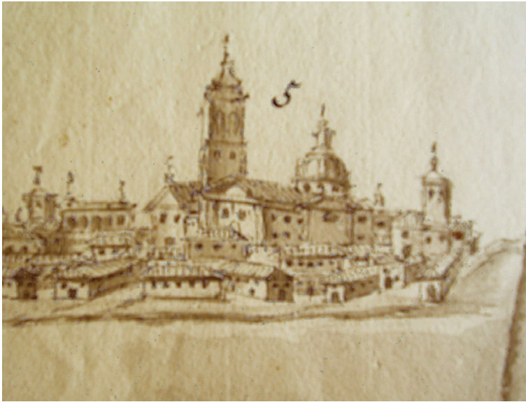
Fig. 8. Francisco Díaz Pinto, mapa topográfico del Coto de Doñana, detalle de Sanlúcar de Barrameda, 1789, cortesía de la Fundación Casa Medina Sidonia.

ese lado, otra obra vandevalviriana, el santuario de Ntra. Sra. de la Caridad, marcado por su torre. A la izquierda de la parroquial se aprecia el palacio ducal, con una danza de cinco arcos, y el castillo de Santiago, con la torre del homenaje, y algún otro edificio religioso, que se advierte por el campanario. Por debajo se desparrama el caserío, con algunas calles, como la central cuesta de Belén, que comunicaba la ciudad antigua con el arrabal comercial y mariner. Cierra la imagen con las dunas de arena de la playa 4 (fig. 8).