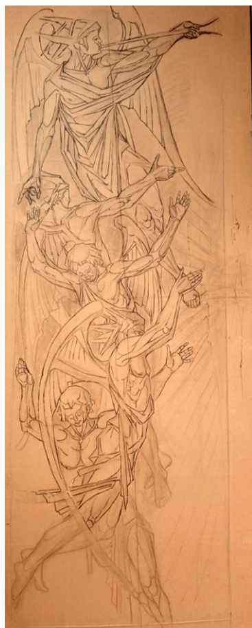
Fig. 4. Luis Ortega Brú, Rompimiento de Gloria , 1963. Tinta sobre papel. Museo Municipal de San Roque.