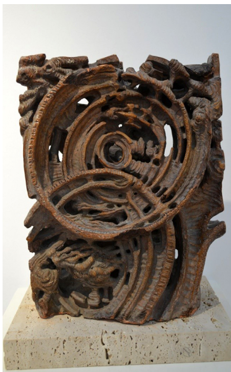
Fig. 3. Luis Ortega Brú, El eco , 1965. Barro modelado. Museo Municipal de San Roque.

Esto nos habla de un artista heterodoxo, que trabaja en sus proyectos de forma multidisciplinar y aunando las posibilidades creativas que pintura y escultura le ofrecían.