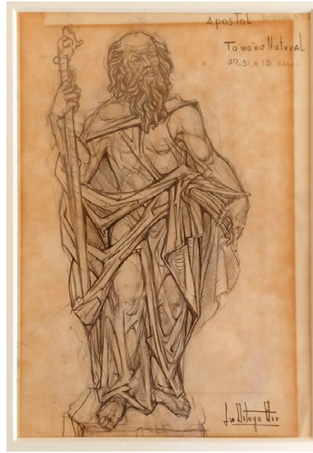
Fig. 9. Luis Ortega Brú, Apóstol , 1979. Lápiz sobre papel. Museo Municipal de San Roque.

como el informalismo, sino que, siendo un buen dibujante, desarrolló toda una interesante obra pictórica que hoy en día resulta poco conocida.