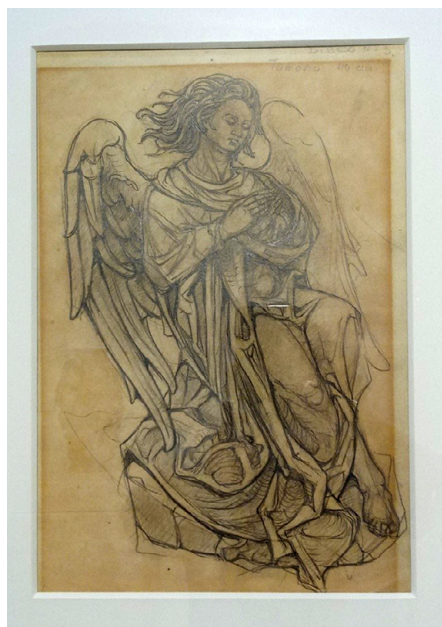
Fig. 7. Luis Ortega Brú, Ángel , 1979. Lápiz sobre papel. Museo Municipal de San Roque.

2020a). En torno a los años 70, realizó una serie de esculturas donde incorporaba materiales orgánicos. «Esa posibilidad y la utilización de materiales orgánicos reales lo proyectaron a un nuevo mundo de formas en el que los rasgos morfológicos propios se manifiestan en la intención y la carga de sentido» (Luque Teruel 2020a).