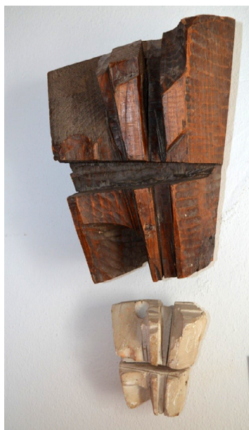
Fig. 1. Luis Ortega Brú, Conjunto de La Piedra Filosofal , 1960, madera y yeso. Museo Municipal de San Roque.

su mundo profesional, sin ningún interés económico. Muchas fueron realizadas en la intimidad de su taller. Se trata de una obra compleja, oscura en cuanto a interpretación, en donde habla lenguajes artísticos mucho más contemporáneos, ajenos al estilo neobarroco de la imaginería.