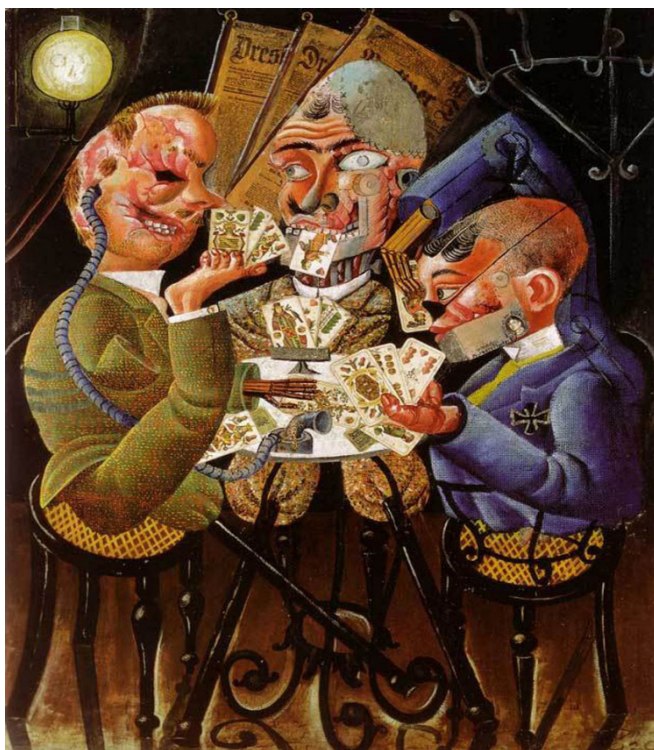
Fig. 4. Otto Dix, Jugadores de cartas , 1920, 45,5 x 57 cm, Neue Nationalgalerie, Berlín, Alemania.

tra la naturaleza del cuerpo de los tres personajes que se muestran como monstruos compuestos de elementos ortopédicos. En cierto modo se comportan como el negativo de los Jugadores de cartas , de un desaparecido mundo en paz que había pintado Cézanne unas pocas décadas antes.