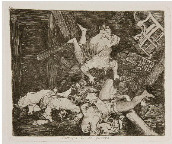
Fig. 2. Goya, Estragos de la guerra , 1810-1815, Los desastres de la guerra, n.º 30, 141x170 mm.

en calidad de prodigio. En cambio, el Romanticismo produce una atmósfera muy diferente durante las primeras décadas del siglo XIX. Por ejemplo, ya a partir de 1819, Saturno devorando a su hijo denota una escena monstruosa, como el resto de pinturas negras , que nos sumergen en un ambiente en el que la vida y la sociedad tienen otro sentido. Goya profundiza en la deformación porque la entiende como oportunidad plástica, capaz de expresar sentimientos y escenas de dolor, personal (privado) y público (social). Picasso llegará a la idea de monstruosidad desde otras visiones, pero terminará sirviéndose de la misma monstruosidad para expresar contenidos equivalentes a los que Goya había encontrado cien años antes. El monstruo, o la deformidad anatómica del cuerpo humano, se presentará ante Goya y Picasso como un desafío creativo que pertenece a la naturaleza, pero que se ocupa de recordarnos el error o la aberración de un sistema, el que imbrica la política para la muerte en la vida, en el cuerpo. Para Goya y para Picasso, el problema del monstruo es que