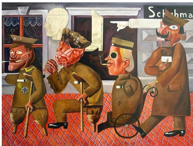
Fig. 3. Otto Dix, Lisiados de guerra , 1920, 25,9 × 39,4 cm, Museo de arte moderno (Moma), New York City, Estados Unidos.

tiene varias aristas; es algo más de lo que vemos e incluso de lo que nos imaginamos, tiene un por qué y un para qué, depende si lo que muestra ese pasado, presente o futuro. Es causa, es efecto, y algunas veces, es fin en sí mismo (Santiesteban Oliva 2003, 23).