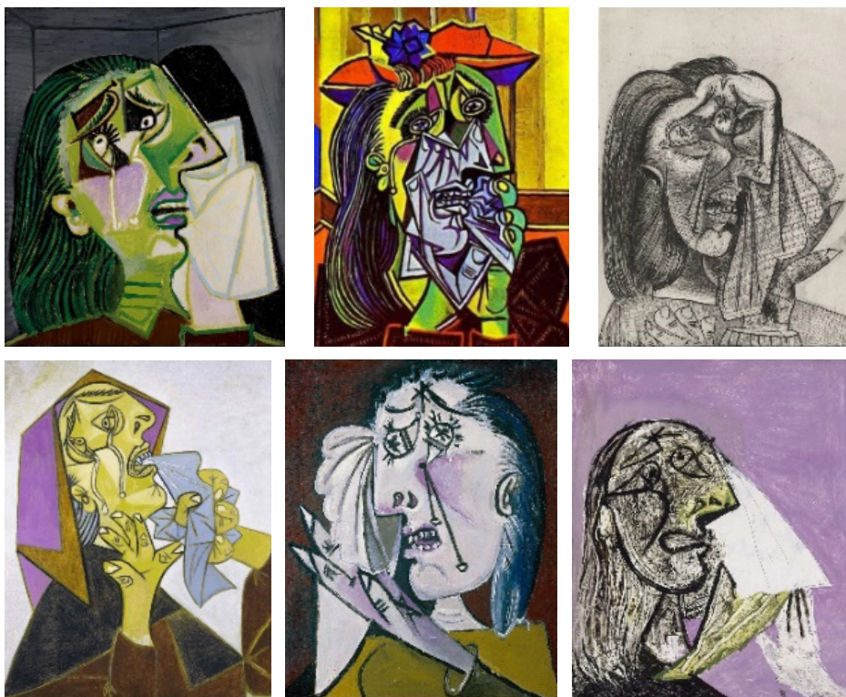
Fig. 5. Pablo Picasso, Mujer que llora , 1937, 60 x 49 cm, Tate Modern, Londres, Gran Bretaña.

cia de mujeres que sufren, a una escala mucho más humana (60 cm x 49 cm). Es como si de alguna forma Picasso hubiera querido «contar» qué ocurrió después y/o qué fue de las protagonistas, cómo continuaron su tragedia y su dolor personal en sus vidas privadas.