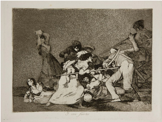
Fig. 1. Goya, Y son fieras , 1812-1815, Los desastres de la guerra, n.º 5, 155 x 209 mm.