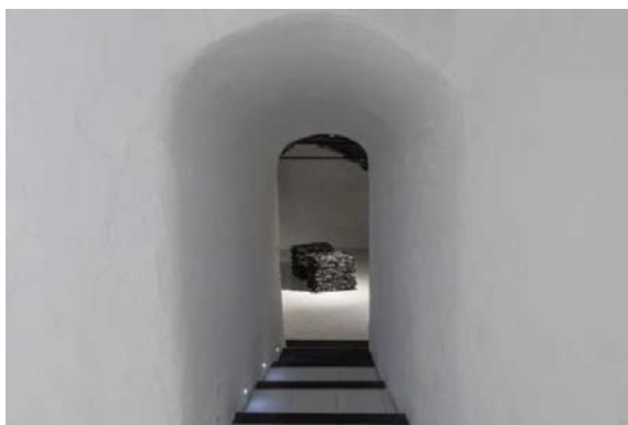
11. Laura Mesa, Sin título , 2018, polvo de grafito aglutinado y papel, medidas variables.