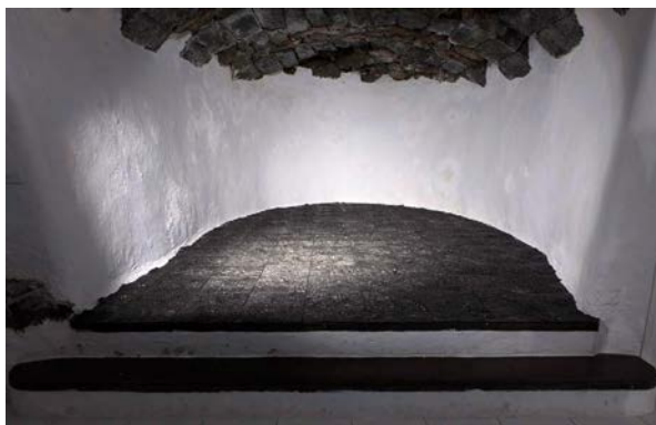
1. Laura Mesa, Sin título , 2018, polvo de grafito aglutinado, medidas variables.