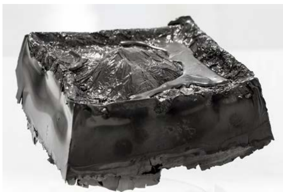
3. Laura Mesa, Sin título , 2018, tinta china sólida, 12 × 12 × 8 cm.