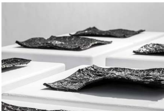
5. Laura Mesa, Sin título , 2018, tinta china sólida, 30 × 30 cm cada pieza (8 piezas).