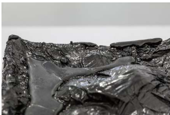
4. Laura Mesa, Sin título (detalle) , 2018, tinta china sólida, 12 × 12 × 8 cm.