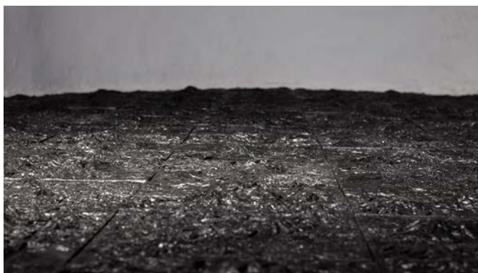
2. Laura Mesa, Sin título (detalle) , 2018, polvo de grafito aglutinado, medidas variables.