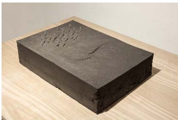
10. Laura Mesa, Sin título , 2018, polvo de grafito aglutinado, 35 × 50 × 40 cm.