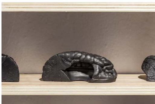
9. Laura Mesa, La piedra de la locura (detalle) , 2018, polvo de grafito aglutinado, medidas variables.