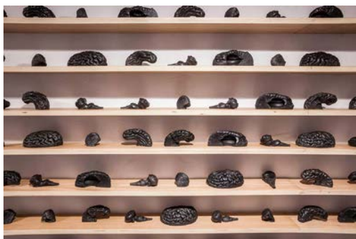
8. Laura Mesa, La piedra de la locura (detalle) , 2018, polvo de grafito aglutinado, medidas variables.