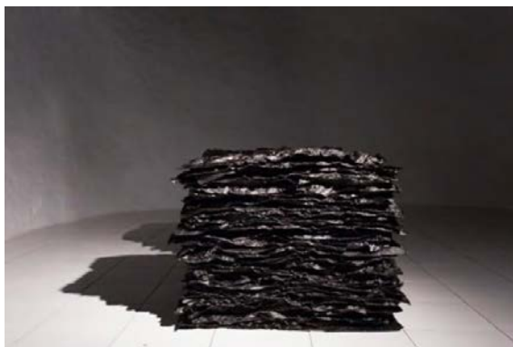
12. Laura Mesa, Sin título , 2018, polvo de grafito aglutinado y papel, medidas variables.