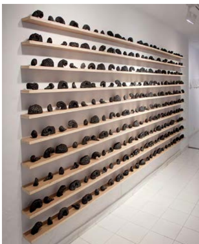
7. Laura Mesa, La piedra de la locura , 2018, polvo de grafito aglutinado, medidas variables.