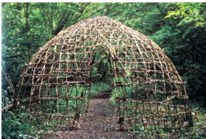
Figura 6. Cuckoo Dome , 1992. ©Cris Drury.

la naturaleza se reconoce 20 . Drury va más allá de este reconocimiento para hacer de esa tensión el sujeto de su trabajo. Expone la dinámica entre naturaleza interna y externa, entre movimiento y quietud, entre proximidad y distancia. Transforma un refugio en una cesta, construye un refugio dentro de una galería, introduce un refugio de piedra dentro del tejido abierto de un domo a través del cual se ve una montaña, crea un remolino de piedras en el cauce de un río. Es precisamente en el momento en que estas tensiones se perciben cuando la relación del artista con la naturaleza se hace más transparente.