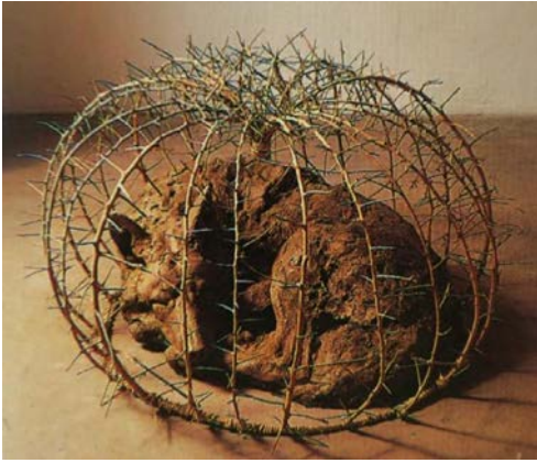
Figura 2. Coyote Dreams , 1980.