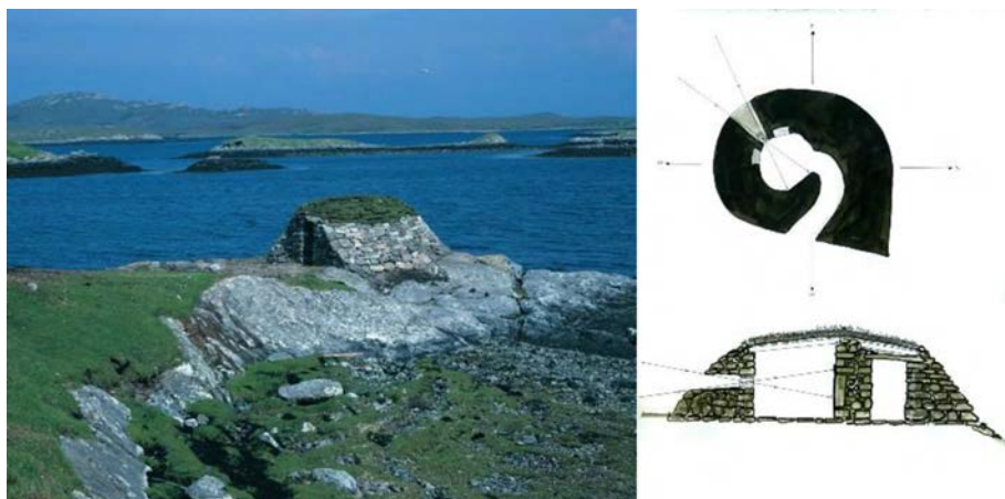
Figura 8. Hut of the shadow / Both nam faileas . Lochmaddy. North Uist. Western Isles, 1997. ©Cris Drury.

todo el mundo, aunque son especialmente reconfortantes las realizadas en pequeñas comunidades como Kielder, en Northumberland; Okawa-mura, en Japón; o Lochmaddy, en la isla escocesa de North Uist (figura 8). Es una tarea descomunal, pero que se disfruta mucho, ya que mucha gente se involucra. «Se comparten habilidades, y el tiempo y el trabajo generan amistades y risas gratuitas» 25 .