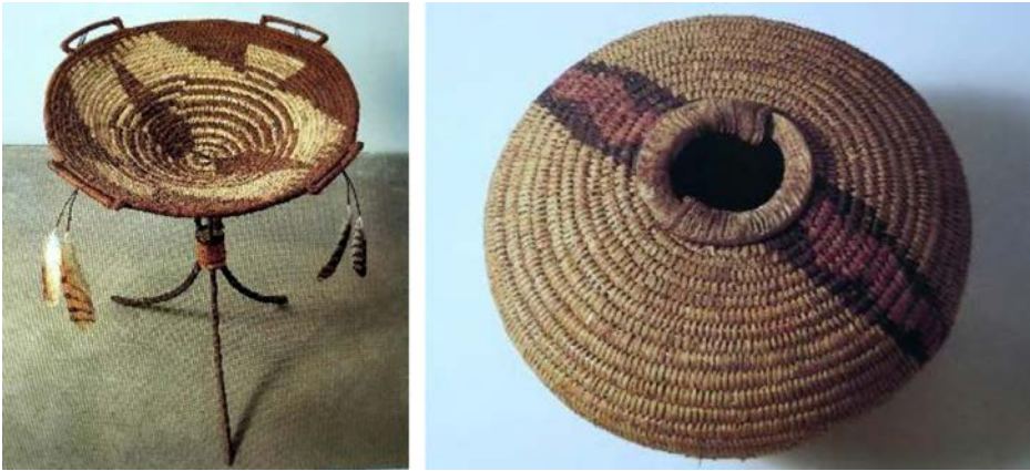
Figura 5. Dream Basket , 1985, y Basket for the moment between death and Life , 1985. ©Cris Drury.

ción ambivalente 18 . Una cesta puede referirse a la naturaleza interior, al mundo de los sentidos, sueños e ideas. Drury tuvo un sueño repetitivo que durante cuatro años permaneció en su mente hasta que pudo concretarlo en una cesta y descubrió que era un sueño arcaico. Así crea La cesta de los sueños (figura 5) respondiendo a la idea jungiana de haberse generado en el inconsciente colectivo 19 . La cesta para el momento entre la vida y la muerte (figura 4) la hizo para ese momento del año cuando el invierno está casi acabando pero la primavera aún no ha llegado; la tierra se pausa, como respirando hondo. Los cuernos en torno a la abertura de la cesta se unen el uno con el otro, representando la naturaleza cíclica del año. El diseño, el tejido y la naturaleza tediosa y repetitiva de este meticuloso trabajo tienen que ver con la mirada hacia el interior, del mismo modo que la actividad de pasear lo hace hacia el exterior.