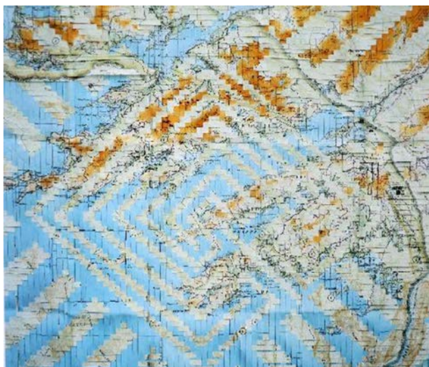
Figura 9. West cork / New México wowed maps , 1995. ©Cris Drury.

ello entreteje islas, montañas, cordilleras y diversos lugares que ha visitado. Los trabajos de mapas trenzados son una extensión de la creación de cestas. En ellos muestra el mundo como una red tejida de interconexiones. Al cortar los mapas en tiras y entrelazarlas, a menudo une lugares opuestos: Las Hébridas/Manhattan o West Cork/Nuevo Méjico (figura 9). En relación con este último cabe señalar que la técnica del tramado se encuentra tanto en la cultura céltica como en la de los indios pueblo 26 . En ambas obras ha unido similitudes físicas y culturales, convirtiéndolos en un todo. Las diferencias señalan aquello que hace nuestro mundo sorprendentemente bonito. La homogeneidad nos convierte en un todo.