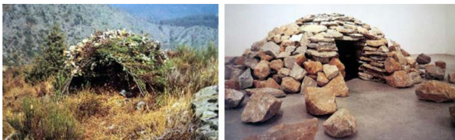
Figura 4. Shelter for herbars and healing , 1996, y Stone chamber , Los Ángeles, 1991. ©Cris Drury.

tes normales» 15 . Algunos refugios los ha construido en un lugar particular porque era el momento de parar y montar el campamento para pasar la noche. Hay otros emplazamientos, normalmente cerca de donde vive, adonde acude específicamente para crear un trabajo. Son espacios que se pueden encontrar a la vuelta de la esquina de casas o pueblos. Construir allí requiere tranquilidad y cautela. Para aquellos que descubren las estructuras, son como hongos que han surgido durante la noche y con el tiempo se descompondrán en la tierra (figura 3). A veces los refugios son encargos, como Santuario del Desierto , construido en Irlanda con el artista Alfio Bonanno con el objetivo de crear un espacio donde estar y meditar 16 . Hay refugios construidos en interiores, como instalaciones en galerías, dominando el espacio (figura 4). Estos pasan de ser un refugio a ser un espacio cerrado, misterioso, fecundo. Realizan una vez más el intercambio dentro-fuera. Este intercambio se apreciará aún más en sus cámaras de nubes.