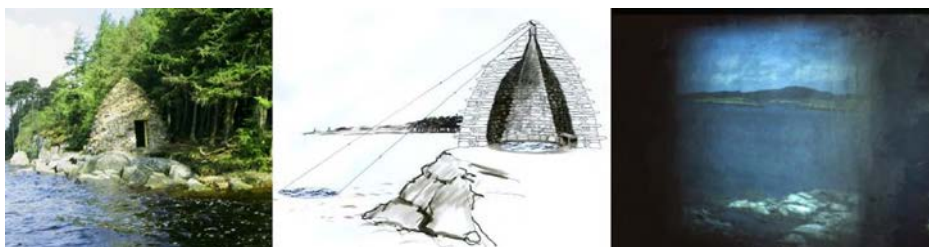
Figura 7. Wave Chamber. Kielder Reservoir. Nortumberland, 1996. ©Cris Drury.

como una metáfora del movimiento de la oscuridad a la luz en los seres humanos. En algunas utiliza un periscopio de acero con un espejo y un cristal colocado en lo más alto para poder proyectar una imagen de las olas en el suelo interior (figura 7). La cámara construida en los jardines de St James, Picadilly, uno de los lugares más ruidosos de Londres, fue hecha con una estructura trenzada de avellano, revestido de piedra. Era un refugio temporal de arenisca, fácilmente desmontable. Estos jardines son un oasis de paz dentro de una ciudad caótica. Son utilizados por vagabundos como refugios y por trabajadores a la hora de la comida. El trabajo aquí era una declaración práctica y política, así como el mojón de fuego/horno de pan que lo acompañaba (mencionado en el apartado «Mojones»), y también ofrecía un foco de calma consciente en el ajeteo inconsciente de la vida diaria de la ciudad. Una ilusión de calma, ya que un espacio tranquilo y meditativo no garantiza una mente en calma. En la vida todo es movimiento, solo la mente tiene la posibilidad de estar en calma. Dentro de la quietud que ofrece la cámara hay una visión de movimiento en constante cambio. La idea que actúa de fondo en sus cámaras es esta: la naturaleza observada desde el refugio de la cultura.