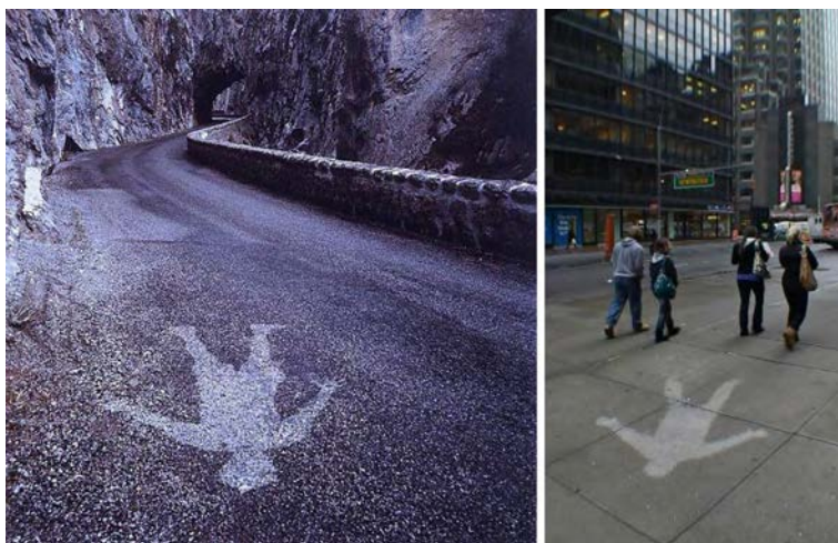
Figura 1. Sombra de lluvia , Tickon, 1993, y Rain Shadow , Times Square, 2010. ©Andy Goldsworthy.

en él. Tanto para Goldsworthy como para Drury, cada espacio requiere una intervención única, de modo que lo que construyen o modifican no podrían hacerlo en ningún otro sitio. Lo efímero sigue siendo uno de sus fundamentos, como podemos ver en muchas obras de Goldsworthy.