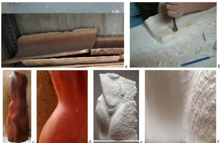
Figura 3. Materiales de partida, a: de canal de plástico, galería Añavingo-Arafo, b: de canal de hormigón, galería El Rebosadero-Arico), c-f: transformación mediante procesos escultóricos de desbaste, labra y pulimento.

res. Una primera aproximación analítica sobre la base de datos SEM/EDX y DRX 8 (fig. 2i y fig. 2k) muestra la presencia mayoritaria de aragonito en los estratos analizados con presencia de calcita (9: 1), en alguno de ellos, de tonalidad diferenciada; se muestra la presencia de trazas de algún tipo de óxidos de hierro no cristalinos y de algún tipo de dolomita en vez de calcita.