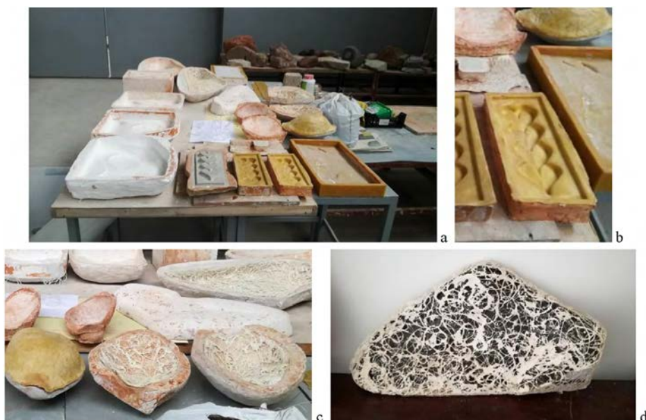
Figura 6. a-b: Moldes abiertos, c-d: madreformas, en diversos materiales: escayola, cera, silicona, alginator, fibras vegetales.

mente se están estableciendo acuerdos con diversas galerías de agua, con la idea de solicitar conjuntamente financiación competitiva para instalaciones.