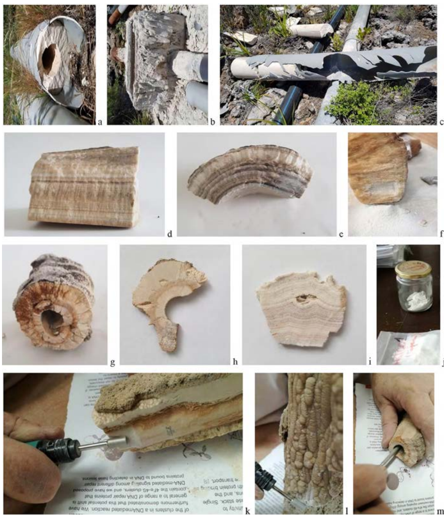
Figura 2. a-c: panorama (cerca de galería Hoya de Leña, nov. 2018); d: muestra de interior canal de plástico; e: de interior c. hierro; f: de interior c. cemento; g: de exterior tubo plástico; i-j cortes transversales; k-m obtención de muestras en polvo.

Para finalizar la descripción de la parte analítica, anotemos un ejemplo: tomando como base las muestras SG1 a SG5 (sucesivos estratos sedimentados exteriormente sobre tubo de plástico de un punto de recogida cercano a la bocamina de la galería Salto del Guanche, en Guía de Isora), puede afirmarse que estamos dentro del campo de materiales estructuralmente calizos. La formación de estratos podría ser estacional, ya que se observan coincidencias de estructura y composición química entre capas alternas que también visualmente presentan color y textura simila-