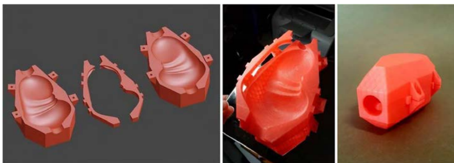
Figura 4. Molde a piezas (reutilizable). La construcción y el despiece de la forma se llevaron a cabo con software Blender.