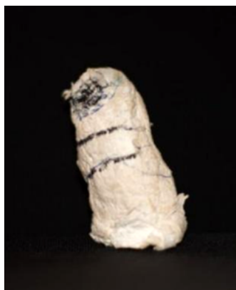
Figura 13. Representación de un dedo de niño de 8 años. Papel pintado.

lógico pueden considerarse como guardianes del umbral del inconsciente» 77 . Dalí representará este tipo de seres mediante un racimo de dedos pulgares que parecen tener vida propia surgiendo de una copa en su obra titulada Aparición de un rostro y un frutero en la playa de 1938.