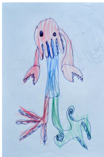
Figura 8. Dibujo de niño de 6 años.

ha hecho que se alzarán sus dioses y demonios y todas esas poderosísimas ideas sin las que el hombre deja absolutamente de ser hombre 63 .