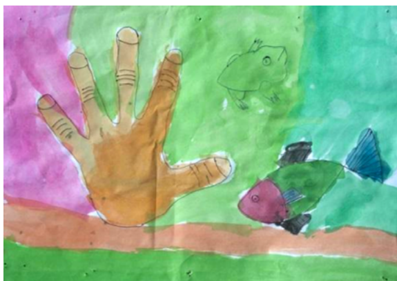
Figura 12. Dibujo de un niño de 8 años.