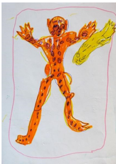
Figura 7. Dibujo de niño de 5 años.