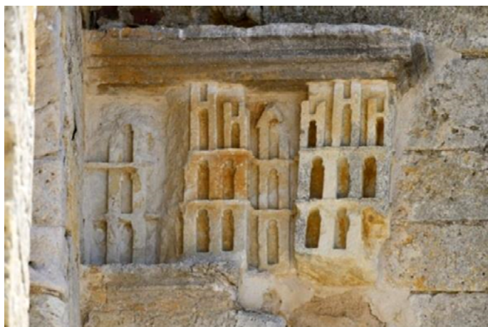
Figura 1. Capitel de Villalcázar de Sirga (Palencia), siglo XII.

que «el descenso corre el riesgo en todo instante de confundirse y de transformarse en caída. Debe ir constantemente acompañado, como para tranquilizarse, por los símbolos de intimidad» 16 , de esta manera uno se protegería para penetrar en su centro más secreto como ocurre con el símbolo de la ciudad o el castillo que nos salvaguardarían del exterior. Para A. Jaffé la ciudad sería un símbolo sagrado que se vincularía con el mandala , constituyendo la proyección de una imagen arquetípica que surgiría del inconsciente hacia el exterior ya que la ciudad representaría «un cosmos ordenado, un lugar sagrado vinculado por su centro con el otro mundo. Y esa transformación armoniza con los sentimientos vitales y las necesidades del hombre religioso» 17 . Algunas ciudades medievales se construyeron sobre planos de mandala inspirándose en la ciudad santa de Jerusalén que aparece en el Apocalipsis y que podemos ver en un capitel del templo fortaleza de Villalcázar de Sirga construida por los templarios en el siglo XII (fig. 1). El arte infantil reflejaría este simbolismo mediante ciudades encuadradas en esquemas geométricos como es el caso de este dibujo de un niño de siete años donde vemos la representación de una ciudad cuya línea compositiva sería un triángulo equilátero que simbolizaría la divinidad, la armonía y la proporción constituyendo un símbolo de totalidad psíquica que representarían la personalidad interior del niño (fig. 2).