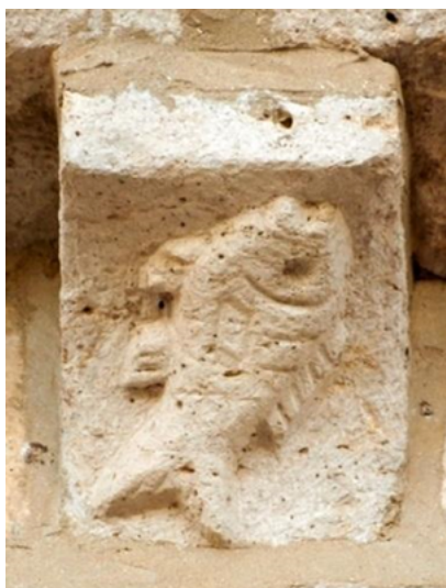
Figura 5. Canecillo de Nuestra Señora de las Fuentes , Amusco (Palencia), siglo XIII.

lo pasivo puede inducirse una vez más que el sentido del verbo importa más a la representación que la atribución de la acción a tal o cual sujeto 57 . Así el pez representaría el «esquema del tragador tragado» 58 , habiendo una relación entre el vientre sexual y el vientre digestivo como vemos en el mito de Isis donde el pez oxirrinco despedazado por Tifon «se traga el catorceavo trozo, el falo, del cuerpo de Osiris» 59 . Esta deglución del pez pequeño por el grande es dibujada por los niños desde edades muy tempranas (fig. 6).