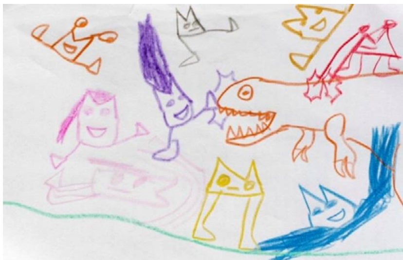
Figura 11. Dibujo de niño de 6 años.

con mucha frecuencia, valoriza o sacraliza» 67 . En los niños estudiados podemos ver cómo representarían este arquetipo de totalidad mediante imágenes actualizadas de nuestra época (fig. 11).