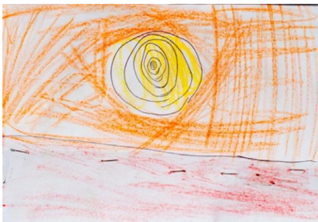
Figura 3. Dibujo de niño de 7 años.

dala como de los templos y de las iglesias consagradas a las mismas divinidades, que poseen los mismos vocablos y a veces las mismas reliquias» 32 , esta multiplicación aparece igualmente en el arte de los niños, donde hemos encontrado símbolos concéntricos con una serie de anillos que parten de un centro que representarían su ser psíquico (fig. 3).