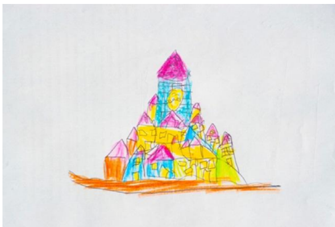
Figura 2. Dibujo de niño de 7 años.

D. Widlöcher señala cómo el dibujo infantil sería como un juego donde entraría en funcionamiento al mismo tiempo tanto la fantasía como la actividad gráfica seria, ya que los móviles del dibujo coincidirían al mismo tiempo con los del juego, por lo que este autor concluye que «la paradoja que hace descubrir la aparente antinomia entre seriedad y gratuidad del juego se aclara con la hipótesis de una actividad psíquica inconsciente» 18 . Para R. Kellogg el dibujo infantil tendría un contenido simbólico de carácter arquetípico como vemos en las configuraciones mandálicas de los niños y otras figuras geométricas desde las cuales se puede hacer un análisis del arte infantil. En 1954 esta psicóloga visitó a Jung, mostrándole sus investigaciones sobre la representación del mandala concluyendo cómo este símbolo constituiría «un eslabón fundamental en la evolución progresiva que conduce del trabajo abstracto a la pintura figurativa. El niño, de los mandalas accede a los soles y luego a las figuras humanas» 19 . Kellogg clasificó seis diagramas divididos mediante las figuras del rectángulo, el cuadrado, el óvalo, el círculo, el triángulo, la cruz o la X. Estas estructuras lineales se pueden unir formando «agregados» que serían «unidades de tres o más diagramas que el niño realiza entre los 2 y los 4 años. Su número es infinito y constituyen para la autora el grueso del arte infantil» 20 . C.G. Jung señala cómo las figuras simbólicas se convertirían en un medio para poner en