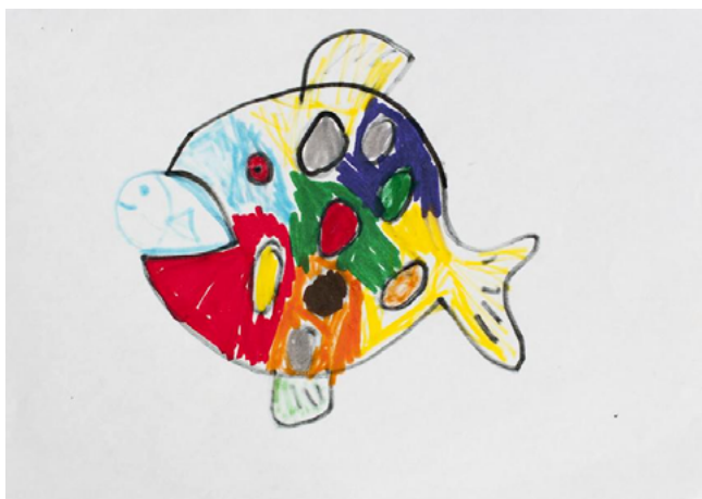
Figura 6. Dibujo de niño de 5 años.