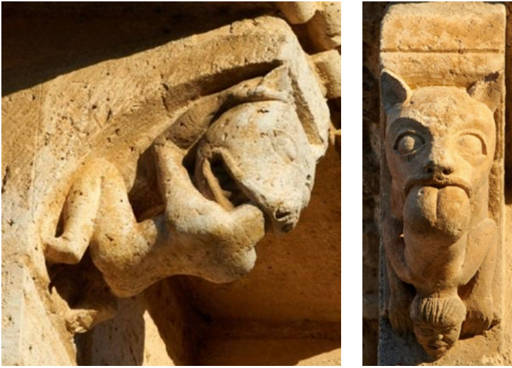
Figuras 9 y 10. Cancillos de la Iglesia de San Martín de Frómista (Palencia).

salir posteriormente de esas tinieblas, constituyendo un rito de iniciación, siendo a menudo un descenso a los infiernos seguido de una resurrección: