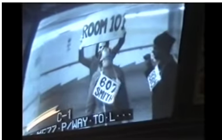
Fig. 7. Acción de Surveillance Camera Players en el metro de Nueva York.

ciaron estrategias como las descritas en el Manual de guerrilla de la comunicación 32 . Uno de estos proyectos es iSee 33 , del Institute of Applied Autonomy, un programa informático de navegación GPS que genera alternativas de trayectos con la menor exposición posible a las cámaras de vigilancia de Manhattan.