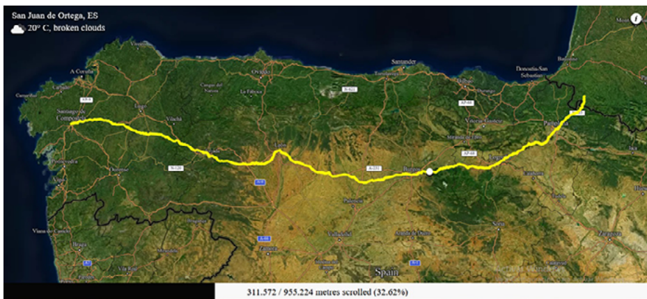
Fig. 3. Digital Detox , Marco Land.

En alusión a este fenómeno descrito por Virilio, nos viene a la mente el proyecto Digital Detox (fig. 3), iniciado por Marco Land en 2019 y que todavía se está llevando a cabo. Una extensión de Google Chrome construida por el artista que registra a tiempo real la distancia total recorrida al hacer scroll en su ordenador: cada vez que Land recorre una página web, la extensión mide ese movimiento. Luego esa distancia se traslada a un recorrido, generado por Google Maps y alojado en una página web 16 , moviendo un marcador a lo largo de este. El trayecto en cuestión es el Camino Francés, una de las principales rutas hasta Santiago de Compostela.