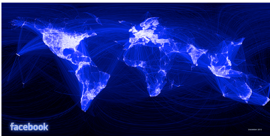
Fig. 4. Facebook Friendship World Map, Paul Butler.

(fig. 4), quien por aquella época trabajaba para Facebook, y que desarrolló a través de la interconexión entre amistades a partir de los datos de la red social. Este mapa ilustra muy bien el área de influencia de la infraestructura de Facebook por aquel entonces y los límites de su capacidad de recoger datos y, por lo tanto, la manera en que su inteligencia artificial es capaz de comprender el mundo. En definitiva, el mapamundi se caracteriza por la limitación a los territorios dominados por Occidente, excluyendo áreas subdesarrolladas y, por supuesto, las infraestructuras de los bloques chino y ruso, que por su parte gozan de un entramado tecnológico capaz de competir con el occidental. Cabe señalar que en la actualidad Facebook forma parte del entramado mucho mayor de Google, pero desgraciadamente Butler no ha llegado a elaborar un nuevo mapa incluyendo los nuevos datos.