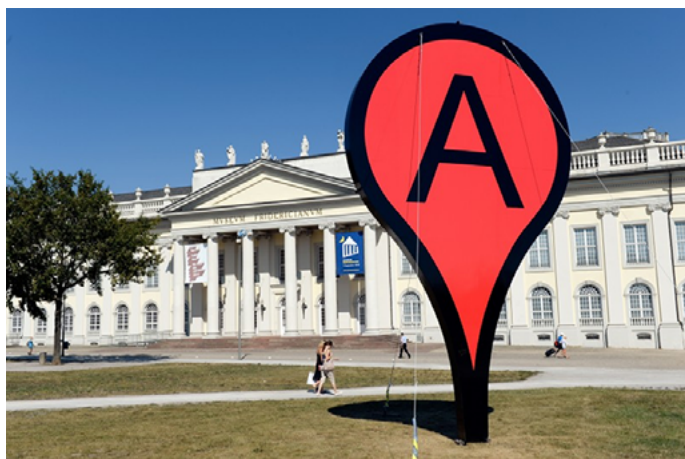
Fig. 5. Map, Adam Bartholl.

una interpretación falsa de la realidad (o ideología), sino de ocultar que la realidad ya no es la realidad y, por tanto, de salvar el principio de realidad 26 .