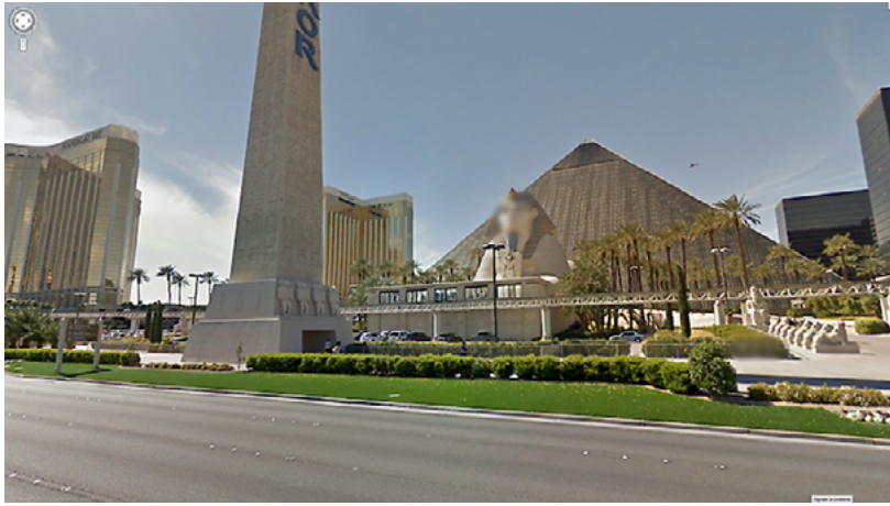
Fig. 2. Anonymous Gods , Marion Balac.

Rubén Ángel Arias en texto del proyecto: «El fotógrafo es ahora, más que nunca, un antólogo, un flâneur sumergido en una imponente masa de imágenes a la deriva» 9 .