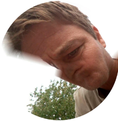
Fig. 1. The Driver and the Cameras , Emilio Vavarella. Uno de los proyectos de The Google Trilogy .

especificidad de un entorno saturado de medios. Por ejemplo, mientras que flânerie existía en relación con el movimiento a través de la arquitectura específica de las salas de juego de París, la media-flânerie es, en cambio, el producto de nuevos movimientos digitales a través de arquitecturas de software, autopistas de información, agregados de datos e interfaces híbridas 7 .