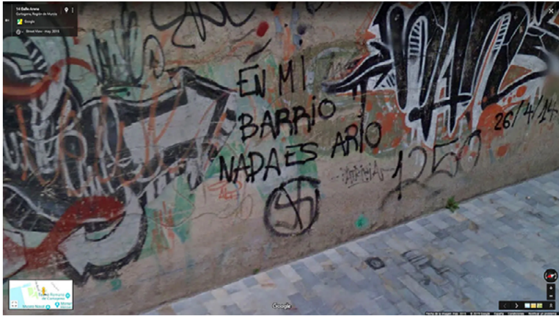
Fig. 6. Paisajes digitales de una guerra, Azahara Cerezo.

de ubicación de Google Earth. El lugar donde se erigen no es aleatorio, sino que se sitúan exactamente sobre la ubicación que Google sugiere como centro de la ciudad. Un ejemplo es el marcador que fue colocado en Kassel, Alemania, en la plaza frente al Museum Fridericianum.