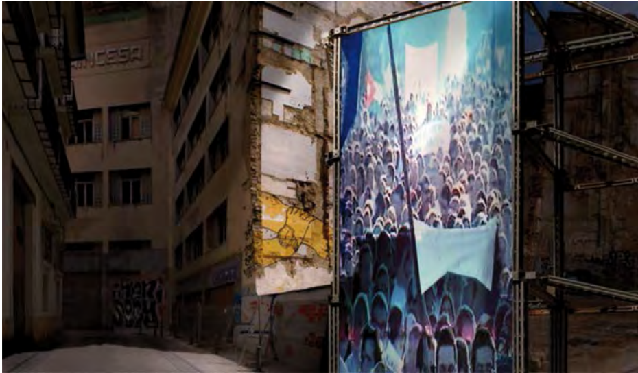
Figura 5. Serie Fusión y pasado , 2010. Fotografía. Impresión ink-jet papel ilfochrome. 87 × 100 cm.