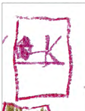
Figura 5. Detalle del padre de Alonso. En esta imagen se puede ver la figura paterna durmiendo en la cama, representada sobre una línea recta en posición horizontal.