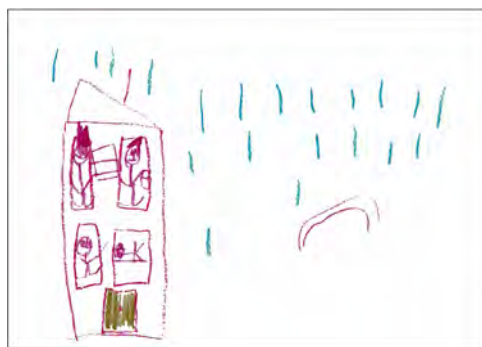
Figura 3. Alonso, 5 años (mayo de 2010). Mi familia . DIN-A4. Ceras y lápiz sobre papel.