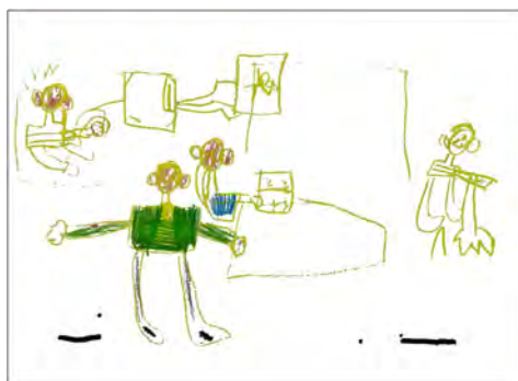
Figura 7. David, 5 años (mayo de 2010). Mi familia . DIN-A4. Lápices y ceras sobre papel.