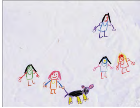
Figura 2. Elena, 5 años (mayo de 2010). Mi familia . 210×297. DIN-A4. Ceras y lápiz sobre papel.

milia es una herramienta de gran importancia y utilidad para conocer sus relaciones afectivas con sus padres, hermanos/as y abuelos. En una primera sesión, se le propone al niño/a realizarlo en las tareas que cada uno desempeñe en su casa, para analizar a través de éste, cuáles son las diferencias de género en la familia y estudiar cómo las perciben e interpretan. Los datos recogidos a través de los dibujos, las entrevistas y observaciones realizadas en los grupos de Educación infantil en los tres centros citados ofrecen indicios de cómo los niños/as generan su idea de familia. Entre los grupos entrevistados, observamos que el tipo de familia predominante en la actualidad es la denominada nuclear, especialmente formada por ambos progenitores y su descendencia. El número de hijos ha disminuido muy considerablemente en la actualidad, aumentando la integración de la mujer al mercado laboral y los recursos extrafamiliares para atender, educar y cuidar a los más pequeños. Si existen familiares en la misma población, normalmente viven en otro domicilio y el contacto puede ser periódico o escaso.