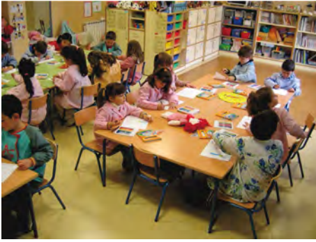
Figura 1. Grupo de Educación infantil del colegio público de Jun (Granada).