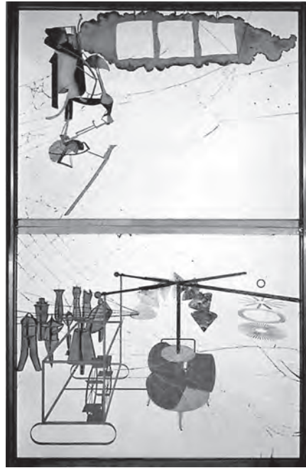
Figura 2. Grand verre (Marcel Duchamp, 1915-1923).