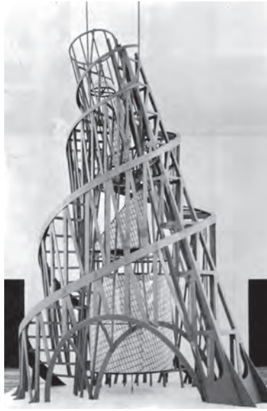
Figura 4. Proyecto para el monumento a la III Internacional (Wladimir Tatlin, 1920).

poner al lector de sus versos 4 . Así la obra de arte es ante todo las experiencias que va despertando en los espectadores, cuando estos la despiertan a ella.