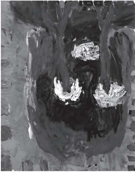
Figura 3. Cabeza con lágrimas (Georg Baselitz, 1986).