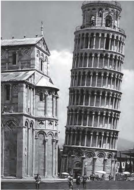
Figura 1. Torre de Pisa (siglo XII).