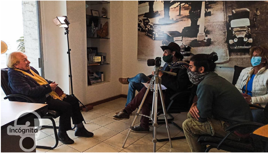
Imagen 2: Rodaje de la serie.

de los antiguos residentes. La miniserie fue transmitida en el mes de julio de 2021, a través del canal del Estado, Televisión Nacional de Uruguay. Posteriormente los capítulos serán publicados en redes sociales, como Facebook y YouTube 10 , y en la carpeta alojada en Google Drive. En general, la miniserie fue muy bien valorada tanto por los protagonistas como por el público. Existe interés de algunas personas en participar de futuras instancias de registro de narrativas, y se recibieron sugerencias de continuar la serie, abordando otros lugares de la península y de Punta del Este.