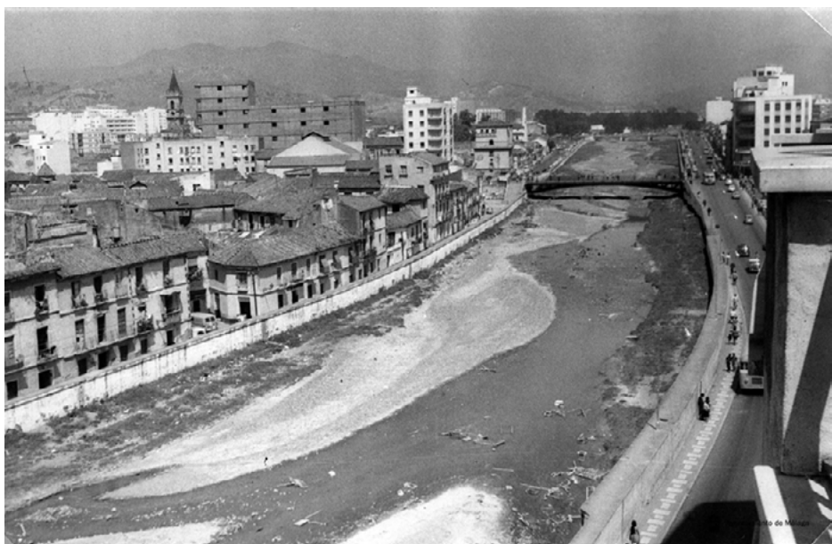
Imagen 4. Río Guadalmedina a su paso por el barrio de la Trinidad. 1970. 1970.

vendría acompañada de una cada vez mayor ampliación limítrofe como resultado y proliferación de construcciones religiosas tan importantes como el convento de La Trinidad, también conocido como convento de San Onofre de Padres Trinitarios Calzados, del s. XVI, el convento de la Aurora María (1739), la ermita de Zamarrilla (1757) y la iglesia de San Pablo (1874).