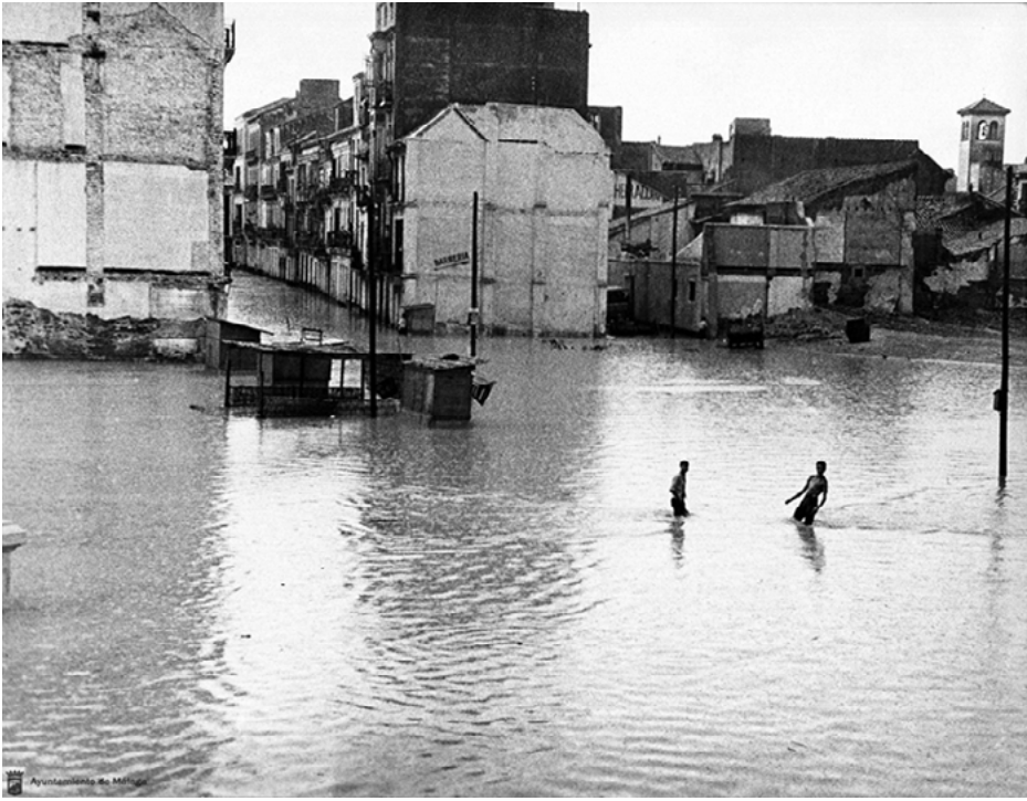
Imagen 3. Inundaciones en el Barrio del Perchel. 1959. Autor: Arenas. Archivo Municipal de Málaga. Signatura 1.º-C-2-268.

A pesar de que sus límites históricos eran en origen mucho más amplios, con los cambios urbanísticos de los años 70 del pasado siglo xx, el barrio del Perchel quedaría dividido por la actual avenida de Andalucía en dos partes: el «Perchel Norte», objeto de nuestro trabajo, y el «Perchel Sur», integrándose ambos en el Distrito Centro de la ciudad.