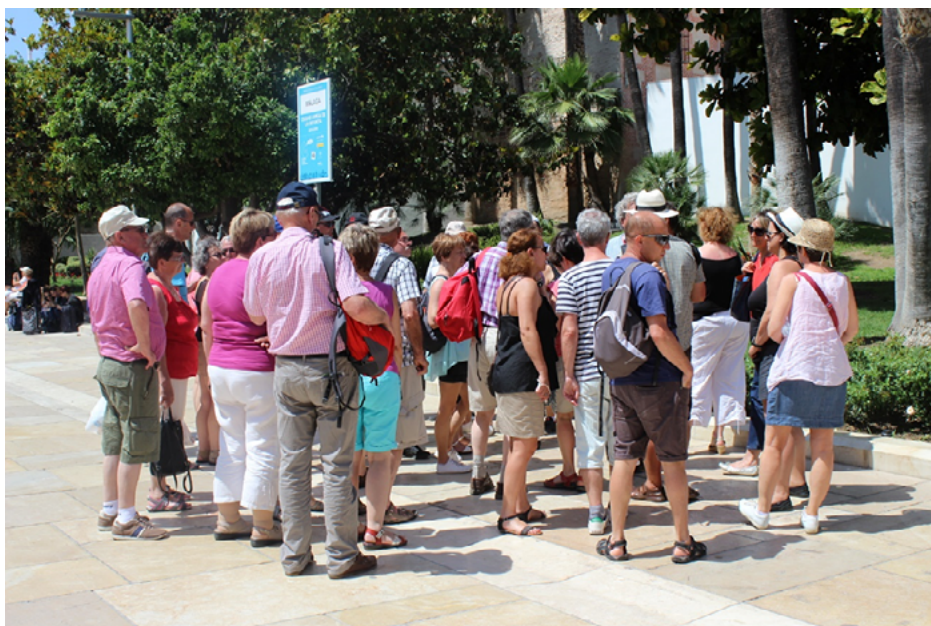
Imagen 1. Turistas en el centro de Málaga. 2019. Autora: Lourdes Royo Naranjo.

La delicada relación entre turismo cultural y sostenibilidad habla de la correcta planificación y gestión de nuestro patrimonio histórico cultural vinculado al turismo, y este se convierte en clave para la acción sobre el patrimonio. La planificación de un modelo de desarrollo del turismo cultural en una ciudad debe tener muy presente que la actividad turística ha de ser una actividad económica regida por los principios de calidad y sostenibilidad, capaces de contribuir al mantenimiento y la conservación del patrimonio cultural, evitando el deterioro de los bienes culturales y respetando condiciones de habitabilidad (Ruiz, 2014, p. 239).