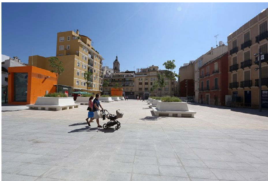
Imagen 5. Ámbito espacial de aplicación metodológica. Plaza Enrique García Herrera. Málaga. 2014.

La aplicación de la metodología propuesta se presenta como herramienta de trabajo eficaz en respuesta a las necesidades de intervención planteadas desde las diferentes administraciones en la reactivación de los espacios urbanos más castigados de las ciudades históricas. De manera práctica, y teniendo en cuenta los documentos Plan de Reactivación de Málaga frente a la pandemia y su engarce con la Estrategia Málaga 2020-2030 , así como los objetivos planteados en la Agenda Urbana de Málaga 2020-2050 , OMAU (2015) o el Plan Especial del Guadalmedina , somos conscientes de que uno de los retos más importantes para Málaga lo constituye la integración del río en la ciudad. A estos esfuerzos se suman de manera creciente en los últimos años una cantidad de estudios y propuestas tanto teóricas como proyectuales tras el concurso de ideas de 2015. Sin embargo, todavía está pendiente la decisión sobre la solución final a adoptar, debido al elevado coste de cualquier intervención de soterramiento que refiere la gestión del abundante tráfico definido en su entorno, que impide que se pueda producir un acercamiento al río en estas condiciones.