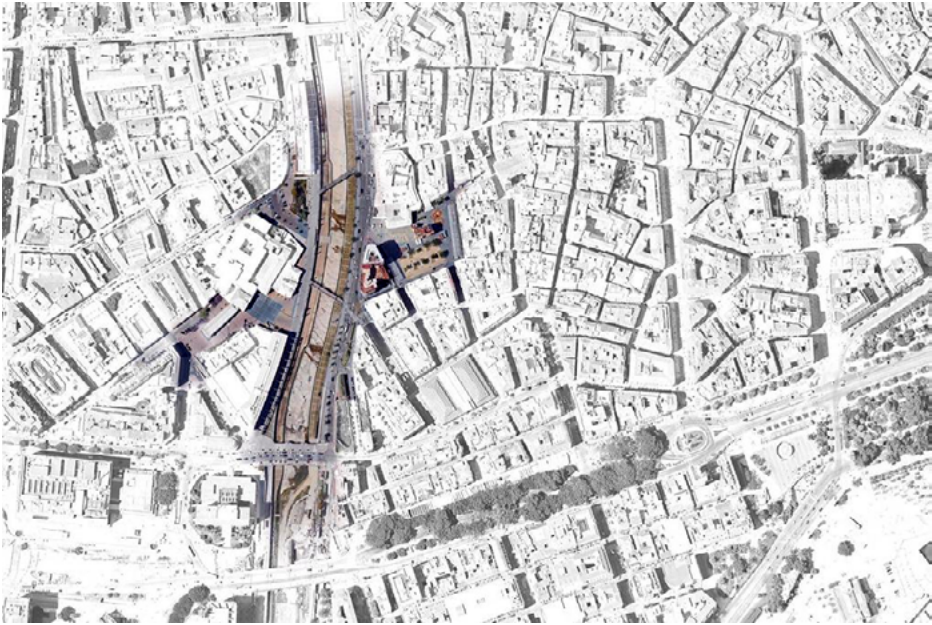
Imagen 6. Ámbito espacial de aplicación metodológica. Málaga. 2020. Elaboración: Fernando Royo.

continua alineada con las propuestas del Plan Especial y que permita al mismo tiempo la realización de microactuaciones a lo largo del espacio de integración del río con la ciudad de Málaga.