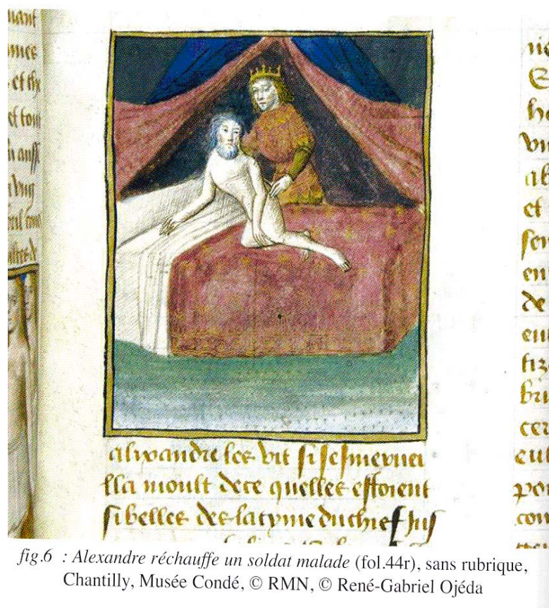
fig.6 : Alexandre réchauffe un soldat malade (fol.44r), sans rubrique, Chantilly, Musée Condé, © RMN, © René-Gabriel Ojéda

Une analyse de l'intertextualité entre la matière troyenne et les Métamorphoses ovidiennes (Anna-Maria Barbi) sert aussi à nous introduire dans l'actualité des études, de plus en plus nombreuses et profondes, sur l' Ovide moralisé , texte en vers d'auteur incertain qui vient d'être brillamment expliqué par Marylène Possamaï-Pérez 4 .