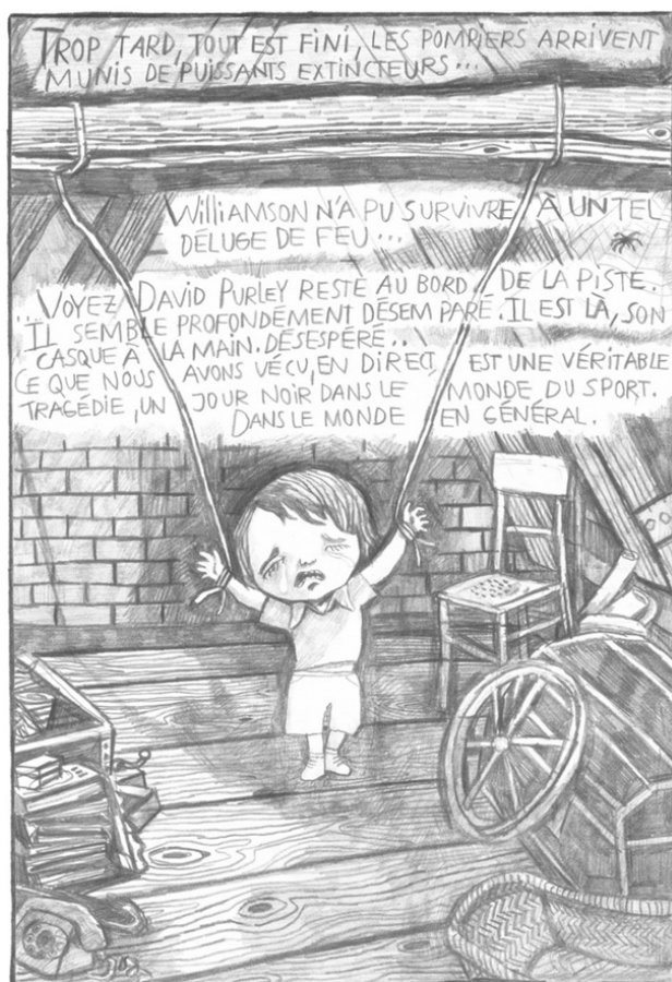
Figure 5. Planche de Faire semblant, c'est mentir (©Dominique Goblet & L'Association, 2007 : 107)

sion, représenté par les caractères en majuscule, envahit l'espace, minimisant les chances que les pleurs de la petite fille soient entendus, malgré la taille de la larme qui coule sur son visage. Toute possibilité d'appel à l'aide reste ainsi anéantie, amplifiant le caractère anxiogène de ce passage.