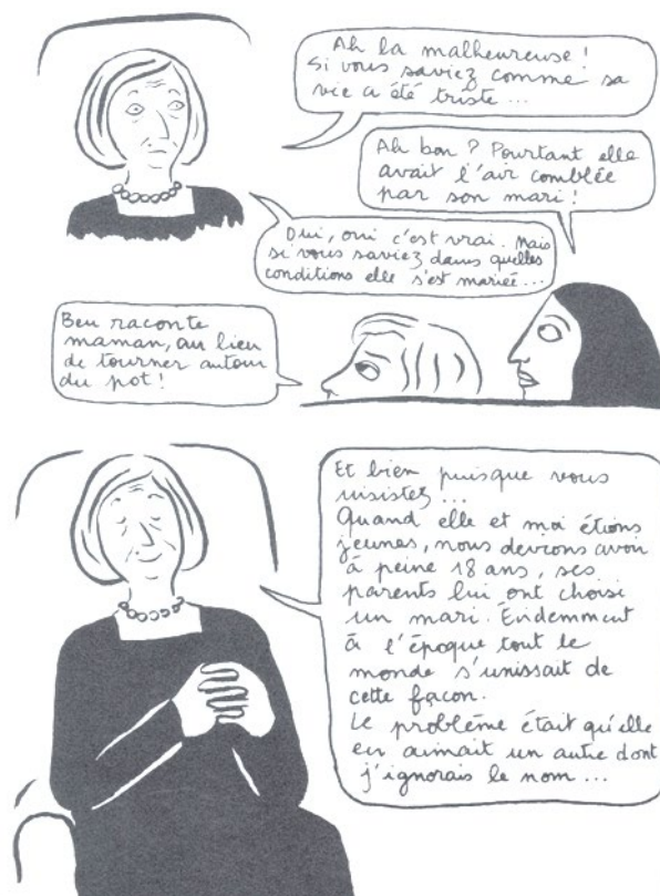
Figure 3. Planche de Broderies (© Marjane Satrapi & L'Association, 2003 : 14)

La dimension mémorielle de témoignage intime est accompagnée de fortes doses d'humour. L'un des procédés comiques le plus significatif dans Broderies , faisant