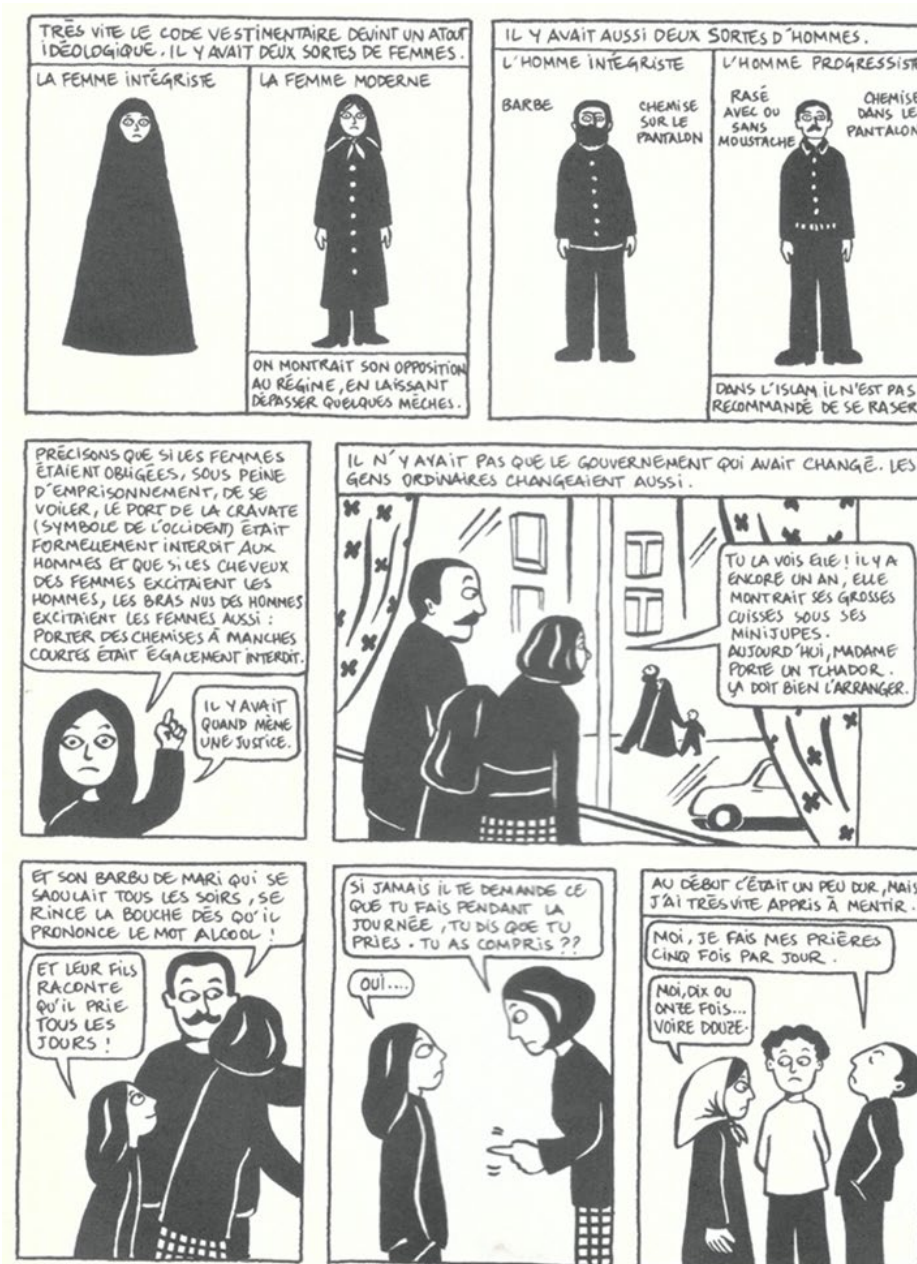
Figure 1. Planche de Persepolis 2 (©Marjane Satrapi & L'Association, 2001 : 4)

Dans Persepolis , le témoignage de Marjane alterne ses souvenirs personnels avec les références à l'histoire collective de son pays d'origine. La planche proposée fait partie du deuxième volume, qui débute avec la fermeture des universités et l'endurcissement des restrictions sociales, suite auxquelles le port du voile est décrété obligatoire. Satrapi met l'accent sur les effets que la radicalisation du gouvernement a produit sur une partie de la population.