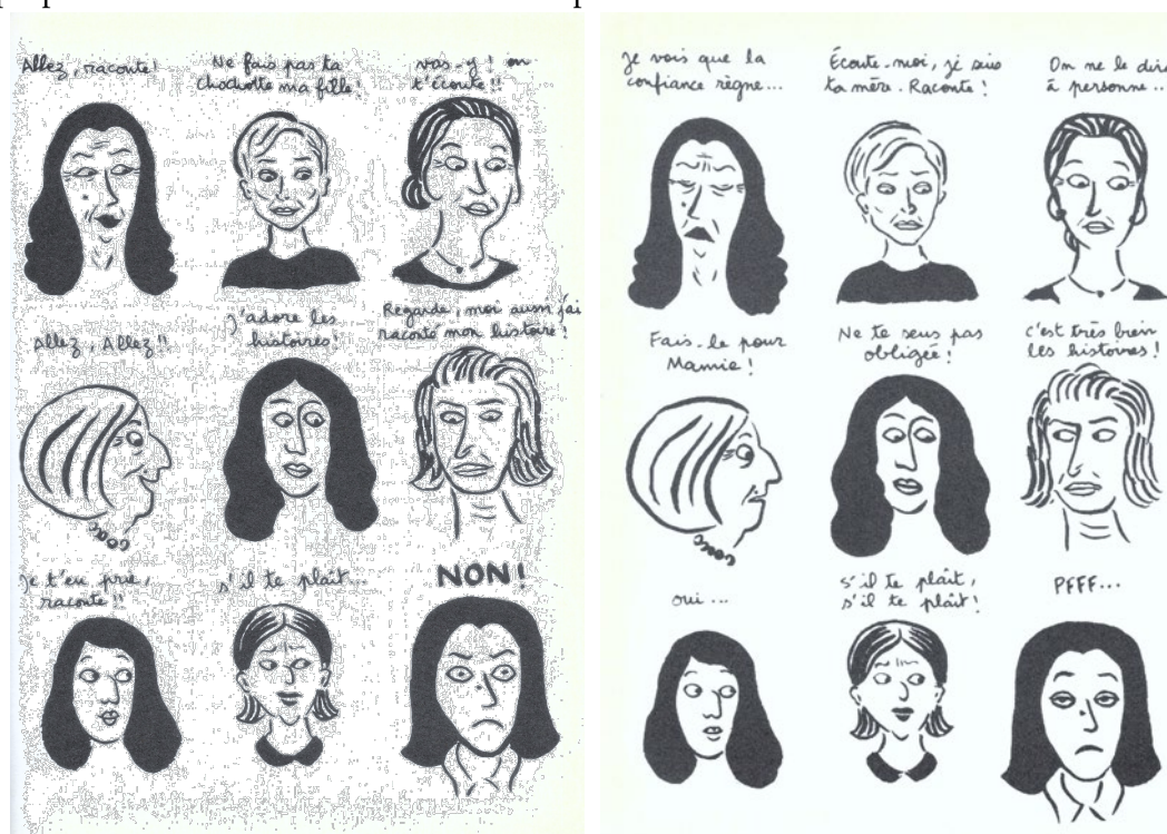
Figure 4. Planche de Broderies (©Marjane Satrapi & L'Association, 2003 : 55, 56)

Dans l'image qui accompagne ce texte, on voit la grand-mère, les yeux entrouverts, fière de l'attente suscitée par son avant-goût. Bien installée dans son canapé, les doigts entrecroisés en signe d'assurance, elle s'apprête à se plonger dans une histoire truffée de détails. L'hypertrophie du phylactère fonctionne comme aperçu d'une histoire qui s'étale sur cinq pages, avec des registres et des mises en pages de plus bariolées. Le zèle de justification initiale de la grand-mère répond au déni récurrent de se vouer aux bavardages, un sentiment généralisé chez les protagonistes. Néanmoins, l'envie de raconter et de fouiller dans la vie des autres finit par être assumée. Le deuxième extrait proposé ci-dessous constitue un bon exemple.