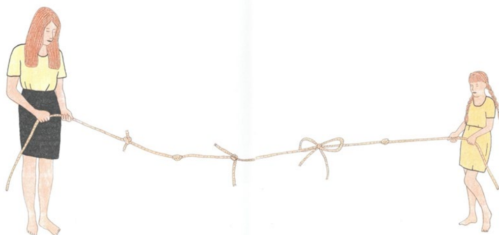
Figure 7. Double page de Les petits (©Marion Fayolle & Magnani, 2020 : 80-81)