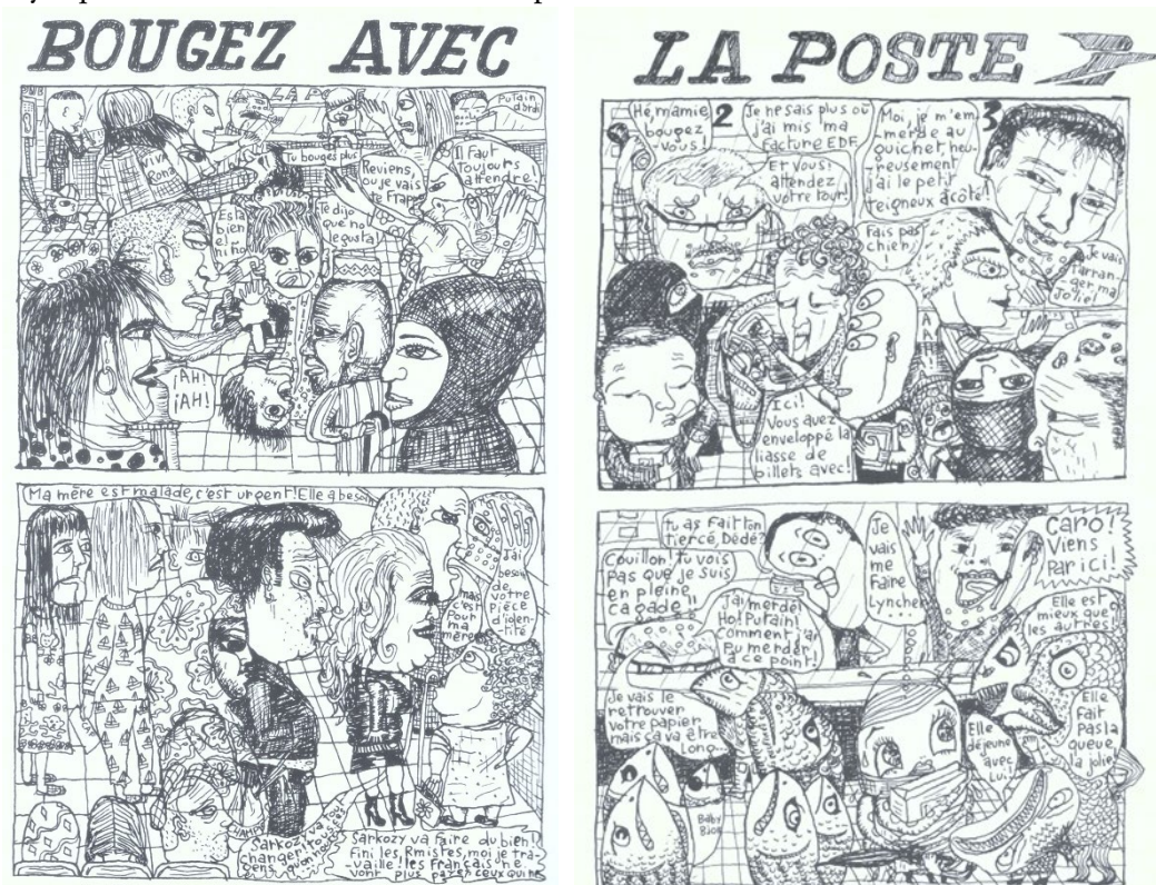
Figure 6. Double page de Cou tordu (© Caroline Sury & L'Association, 2010 : 10-11)

ils font la queue aux guichets. L'exaspération est au rendez-vous, surtout lorsqu'un employé qui connaît Caroline veut la faire passer avant.