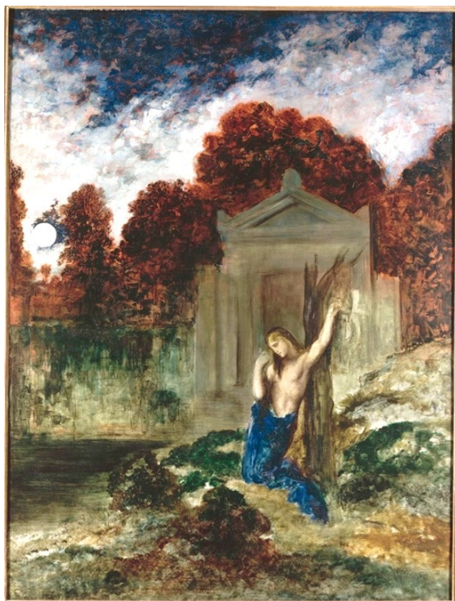
Gustave Moreau, Orphée sur la tombe d'Eurydice , 1891. Huile sur toile, 173 x 128 cm. Musée Gustave Moreau, Paris.

Le paysage funéraire comporte tout un aspect mythique et psychique donnant lieu à une constellation de symboles qui traverse différentes époques, notamment les imaginaires décadents. Étant donné que « les cimetières sont devenus des lieux de promenade publique au XIX e siècle » (Maingon, 2015 : 179), Gustave Moreau décide de recréer cet espace dans Orphée sur la tombe d'Eurydice , l'une de ses peintures mythologiques.