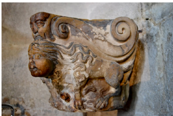
Fig. 9. Capitel con monstruo femenino reutilizado en la sacristía de la catedral de Lugo.

Partiendo de la complejidad compostelana se hace difícil poder cotejar muchas de las hipótesis planteadas con el resto que las catedrales gallegas. En primer lugar, por las discordancias cronológicas existentes entre las fábricas y porque el modelo y diseño compostelano parece pensado y ejecutado con maestría y disposición –al menos en la cabecera– para aquellos que se encargaban de la liturgia apostólica y que eran los monjes del monasterio de Antealtares. Lo que convierte al primer núcleo decorativo en un programa destinado a un público concreto, literatti , mientras aquellos que se desarrollan en portadas y en el pórtico poseen unos receptores menos específicos. Tan solo algunos capiteles conservados en la catedral de Lugo (fig. 9) (cuya cabecera fue rehecha en parte en el románico), en San Martiño de Foz (Lugo) o algunos restos figurados de la catedral de Ourense (realizados en una época de transición entre el románico y el gótico) podrían identificarse con ese público específico. Frente a este arte de primer orden vinculado a las catedrales se asiste a una eclosión figurativa que alcanza en la segunda mitad del siglo XII a buena parte del territorio gallego.