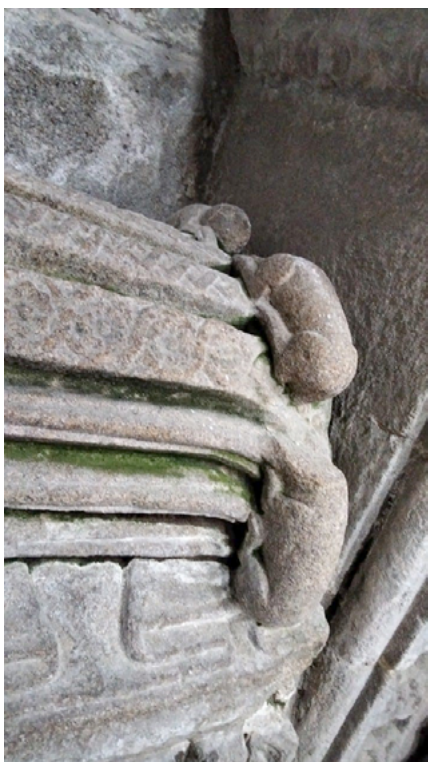
Fig. 3. Detalle de perros de compañía en el sepulcro de Constanza de Moscoso. Santo Domingo de Bonaval, Santiago de Compostela

Con respecto al aviaro medieval su presencia tiene carácter positivo bien espiritual bien ético. Así, en el cambio del románico al gótico las águilas emblemáticas de alas explayadas dejarán paso a búhos, aves de presa en escenas de caza y singulares representaciones de nidos. En el entorno cisterciense Sánchez Ameijeiras detecta la presencia de una interesante serie de representaciones de aves que ha englobado bajo el epígrafe de fauna aérea moralizadora 76 heredera de modelos de los bestiarios ingleses de finales del siglo XII y comienzos del siglo XIII con un significado claramente aleccionador y cuyo fin es recordar a los monjes el modelo de vida que se ha de seguir. Destaca en el caso orensano las zancudas que beben de un recipiente (en el presbiterio del monasterio de Oseira, Ourense) o las crías de abu-