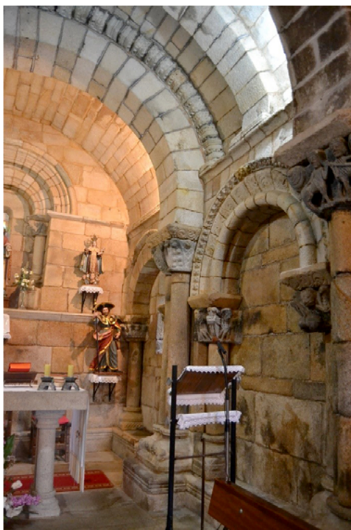
Fig. 10. Vista parcial sur de la cabecera de Santiago de Breixa.

puesto que la imagen no precisa de identificación complementaria al ser clara para el espectador-receptor 91 .