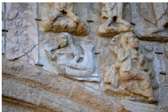
Fig. 8. Detalle del relieve de sirena reubicado en la portada de Platerías. Catedral de Santiago de Compostela (Foto GI-1907 Iacobus).

como la sirena y el centauro 84 . Ambas piezas reubicadas en Platerías, sin conexión entre ellas, originariamente presentarían una narrativa conjunta al ser asietada la sirena por el centauro 85 (fig. 8).