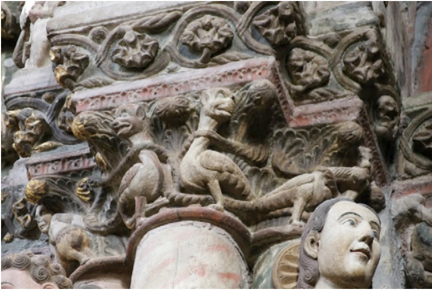
Fig. 15. Capiteles con dragones en el Pórtico del Paraíso de la catedral de Orense.

A partir del gótico la naturaleza monstruosa de los animales se mantiene en el imaginario, pero ese supuesto «real» comienza a tambalearse comenzado a aparecer cierto escepticismo en obras como la de Pedro Tafur en sus Andanzas e viajes por diversas partes del mundo ávidos , quien al referirse a estos seres puntualiza en muchos casos: «aunque esto yo no vi» 100 , es entonces cuando su representación cambia y frente a la naturaleza más cercana que se abre paso en la figuración, los monstruos se convertirán en elementos decorativos de infinitas posibilidades en relación con el marco arquitectónico que lo contiene (fig. 15).