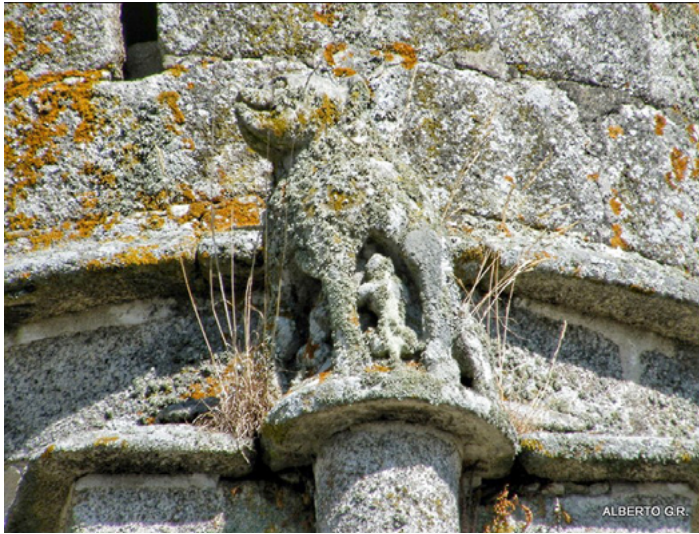
Fig. 16. Loba capitolina en la portada occidental de la Colegiata de Xunqueira de Ambía, Ourense.

se había colocado en el pórtico de la iglesia de San Juan de Letrán y que sirve para identificar el poder de la Iglesia y la herencia de un pasado romano cristianizado 101 .