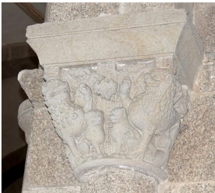
Fig. 14 Leonas y cachorros. Taller mateano, catedral de Santiago tribuna sur (Foto GI-1907 Iacobus).