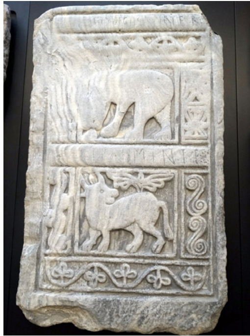
Fig. 6. Uno de los relieves de Saamasas. Museo Catedralicio de Lugo.