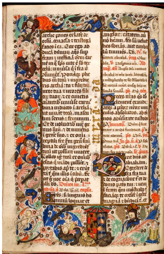
Fig. 1. Animales varios en orla. Breviario de Miranda, s. xv. ACS, CF 27, f. 49v.)

canos 50 , grullas 51 , lagartos 52 , cigüeñas 53 , polillas en abundancia 54 , panteras 55 , pavos reales 56 , cuervos 57 y gansos 58 . Su presentación decora y completa gráficas y orlas, quizá en muestra de esos competidores por el uso y dominio del mundo natural 59 .