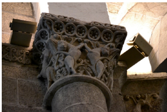
Fig. 7. Capitel con felinos, girola de la catedral compostelana.