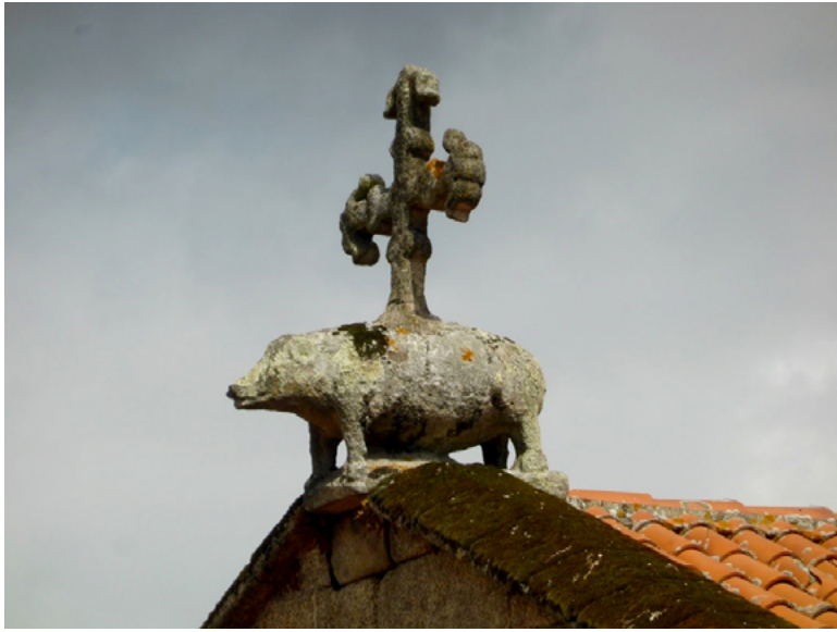
Fig. 2. Cruz y jabalí en San Francisco de Betanzos.

De animales mansos o sacrificiales que ya desde el momento románico y en el gótico sostienen las cruces que rematan los templos. Rompe esta línea la presentación del cocodrilo/¿dragón? que se puede contemplar en San Martiño de Tiobre (Betanzos, A Coruña) 74 y en Santa María de Sacos (Cotobade, Pontevedra) 75 ; o el jabalí que corona la iglesia franciscana de Betanzos y que alude al promotor del templo, Fernán Pérez de Andrade, siendo uno de sus animales-heráldicos el que sostiene la cruz del hastial del crucero norte (fig. 2).