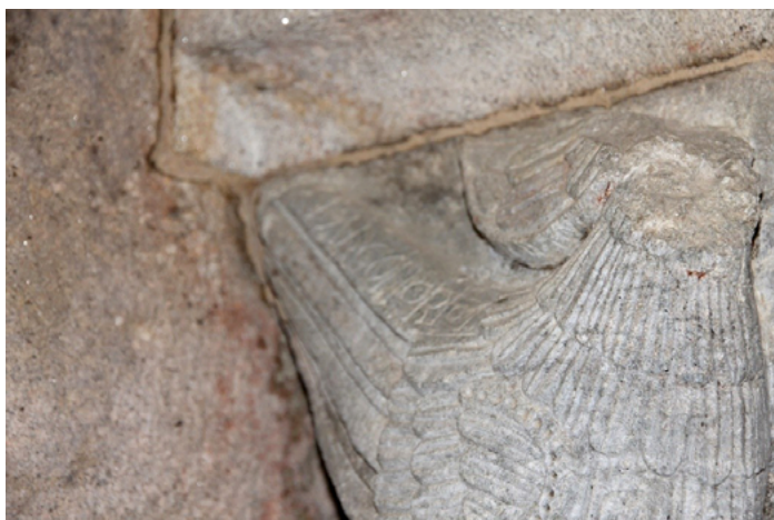
Fig. 11. Detalle del capitel con la inscripción FALCON ORIOL. Cabecera de Santiago de Breixa (Foto GI-1907 Iacobus).

(ambos textos se refieren como «falcón oriol» identificado como señor de las aves) 93 . La representación de Breixa no se corresponde, como se ha planteado con esa cronología tardía 94 , por lo que cabe pensar en la identificación posterior de las imágenes, quizás al reubicarlas en el templo remodelado. Algo similar podría pasar con el epígrafe que identifica a la arpía y que se corresponde claramente con una sirena pájaro (puesto que la arpía normalmente se representa con pezuñas y cola) 95 (fig. 12).