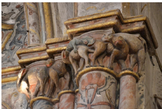
Fig. 5. Capilla mayor de Santa Clara de Pontevedra. Animales con sentido decorativo.

fuentes escritas –que ya han sido abordadas en un apartado anterior– tan solo para hilar el discurso es necesario recordar que los bestiarios, tal como señaló Victoriano Nodar, se encuentran fundamentalmente en comunidades masculinas, es decir, las encargadas de elaborar los leccionarios, los sermones y disertaciones encaminadas a corregir los comportamientos incorrectos del fiel 78 .