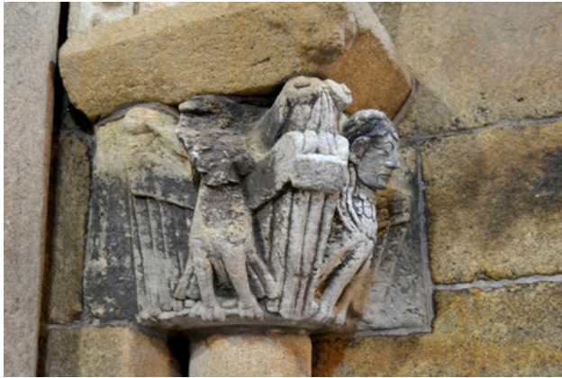
Fig. 12 Posibles sirenas pájaro identificadas erróneamente mediante un epígrafe como ARPIA. Cabecera de Santiago de Breixa.