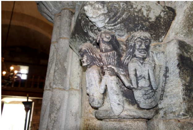
Fig. 13. Sirena pisciforme. Cabecera de Santiago de Breixa.

En Breixa también se representa la sirena-pisciforme (fig. 13) que aparece tempranamente en la catedral compostelana, pero que partir de la segunda mitad del siglo XII, se sustituye en el obrador de la catedral por la tipología de sirena-ave 96 .