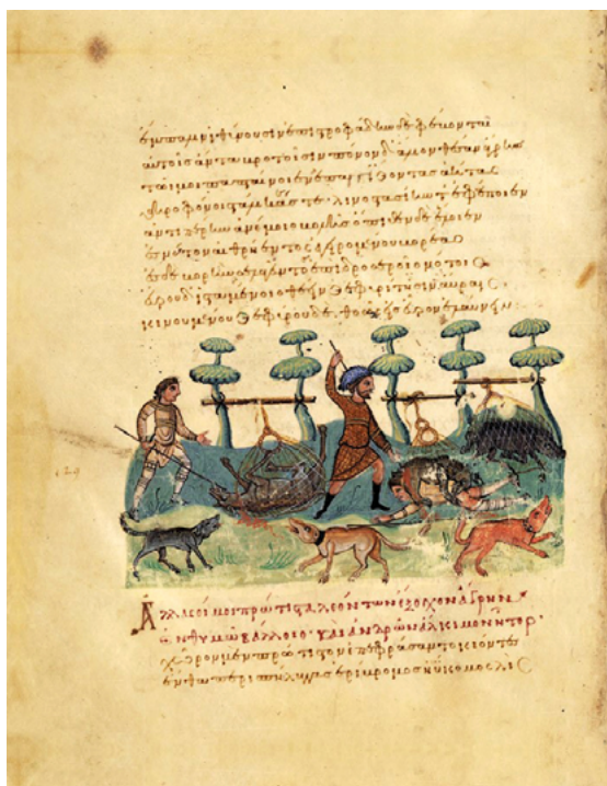
Fig. 14. Opiano de Apiamea, Cinegetica , copia miniada de pp. s. xi, Biblioteca Nazionale Marciana, Venecia, Cod.Gr.Z.479, f. 63r, © Patrimonio Ediciones [en línea]. https://patrimonioediciones.com/portfolio-item/tratado-de-caza-y-pesca/ .

La importancia que adquirió la montería en la Edad Media europea queda igualmente reflejada en los más de 150 tratados de caza conservados, entre copias y obras ex novo , que han sido fechados entre los siglos x y xv 81 . El ejemplar ilustrado más antiguo es una versión de la Cinegetica de Opiano custodiado por la Biblioteca Nacional Marciana de Venecia (fig. 14). En su folio 63r, este manuscrito presenta de forma gráfica algunos de los ingenios y técnicas de los que podía valerse el montero para cazar lobos o jabalíes. Es evidente que el arrojo y la fuerza eran requisitos necesarios, pero no menos importantes eran la perspicacia y los conocimientos para fabricar y colocar trampas, el manejo de los sonidos del cuerno y la bocina, el dominio del terreno y el adiestramiento de los perros. Estos últimos desempeñaban un papel muy activo: los sabuesos y podencos rastreaban las piezas, los galgos las