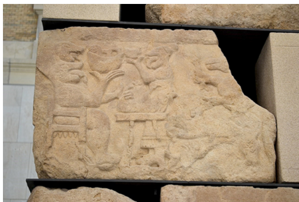
Fig. 4. Relieve del banquete, Monumento de Pozo Moro, s. VI a.C., Museo Arqueológico Nacional de España, © Jerónimo Roure Pérez / CC BY-SA 4.0 [en línea]. https://commons.wikimedia.org/wiki/Category:Monument_of_Pozo_Moro#/media/File:Relieve_de_un_sillar_con_escena_de_banquete._Monumento_de_Pozo_Moro_-_M.A.N.jpg .

tituye por la ofrenda del jabalí sacrificado, proporcionando así el estatus inmortal al interfecto 26 (fig. 4).