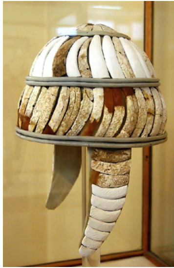
Fig. 6. Yelmo micénico de colmillos de jabalí, c. s. XIV a.C., Museo de Heraclión, Grecia, © afrank99/CC BY-SA 2.5 [en línea]. https://www.wikidata.org/wiki/Q1243176#/media/File:Eberzahnhelm_Heraklion.jpg .

ni se comieran, ni se tocaran, ni tampoco se mataran 37 . Otro episodio que conviene recordar es aquel de La Odisea en el que la hechicera Circe transforma en cerdos a algunos compañeros de Ulises, encerrándolos en unas pocilgas y ofreciéndolos como comida hayucos, bellotas y bayas de cornejo 38 .