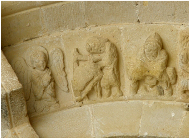
Fig. 13. Carnicero sajando el cerdo sobre un tajador, mensario de la portada de la iglesia de Beleña de Sorbe, Guadalajara, fin. s. XII.

llo 77 . Sin embargo, estas asociaciones dejaron un escasísimo eco en la iconografía, o si lo hicieron, rara vez fue antes del siglo XVI.