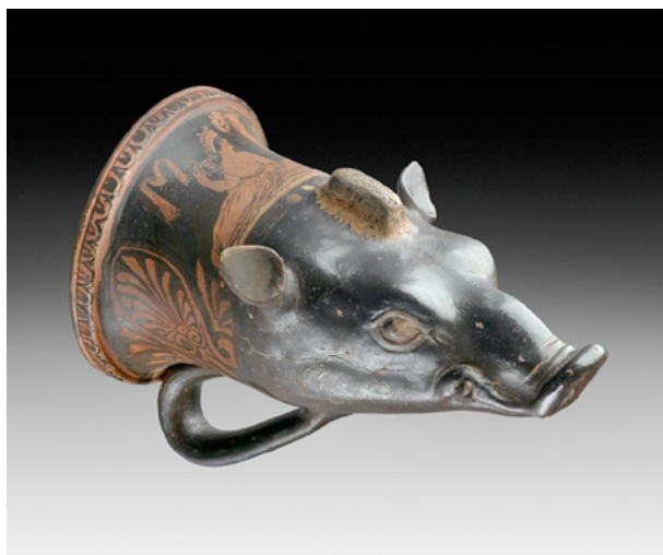
Fig. 7. Ritón griego con forma de cabeza de jabalí, proc. Apulia, c. 340-300, Museo Ashmolean, Oxford, Inglaterra.

piezas que se colocaban en estos últimos 42 , muchas veces superior al centenar, se comprende que su elaboración no solo respondía a un criterio funcional, sino también a un deseo de revestir simbólicamente de virtudes al portador 43 . Siglos más tarde, aunque quizá con una finalidad similar, los celtas, anglosajones y escandinavos remataron algunos de sus cascos con dientes o figuras de jabalí 44 .