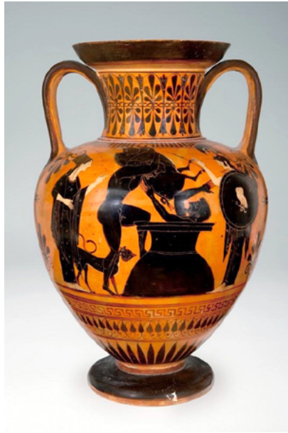
Fig. 8. Ánfora griega con la caza del jabalí de Erimanto, c. 515-500, Museo Arqueológico Nacional de España, Madrid.

por Artemisa para devastar el entorno de esta ciudad de Etolia. Sobre este último se cuenta que halló la muerte en una gran cacería encabezada por Meleagro, Atalanta y otros compañeros, y que su piel fue conservada a modo de reliquia en el Templo de Atenea en Tegea 45 . La madre de este jabalí, según Estrabón, habría sido la cerda de Cromión, otro temible ser criado por la anciana Faia que causó graves estragos en Megara y Corinto antes de ser derrotado por Teseo 46 .