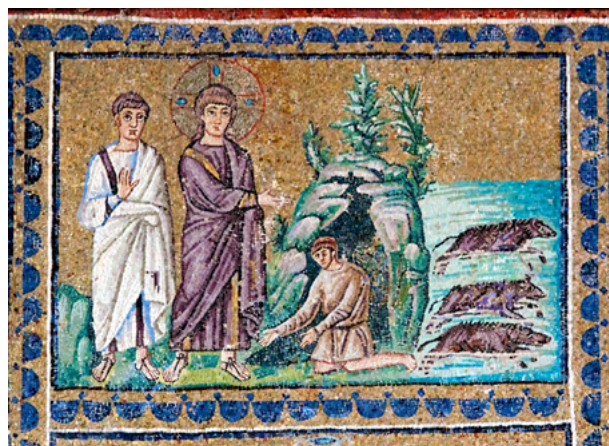
Fig. 11. Exorcismo al endemoniado de Gerasa, mosaico de la basílica de San Apolinar Nuevo, s. VI, Rávena, Italia [en línea]. https://upload.wikimedia.org/wikipedia/commons/4/4b/Mosaic_of_the_exorcism_of_the_Gerasene_demoniac_from_the_Basilica_of_Sant%27Apollinare_Nuovo.jpg .

Ya durante el Bajo Imperio, hacia el año 350, se compuso el Testamentum Porcelli , que es uno de los más burlescos e hilarantes relatos conservados sobre el cerdo. Referido por el mismísimo san Jerónimo, esta fabulilla con las últimas voluntades de un puercito que iba a ser sacrificado era cantada por los niños en las escuelas con gran alborozo 51 . Así, entre agravios y burlas, la historia del cerdo penetraba en la Edad Media 52 .