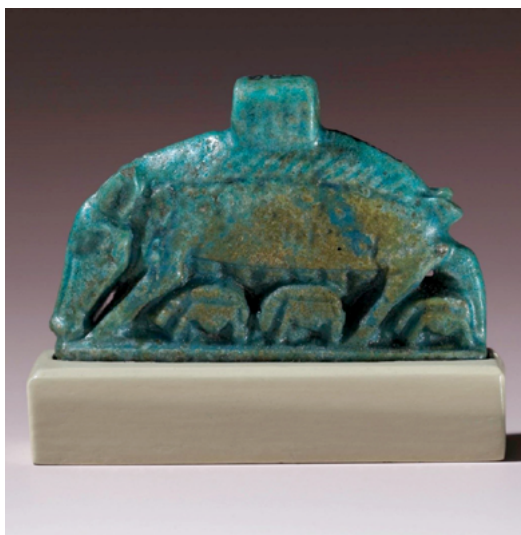
Fig. 3. Amuleto de fayenza de la diosa Nut representada como una cerda amamantando a sus crías, Egipto, c. 664-525 a.C., Museo Británico de Londres, © The Trustees of the British Museum / CC BY-SA 4.0.

plásticas durante el periodo dinástico 14 . De época posterior son algunos pictogramas jeroglíficos o los pequeños amuletos de fayenza y estatuillas donde la diosa Nut, madre de Osiris, Isis y Horus, aparece representada como una cerda que amamanta a sus crías 15 (fig. 3). Nótese que este iconograma, ciertamente parecido al de la loba capitolina con Rómulo y Remo, fue recuperado en la Europa bajomedieval para explicitar el tema antisemita de la judensau o la cerda amamantando a los judíos.