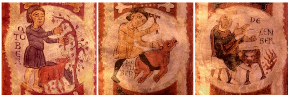
Fig. 12. Representación de los meses de octubre, noviembre y diciembre, mensario de la Real Colegiata de San Isidoro de León, c. 1170. © Antonio García Omedes.

su sanmartín: «avaros y puercos vivos, dos cochinos; avaros y puercos muertos, dos tesoros ciertos». La mala reputación acababa, pues, con el sacrificio, ya que en ese preciso momento se obraba el milagro de convertir al sucio carroñero en una despensa de carne exquisita. El matarife realizaba las operaciones pertinentes según un ritual codificado que apenas sufrió cambios desde la época feudal hasta hace unas décadas. Los mensarios románicos lo presentan ejecutando toda clase de trucos para inmovilizar al animal y portando un gran cuchillo, un hacha o una maza para degollarlo o abatirlo. Luego, tras la recogida de la sangre, el raspado de las cerdas y el lavado, los trabajos de charcutería se extendían durante varios días con el objetivo de proceder a la preparación, almacenamiento y comercialización de las carnes 73 . Una excepcional versión de ello aparece en el mensario de Beleña de Sorbe (fin. s. XII), donde se observa al carnicero sajando al cerdo ya muerto sobre un tajador 74 (fig. 13).