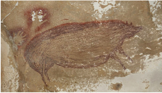
Fig. 1. Jabalí, cueva de Leang Tedongnge, isla de Celebes, Indonesia, c. 43500 a.C.

Sus scrofa . Este último se distribuía por casi toda Eurasia desde tiempos inmemoriales, con lo cual no resulta extraño que la representación zoomorfa más primitiva de la que se tiene noticia se corresponda, precisamente, con un grupo de cuatro jabalíes verrugosos pintados en la cueva indonesia de Leang Tedongnge, ubicada al suroeste de la isla de Célebes. Con una antigüedad de más de 45 500 años, este conjunto de arte parietal destaca sobre todo por la figura extraordinariamente conservada de uno de estos animales, ejecutada de perfil, con un sentido naturalista y un tamaño que alcanza los 136 cm de largo por 54 de alto 2 (fig. 1).