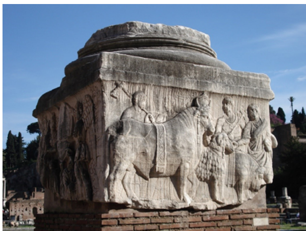
Fig. 10. Relieve de la Suovetaurilia en la basa de la Columna de la Decenalia, s. IV d.C., ruinas del foro de Roma, Italia

nario de este animal, o en los recetarios de la época. En Roma aún más que en Grecia, las viandas porcinas fueron el producto más apreciado de la carnicería por su elevado aporte calórico y su versatilidad en la cocina. De ellas decía Plinio el Viejo que ofrecían hasta cincuenta sabores distintos, puesto que cada corte del cerdo se aprovechaba y degustaba 49 . Sin embargo, en contraposición a esa admiración por su valor alimenticio, este mismo autor bautizó al puerco como «el más estúpido de todos los animales», situándolo al frente de una retahíla de fábulas desagradables o siniestras 50 .