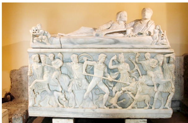
Fig. 9. Sarcófago romano con la caza del jabalí de Calidón, procedente de Vicovaro, c. 200-250, Palacio de los Conservadores, Roma, © José Luiz Bernardes Ribeiro/CC BY-SA 4.0 [en línea]. https://upload.wikimedia.org/wikipedia/commons/3/3d/Sarcophagus_with_the_Calydonian_boar_hunt_-_Palazzo_dei_Conservatori_-_Musei_Capitolini_-_Rome_2016.jpg .

zando al jabalí de Erimanto sobre Euristeo ante la atenta mirada de Atenea y Artemisa. Existen objetos muy similares a este en su estilo y temática, como los que se exponen en el Museo del Louvre y el Museo Británico, entre otros.