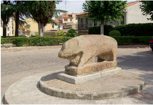
Fig. 5. Verraco, ss. IV-I a.C., Ciudad Rodrigo, Salamanca, © Concepción Amat Orta / CC BY 3.0 [en línea]. https://upload.wikimedia.org/wikipedia/commons/a/af/%C2%AE_CIUDAD_RODRIGO_PARADOR_NACIONAL_ENRIQUE_II_DE_TRASTAMARA_-_panoramio_%288%29.jpg .

jabalíes, tres de los cuales se disponen alrededor de un individuo que podría representar a una divinidad 29 .