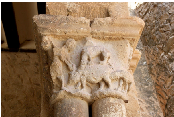
Fig. 15. Caza del jabalí, capitel del pórtico de la iglesia de San Pedro de Caracena, Soria, c. 1182.

perseguían, y los mastines, lebreles, dogos y alanos se encargaban de sujetarlas para que el cazador las rematase 82 .