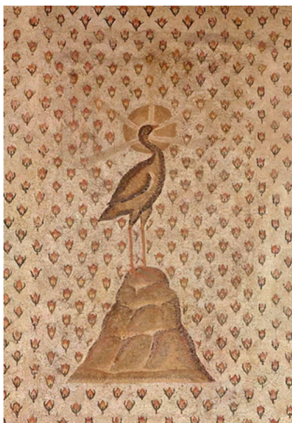
Fig. 5. Mosaico procedente de una villa en Dafné (Antioquía) datado de finales del siglo v d.C. Expuesto de manera parcial en el Museo del Louvre ©Creative Commons.

ese momento final y paradójicamente inicial del ave fénix, donde se representa de manera esquematizada una montaña, lugar donde creaba su pira para morir y renacer. La actitud que emana de esta ave, con las patas erguidas, en la cima y la mirada hacia arriba, es una imagen de triunfo en sí misma.