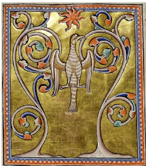
Fig. 11. Bestiario de Aberdeen, Aberdeen University Library MS 24, siglo XII, folio 55v ©Commons.

las alas y buscando el sol (fig. 11) 91 . Y una segunda imagen con el ave fénix volviéndose hacia el sol, dibujado en su parte alta, batiendo las alas para avivar las llamas mientras se consume, tal y como explica el texto. Esta representación tendría un carácter dual a ojos de quienes la contemplaran, porque también escenifica el momento en el que esta ave está resurgiendo de sus propias cenizas, símbolo de la resurrección (fig. 12) 92 .