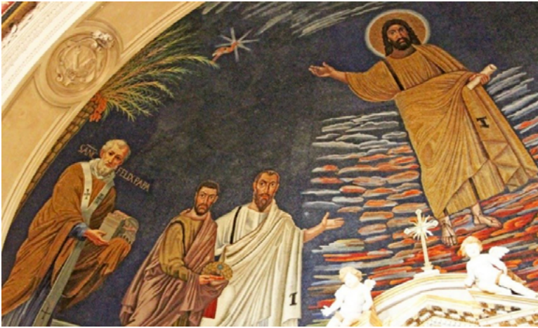
Fig. 10. Mosaico absidal de San Cosme y San Damián (Roma), 526-530 d.C.

estrella que alude simbólicamente a las palabras del Juicio Supremo 82 «Yo, Jesús, [...] Yo soy la raíz y el linaje de David, la estrella brillante de la mañana» 83 (fig. 10).