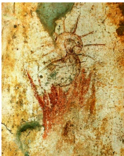
Fig. 6. Pintura mural de la Capilla Griega de las catacumbas de Priscila (Roma), mediados s. III d.C.

ahí la fácil equiparación. Ubicado en un lugar tan simbólico como las catacumbas, su intención sería fortalecer el ánimo de todo aquel que contemplara esta imagen, puesto que enviaba el mensaje de que el sufrimiento y persecución terrenal sería recompensado con creces en la vida del más allá. Es una iconografía perfectamente medida, porque representa el momento mismo de la combustión del fénix, es decir, en medio de su propia cremación entre las llamas. El que lo contemplaba asumiría que se trataría de una muerte temporal con carácter victorioso, puesto que por encima de ella estaría la inmortalidad del alma 73 .