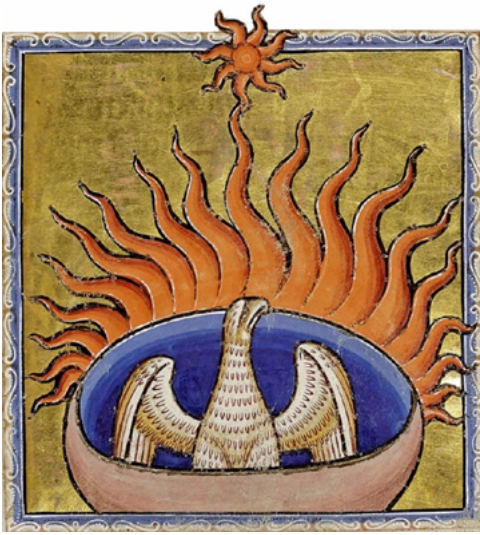
Fig. 12. Bestiario de Aberdeen, Aberdeen University Library MS 24, siglo XII, folio 56r ©Commons.