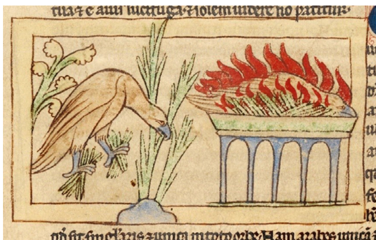
Fig. 14. Bestiario de Northumberland, Ms. 100, fol. 41v, realizado hacia 1250-1260 © [en línea].

https://bestiary.ca/beasts/beast149.htm .