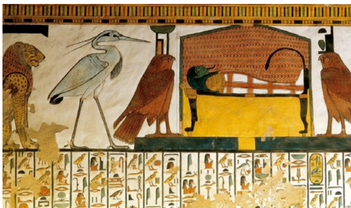
Fig. 3. Pintura el muro oeste de la antecámara de la tumba de Nefertari, ca 1292-1225 a.C., Valle de las Reinas (QV 66)

minados palmerales podías alcanzar una suerte de vida eterna. Es por este motivo que desde época temprana el ave fénix, con estas mismas connotaciones, apareció relacionada de manera indisociable a la palmera 12 .