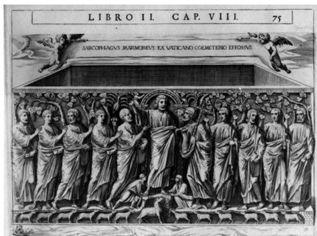
Fig. 9. Sarcófago de mármol datado del 380-400 d.C., basílica de San Pedro del Vaticano ©Vaticano.

La representación conjunta de la palmera y el ave fénix en las escenas relativas a la Traditio legis fue recurrente en la iconografía de la Tardía Antigüedad 79 . En las imágenes del san Giovanni in Fonte de Nápoles las escenas de Traditio legis y el fénix estaban diferenciadas, no será así en otros casos, donde el ave aparece posada directamente en la palmera. Como hemos visto ya, es una asociación antigua que se hizo de manera explícita en el mundo griego por la agrupación del nombre que compartían la planta y el ave ( Phoinix ) y la idea de inmortalidad que recaía sobre ambos. Esto hizo que muchos autores incluso situaran el nido del fénix en la copa de una palmera 80 . De esta manera se entiende su aparición en sarcófagos desde al menos el siglo IV d.C. donde el soporte de carácter funerario enfatiza esta idea de morir y renacer que acompañó al ave. Es el caso del sarcófago de mármol datado del 380-400 d.C. conservado en la basílica de San Pedro del Vaticano 81 , donde el ave con la cabeza alta se encuentra posada en una palmera rodeada de vides, símbolo de la sangre de Cristo y la Eucaristía (fig. 9). O incluso de manera más tardía en iconografías como la del mosaico absidal de San Cosme y San Damián (Roma) datado del 526-530 d.C., donde en la rama de la palmera se posa el fénix coronado por la