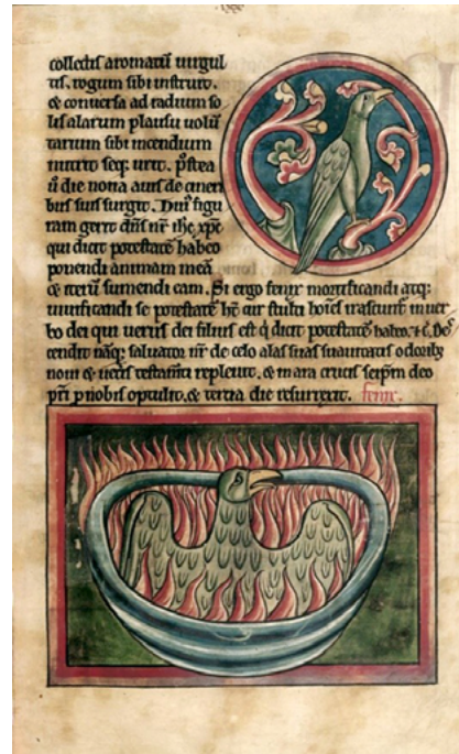
Fig. 13. Harley Ms. 4751, fol. 45, Biblioteca Británica, hacia 1225-1250 © [en línea]. https://bestiary.ca/beasts/beat149.htm .

Bestiario de Northumberland de iluminador desconocido realizado hacia 1250-1260 (fig. 14) 94 . La imagen en dos secuencias hace hincapié en estos dos aspectos de esta ave: por un lado, la preparación de su propia pira y por otro su cremación/resurrección de sus cenizas, convirtiendo la muerte en vida y accediendo a ella por su preparación terrenal. El propio fénix está construyendo su pira funeraria, para lo cual está recolectando y transportando plantas. Esta iconografía hilaria de lleno con la tradición antigua de los rituales funerarios y preparatorios que se hacían cuando alguien fallecía, dotándole al fénix de la humanidad y el raciocinio propios de la especie humana, capaz de enterrar a sus muertos. También hace hincapié en la idea de que durante la vida terrenal tenemos que prepararnos para la vida en el más allá. En la imagen de la derecha, yace entre las llamas sobre la pira funeraria que él mismo ha construido.