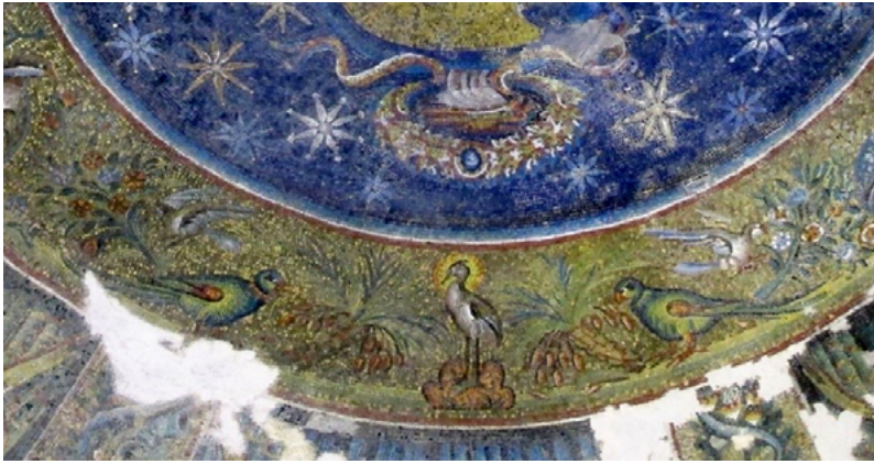
Fig. 8. Mosaico del baptisterio de San Giovanni in Fonte de Nápoles datado de principios del siglo v.

decorado con ramas, palmeras, cestas de fruta y diferentes aves. Un lugar primordial lo ocupa el fénix nimbado plasmado entre las llamas en el momento mismo de su cremación y que tiene a cada lado una palmera. La relación del ave fénix y la palmera es antigua, como hemos señalado en apartados anteriores, e incidiría en la idea de victoria sobre la muerte y resurrección de la carne que van unidos al sacramento del bautismo.