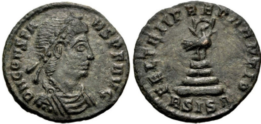
Fig. 4. Constancio, 347/40-350 d.C. Æ Follis (18mm, 2.71 g, 6h) ©Coinarchives.

Insistiremos entonces en algunos ejemplos numismáticos particularmente interesantes donde se representa el momento de la muerte del fénix. Constancio II, hijo de Constantino, realizó varias emisiones en las que en el reverso aparecía el ave fénix nimbado encima de su pira funeraria. Es el caso de la de 347/48-350 d.C. (fig. 4) con la inscripción FEL TEMP, abreviación de la forma latina FEL(ICIVM) TEMP(ORVM) REPARATIO o «vuelta a los tiempos felices» 42 . Es evidente que las monedas eran (y son a lo largo de la historia) un objeto codiciado, que recorría grandes distancias y cuya iconografía estaba muy meditada dado el gran impacto que tenía en la población. Había muy poco espacio, por lo que de manera extensiva en la historia se ha buscado el incluir una imagen que transmita un mensaje fácilmente comprensible y que fuera crucial para los organismos de poder. La elección en ellas del fénix nimbado, es decir, vinculado con la divinidad solar y en el momento de morir y renacer en su pira funeraria, es, por tanto, tremendamente significativa.