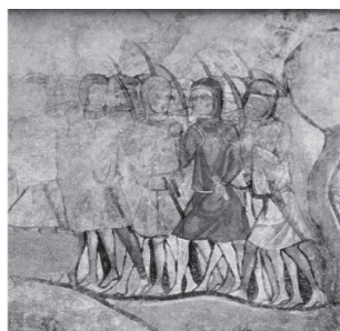
Fig. 9. Pinturas del Salón del Tinell. Palacio Real Mayor (Barcelona). Detalle. Museu Ciutat de Barcelona.