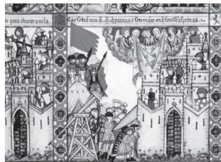
Fig. 4. Cantiga XXVIII. Sitio de Constantinopla. El Escorial. Biblioteca del Real Monasterio, Ms. T. i. 1, fol. 43, 40.