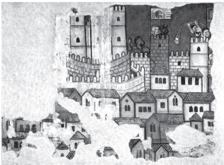
Fig. 11. Pinturas del Palacio de Aguilar (Barcelona). Detalle. Museu Nacional d'Art de Catalunya.