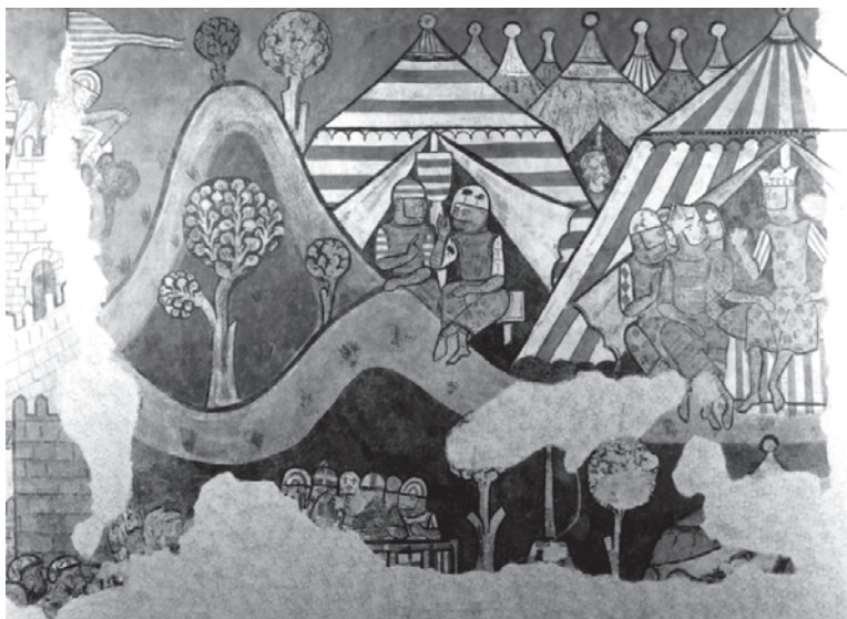
Fig. 10. Pinturas del Palacio de Aguilar (Barcelona). Detalle. Museu Nacional d'Art de Catalunya.