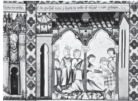
Fig. 2. Cantiga CXXVI. Sitio de Elche. El Escorial. Biblioteca del Real Monasterio, Ms. T. i. 1, fol. 179, 20.