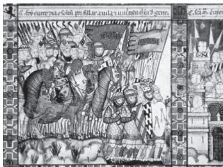
Fig. 5. Cantiga CLXV.

Defensa de Tortosa de Ultramar. El Escorial. Biblioteca del Real Monasterio, Ms. T. i. 1, fol. 221v., 50.