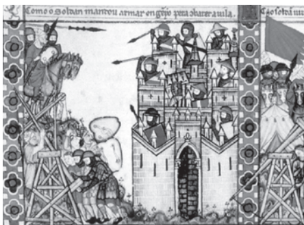
Fig. 3. Cantiga XXVIII. Sitio de Constantinopla. El Escorial. Biblioteca del Real Monasterio, Ms. T. i. 1, fol. 43, 30.