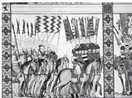
Fig. 7. Cantiga CLXXXI. Sitio de Marraquech. El Escorial. Biblioteca del Real Monasterio, Ms. T. i. 1, fol. 240, 30. (Foto: Patrimonio Nacional)

Defensa de Tortosa de Ultramar. El Escorial. Biblioteca del Real Monasterio, Ms. T. i. 1, fol. 221v., 60. (Foto: Patrimonio Nacional)