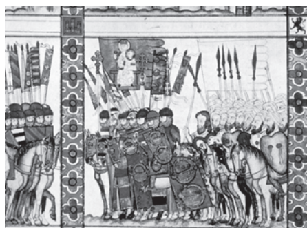
Fig. 8. Cantiga CLXXXI. Sitio de Marraquech. El Escorial. Biblioteca del Real Monasterio, Ms. T. i. 1, fol. 240, 40.