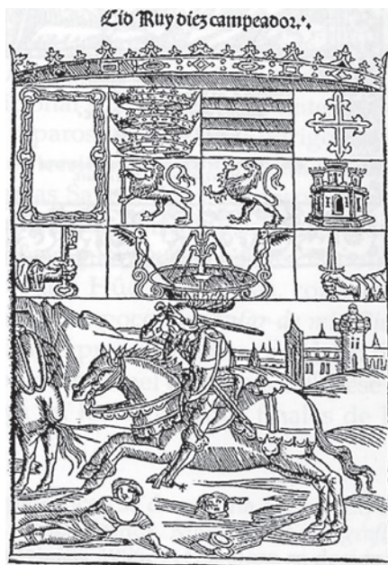
Foto 3. Crónica del Cid . Burgos. 1512.

Este hecho fue, sin duda, un aldabonazo en la mente de los monjes. La abadía se ratificó en la idea de que la figura de don Rodrigo era en uno de sus principales activos. En este sentido, la reacción fue rápida. Si el Regimiento de la Ciudad trataba de apropiarse del Campeador, como veremos a continuación, desde una perspectiva civil —identificando las virtudes laicas del mismo con las de la urbe— el monasterio procuraba exaltar, hasta el extremo, sus virtudes cristianas, aspecto éste que sí que podían patrimonializar los religiosos de forma exclusiva.