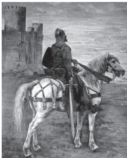
Foto 18. Marceliano Santa María. Se va ensanchando Castilla . 1906. Burgos. Casa Consistorial.

producciones. Junto a don Rodrigo —que aparece en una actitud más meditativa que guerrera— encontramos un gran desarrollo del paisaje, casi en pie de igual y compartiendo protagonismo con él. El paisaje realista se había convertido en uno de los temas fundamentales en la pintura española desde que Carlos Haes y sus discípulos iniciaron sus actuaciones artísticas en la segunda mitad del siglo XIX 50 . Tras unos primeros momentos, esencialmente esteticistas, este género alcanzó un nuevo significado en los años de cambio de siglo. En este sentido, los intelectuales del 98, los regeneracionistas y muchos de los miembros de la Institución Libre de Enseñanza se hallan en la base de la transformación del concepto de paisaje. Los noventayochistas —frente a los románticos españoles y extranjeros que habían quedado seducidos por la anécdota y el costumbrismo y a Carlos Haes y sus seguidores atraídos por la belleza de los paisajes periféricos peninsulares 51 — entendieron el paisajismo como un intento de plasmar el alma y las esencias profundas de una tierra. El 98 vio en Castilla —en el centro de la península y no en Andalucía como los románticos— el alma del país, la médula de España. Tierras gastadas, secas, agostadas por los siglos, que habían entregado todo lo que tenían que entregar y en las que aún quedaban muñones de ese pasado en sus hitos monumentales y en sus propias gentes. Esta obra ha de ponerse en relación con algunas de las creaciones