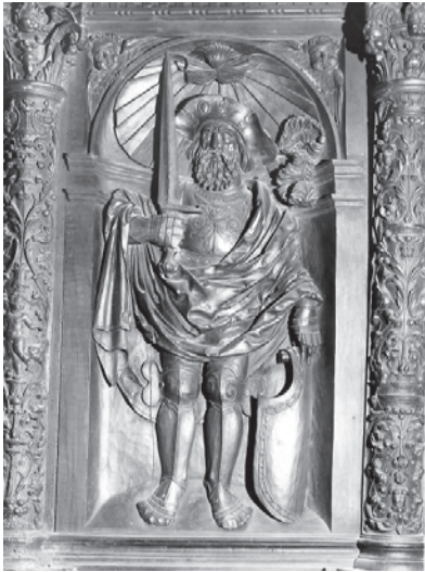
Foto 4. Respaldo de la silla del Monasterio de San Pedro de Cardaña en el Monasterio de San Benito de Valladolid. Andrés de Nájera. h. 1525.