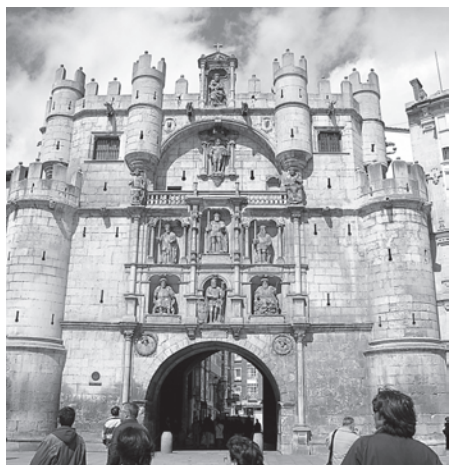
Foto 10. Fachada principal del Arco de Santa María de Burgos. 1531-1553.