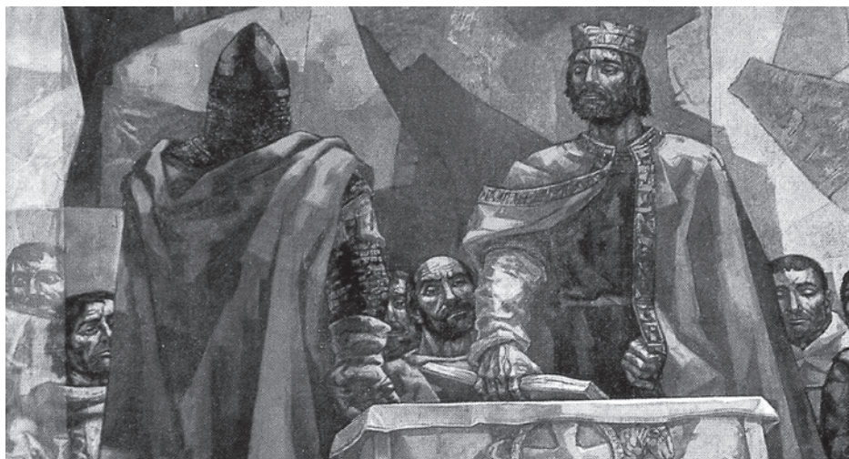
Foto 9. José Vela Zanetti. La Jura de Santa Gadea (detalle). 1970. Palacio de la Diputación Provincial de Burgos.