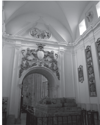
Foto 8. Capilla nueva del Cid. Monasterio de San Pedro de Cardeña. 1734.

sentido, su actividad como defensor de la Cristiandad, luchando contra los moros, se veía como claro elemento constitutivo de santidad. Así debe entenderse en un contexto en que, desde la Edad Media, se hizo partícipes a muchos santos —no sólo a Santiago— en intervenciones militares prodigiosas a favor de los cristianos en lucha con los musulmanes. Ya antes, en el siglo xvii, Fernán González había sido presentado así en San Pedro de Arlanza, inspirándose no sólo en Santiago sino en otros santos-religiosos ecuestres como san Millán e incluso san Isidoro 12 .