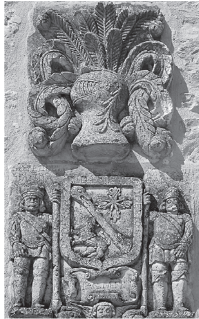
Foto 13. Escudo de la familia Alonso. Villaescusa de Butrón (Burgos)

gicas, la intención de estas representaciones era señalar que el rey era heredero no sólo de sangre de esas figuras —descendientes, según la tradición recogida por Alonso de Cartagena del mundo godo 29 —, sino también de todas las virtudes que adornaron a esos personajes: valentía, justicia, discernimiento en el buen gobierno... [Foto 12]. Quizá, también, de forma discretísima, se estaba intentando recordar cómo debía actuar la monarquía en relación con Burgos.