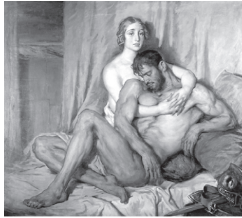
Foto 20. Marceliano Santa María. Figuras de Romance . 1934. Burgos. Arco de Santa María.

humanización de la figura del Cid, que había quedado apuntada en Se va ensanchando Castilla , logra aquí sus más altas cotas al mostrar, con un dominio de lo sensual evidente, a don Rodrigo y doña Jimena en actitud amorosa. El tema del reposo del guerrero y la tradición clásica de Marte y Venus se hallan muy presentes en esta singular pintura 60 . Así como el Triunfo de la Cruz fue el canto del cisne de la pintura de Historia, Figuras de Romance fue uno de los gloriosos epígonos del Simbolismo español y sirvió para representar, como nunca antes se había hecho, la figura de un Campeador íntimo y sensual, despojado de cualquier atisbo heroico y teatral.