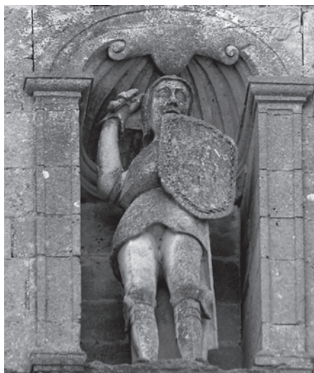
Foto 6. El Cid en el remate de la fachada del Monasterio de San Pedro de Cardeña. h. 1570.