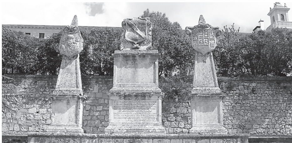
Foto 16. Solar del Cid. Burgos. 1784.

que interiorizó, hasta la extenuación, la máxima manriqueña de que cualquier tiempo pasado fue mejor .