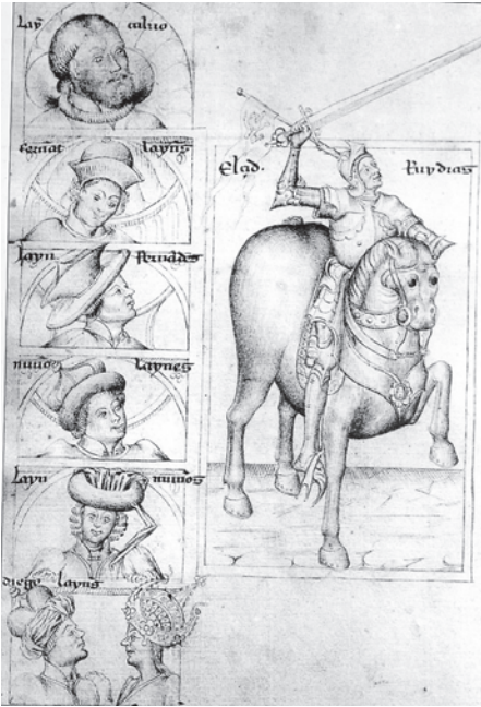
Foto 12. Sala de la Poridad del Arco de Santa María de Burgos.