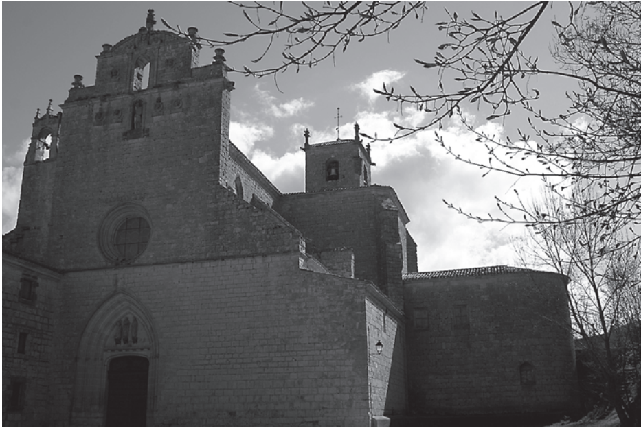
Foto 1. Iglesia del Monasterio de San Pedro de Cardena, reconstruida a mediados del siglo xv.

respecto al poder real. Es, probablemente, en esos momentos cuando comenzó a tejerse esa Leyenda de Cardena en la que Rodrigo aparece como aliado de la casa monástica, mostrándose ésta junto al héroe como detractora de las arbitrariedades regias. Se inicia aquí el proceso de identificación estrechísima y potente de Cardena con el Cid que se mantendrá a lo largo de toda la historia. No fue el infanzón de Vivar quien se identificó con el cenobio sino éste con el Campeador muchos años más tarde de su muerte.