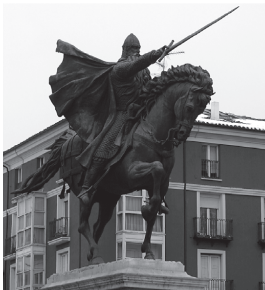
Foto 22. Juan Cristóbal. Monumento ecuestre al Cid Campeador. 1955. Burgos.

salía de su temporal decadencia en esa nueva época que se alumbra tras la Guerra Civil. Precisamente eran aquellos que habían negado las virtudes cidianas, quienes habían renegado del héroe burgalés como ejemplo, los que representaban esa otra España decadente que había sido superada: «Así pudo llegarse a esa monstruosidad de alardear de cerrar con siete llaves el sepulcro del Cid. ¡El gran miedo a que el Cid saliera de su tumba y encarnase en las nuevas generaciones! Que surgiera de nuevo el pueblo recio y viril de Santa Gadea y no el dócil de los trepadores, cortesanos y negociantes. Éste ha sido el gran servicio de nuestra Cruzada, la virtud de nuestro Movimiento: haber despertado en las nuevas generaciones la conciencia de lo que fuimos, de lo que somos y de lo que podemos ser. Que esta egregia figura, asentada en esta capital histórica, Cabeza de Castilla sea, con el recuerdo de la España eterna, el símbolo de la España nueva» 75 .