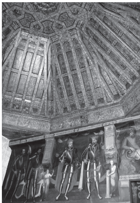
Foto 14. Jorge Inglés (:) El Cid en la Anacephaleosis de Alonso de Cartagena.