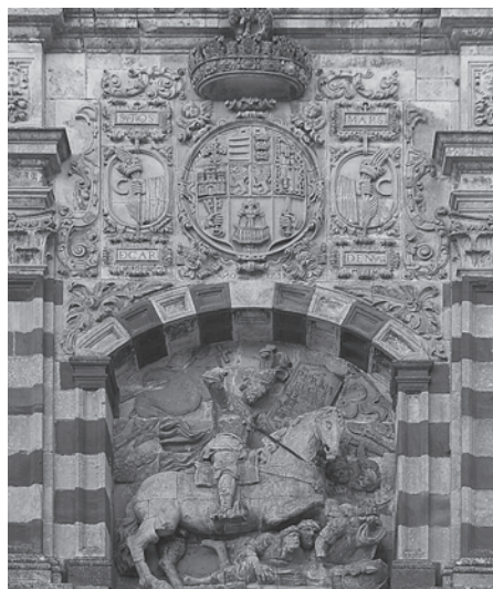
Foto 7. El Cid en la fachada del Monasterio San Pedro de Cardeña. h. 1739.

1657), intenta mostrar un semblante menos fantástico de este personaje. Vemos cómo —tanto desde la crítica historiográfica como desde la literatura— comienza a atacarse esa imagen tan estereotipada y engrandecida del Campeador.