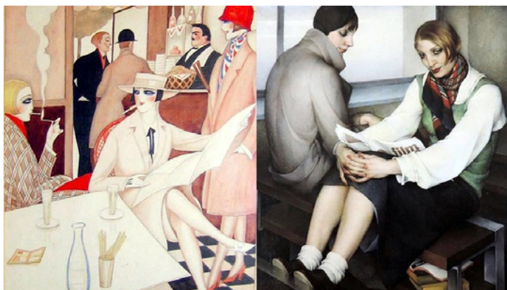
Imágenes 2 y 3.

le reporta sus primeras ganancias económicas— y de experiencias afectivas y sexuales con mujeres.