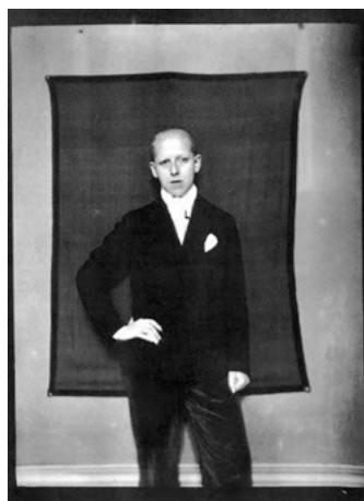
Imágenes 8 y 9.

Apunta Estrella de Diego que «solo hay algo más femenino que una mujer y más masculino que un hombre: su esencia, sus rasgos sobresalientes» (26). Por eso no extraña que las corbatas, las solapas de las americanas o los pantalones de corte recto, sobre los cuerpos de estas mujeres, nos remitan a la masculinidad, nos ofrezcan la siempre perturbadora y fascinante visión de lo andrógino. Un viraje de la identidad femenina que se observa en la imagen de otras mujeres fundamentales de la modernidad, como la periodista y viajera Annemarie Schwarzenbach o la surrealista francesa Claude Cahun 11 . Arriba (imágenes 8 y 9), sus fotografías: cabellos cortos, camisas, trajes, corbatas, cigarrillos y actitud seria o distante que no busca la complacencia del espectador.