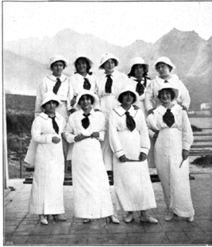
Distinguidas y bellas señoritas de Santa Cruz de Tenerife, vencedoras en las regatas en canoas organizadas por el Real Club Náutico Tenerife, que sacara de las aguas canarienses a las féminas