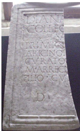
Fig. 1: CIL XIV 2156 (palacio Chigi, Ariccia).