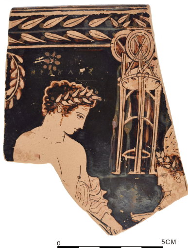
Εικόνα 1: Θραύσμα ερυθρόμορφου σκύφου Π 12489.

σύνθεση έχει σωθεί ένα τμήμα του άνω μισού της με δύο μορφές, αποδομένες με ιδιαίτερη δεξιοτεχνία. Στο κέντρο δεσπόζει νεαρός άνδρας, αγένειος, ο οποίος γέρνει ελαφρά προς τα εμπρός σε γυναικεία μορφή που βρίσκεται σε χαμηλότερο επίπεδο και κρατά φιάλη. Επάνω από το κεφάλι του, με λευικό χρώμα, γραπτή (dipinto) επιγραφή ΗΡΑΚΛΗΣ (εικόνα 2, σχέδιο 2), σε ιωνικό αλφάβητο 7 , δηλώνει την ταυτότητά του. Ο ήρωας αποδίδεται με το κεφάλι σε κατατομή και τον κορμό σε όψη τριών τετάρτων προς τα δεξιά. Η κόμη του είναι κοντή, βοστρυχωτή 8 και φέρει πλατύφυλλο στεφάνι με κυκλικούς καρπούς 9 . Ο οφθαλμός του ξεχωρίζει καθώς μεγάλες καμπύλες γραμμές αποδίδουν την κόγχη και το άνω βλέφαρο κάτω από την επίσης μεγάλη, καμπύλη γραμμή του φρυδιού (εικόνα 2). Η ίριδα του ματιού δηλώνεται με κουκίδα και η