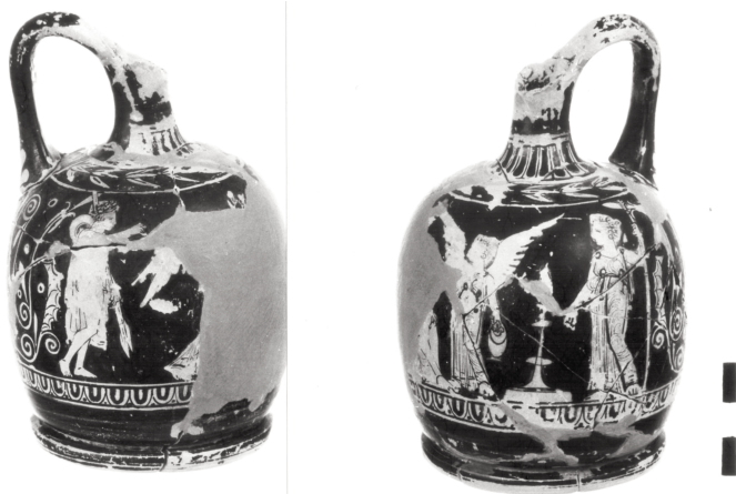
Εικόνα 3: Ερυθρόμορφη αρυβαλλοειδής λήκυθος Π 1814.

Νίκη με φιάλη και τριφυλλόστομη οιοχόη καθώς μια δεύτερη Νίκη πίσω του τον στεφανώνει. Σημειώνεται ότι η παρουσία της Νίκης στις σκηνές αυτές, μπορεί να συμβολίζει γενικότερα την προσωποποίηση της επιτυχίας στην έκβαση κάθε αγώνα 38 . Στην λήκυθο στη Νέα Υόρκη διατηρείται και το κάθισμα του ήρωα, ένα βαθμιδωτό κρηπίδωμα, παρόμοιο με τη βάση του μονόπτερου ναΐσιου που σε ερυθρόμορφες παραστάσεις ή ανάγλυφα αναγνωρίζεται ως χώρος τέλεσης λατρείας του 39 . Κάποτε οι παραστάσεις του είδους αυτού συνοδεύονται, με σκηνή αποθέωσης του ήρωα στο ίδιο αγγείο 40 , ωστόσο, τρίποδας δεν εικονίζεται σε καμιά από αυτές τις σκηνές.