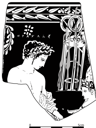
Σχέδιο 2: Ανάπτυγμα παράστασης Π 12489.

τη μορφή του υπό μελέτη σκύφου. Το στεφάνι στο κεφάλι του Ηρακλή οδηγεί σε αγγειογραφίες του Ζ. του Κλεοφώντα 15 ενώ ο τρίποδας θυμίζει τον τρίποδα-έπαθλο σε καλυκόσχημο κρατήρα στην Οξφόρδη του Ζ. του Marlay 16 . Παρόλ' αυτά, τα φυσιολογικά χαρακτηριστικά και οι ανατομικές λεπτομέρειες του Ηρακλή της Κυδωνίας ανακαλούν μορφές του Ζ. του Δίνου της περιόδου μεταξύ 430 και 410 π.Χ., όπως για παράδειγμα, μια ανδρική μορφή σε θραύσμα κρατήρα από την αρχαία Αγορά 17 . Περισσότερες όμως ομοιότητες, εντοπίζονται στον σχεδιασμό των γραμμών του προσώπου, του ματιού και των ανατομικών λεπτομερειών, με τις μορφές μιας πολύ ενδιαφέρουσας παράστασης 18 σε κωδωνόσχημο κρατήρα στη Γέλα του Ζ. του Δίνου 19 και ειδικά με τον νεαρό που ταυτίζεται με Θησέα 20 ή Ιάσονα 21 στον κρατήρα αυτό. Επιπλέον,