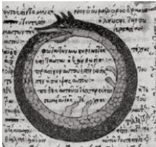
(Figura 4: https://www.flickr.com/photos/ouroboran/2288405597/in/photostream/lightbox/ 28 )

En el folio 279r del mismo manuscrito, se encuentra la segunda figura. La acompaña un texto en el que el principio alquímico es diferente, pero con la misma receta mística. La serpiente que se muerde la cola está compuesta, en este caso, por dos círculos o anillos concéntricos: de colores rojo y verde. Aquí las escamas están mejor marcadas. Como la figura que se comentó anteriormente, está provista también de cuatro pies y tres orejas.