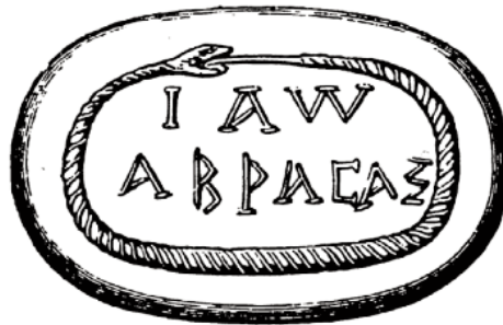
(Figura 1. Ejemplo de gema gnóstica. Sheppard, 1962: 85)

aquella, puesto que recuerdan las sencillas inscripciones en gemas gnósticas en las que el nombre de «Abraxas 7 » está rodeado por la serpiente que se muerde la cola 8 y que solían ser utilizadas como talismán.