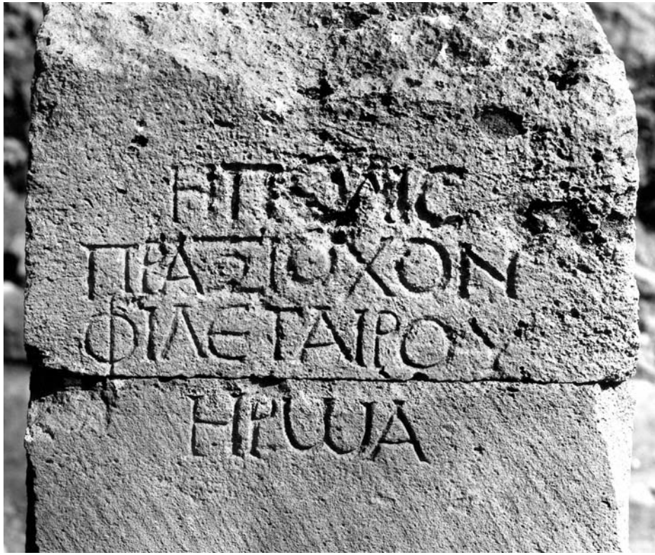
Figura 2B: Inscripción 1. Detalle.