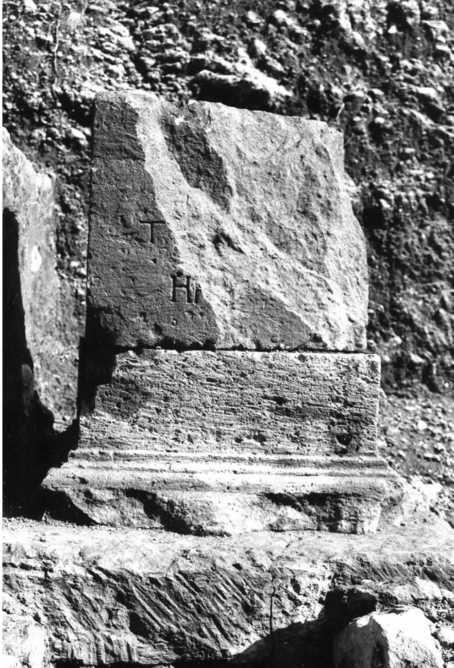
Figura 3: Inscripción 2.