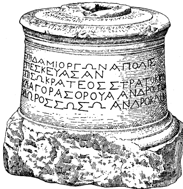
Figura 7: Inscripción 2. Copia del monumento de L. Savignoni.