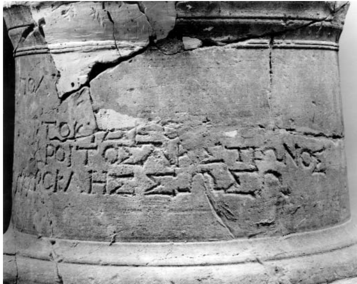
Figura 6: Inscripción 2.B (3).