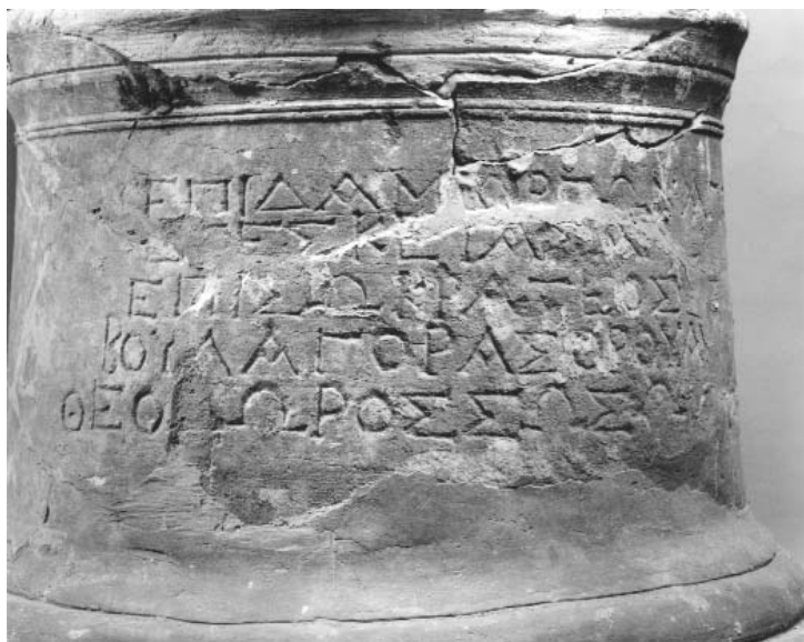
Figura 4: Inscripción 2.B (1).