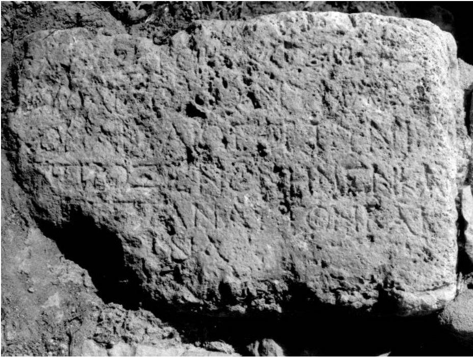
Figura 1: Inscripción 1.