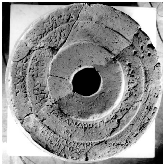
Figura 2: Inscripción 2.A.