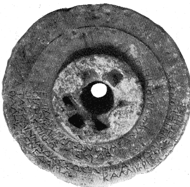
Figura 3: Inscripción 2.A (Guarducci).