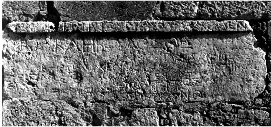
Figura 1. Inscripción de Polirrenia, ICret.II.XXIII , 30.