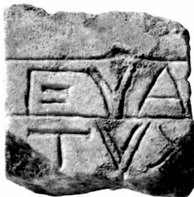
FIGURA 3. Inscripción n.º 3.