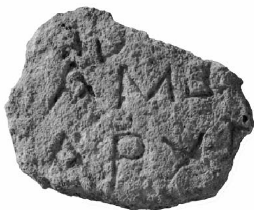
FIGURA 2. Inscripción n.º 2.