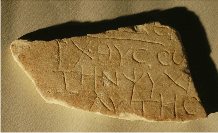
Figura 3. Inscripción N° 2.