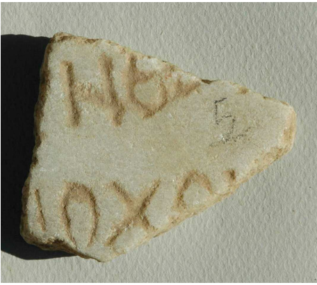
Figura 6. Inscripción Nº 5.