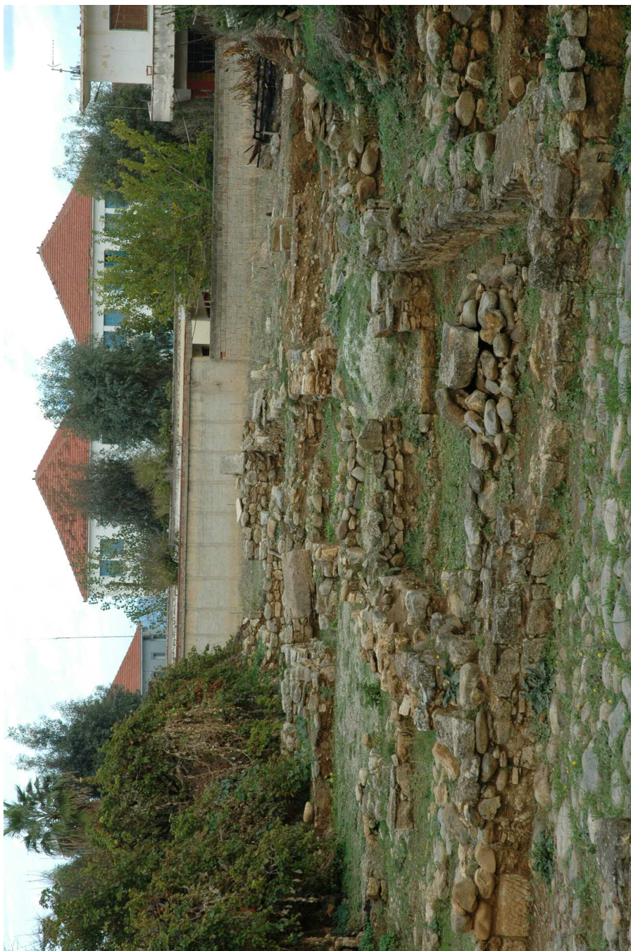
Figura 1. Parte de la necrópolis paleocristiana de Císamo.