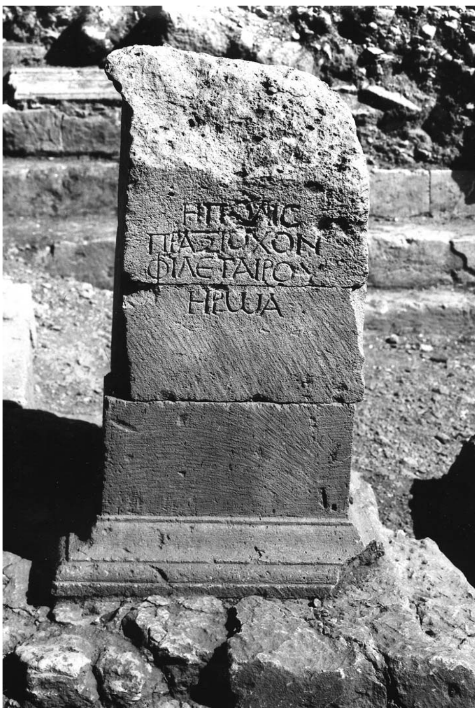
Figura 2A: Inscripción 1.