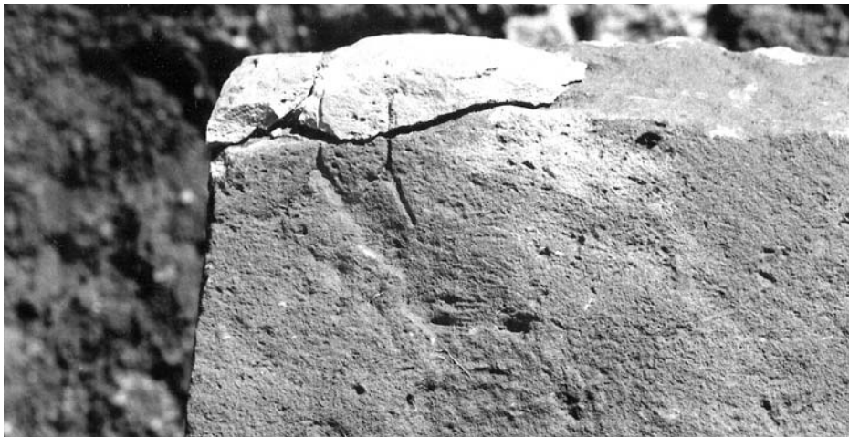
Figura 5B: Inscripción 4. Detalle.