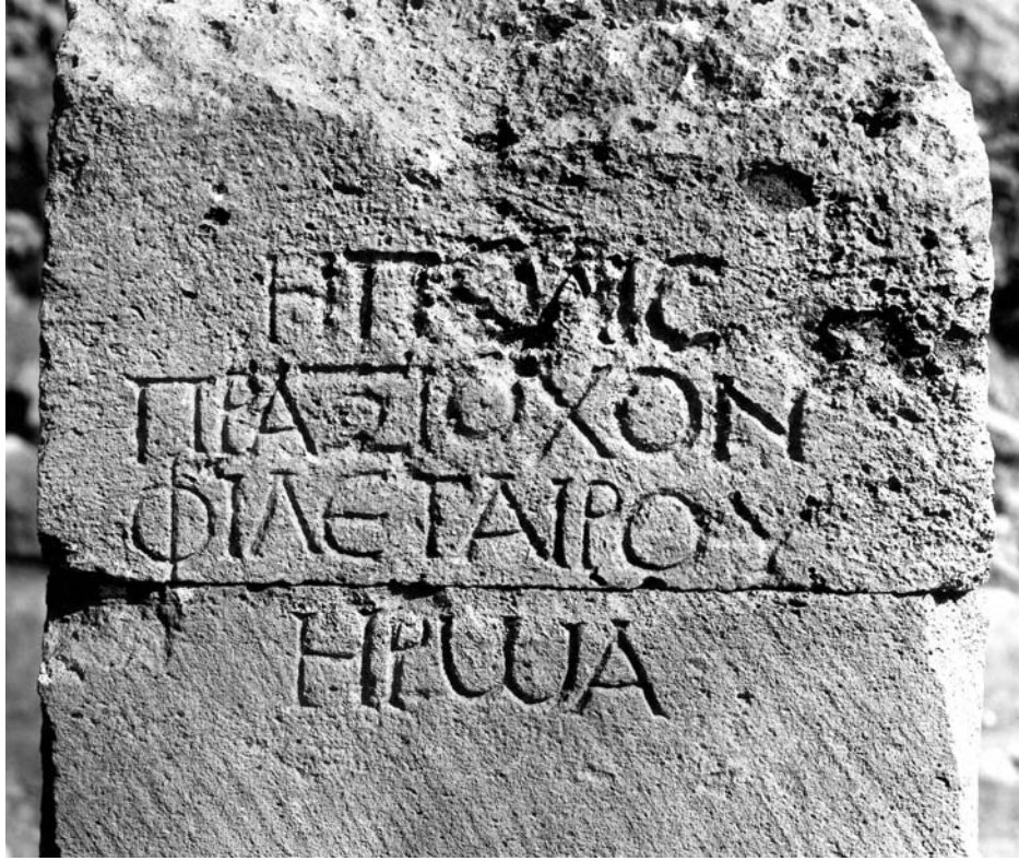
Figura 2B: Inscripción 1. Detalle.