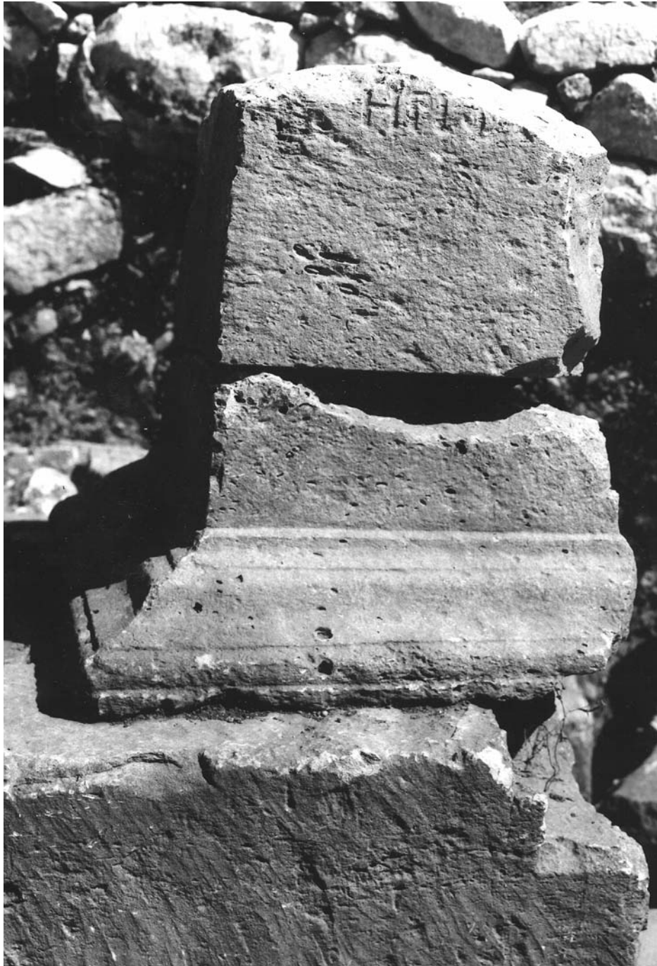
Figura 4: Inscripción 3.