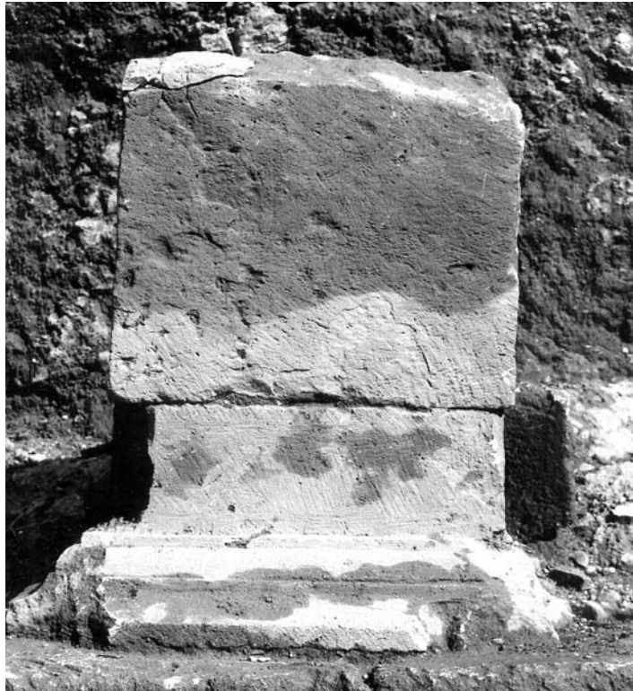
Figura 5A: Inscripción 4.