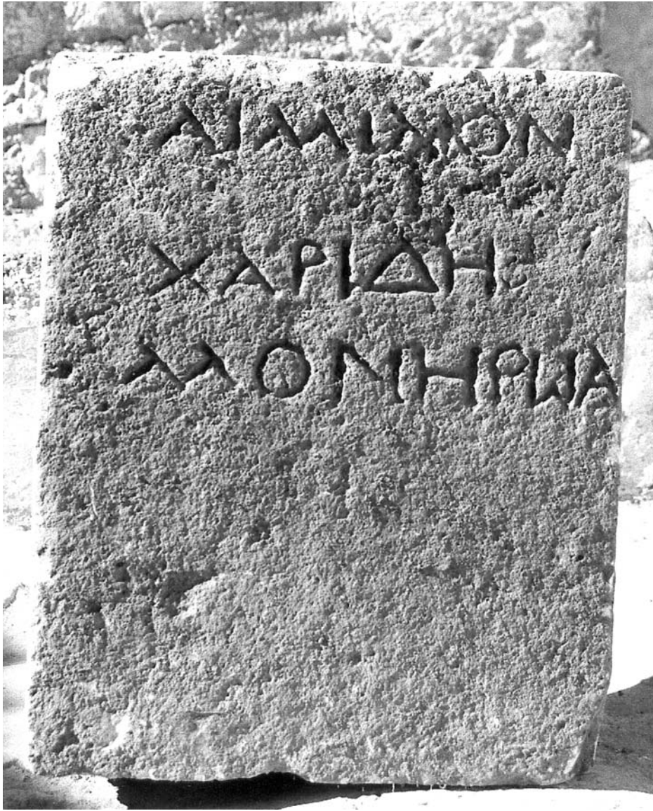
Figura 6: Inscripción 5.