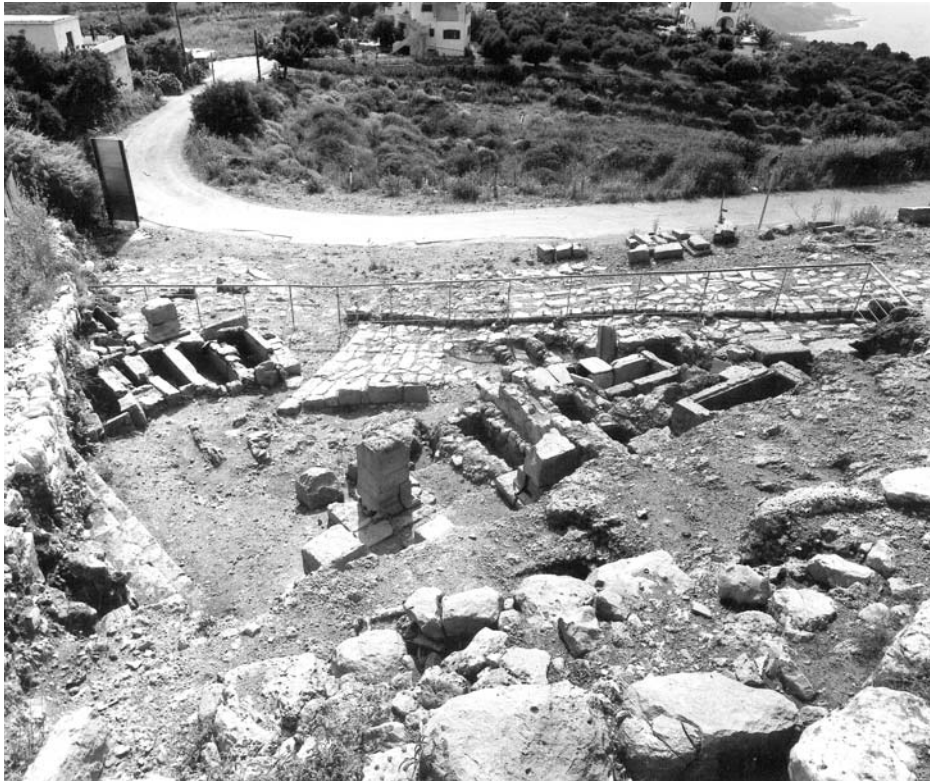
Figura 1: Vista general del yacimiento arqueológico.