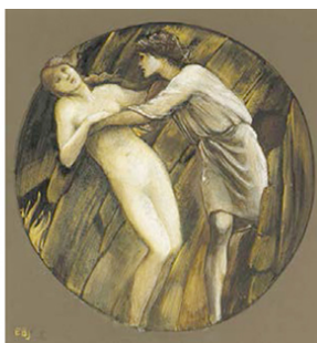
Edward Burne-Jones, Orfeo y Euridice (1870).

Teniendo en cuenta todo esto, ¿de qué manera Chris Columbus y su equipo artístico emplearon todos estos referentes para la construcción de una de las escenas más importantes de la saga? Como veremos más adelante, son innegables las referencias literarias y plásticas para la realización de la misma; pero centrémonos un momento en la puesta en escena, pues, obviamente, Columbus juega con una fotografía oscura, en tonos muy fríos, situándonos en un lugar lúgubre, casi inhabitable, retratado con una gran profundidad de campo. La luz, al igual que sucede en los lienzos en los que aparece Euridice, recae sobre Ginny Weasley, quien destaca en la composición por su pelo rojo y su pálida tez, único punto lumínico de la misma.