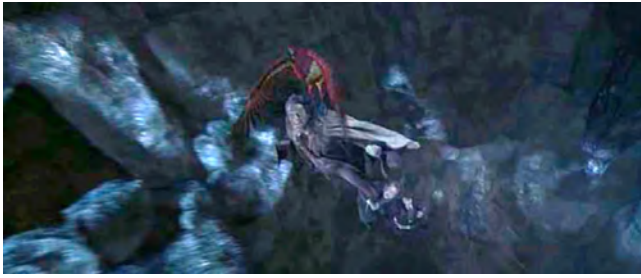
Fotograma de Harry Potter y la Cámara de los Secretos (2002).