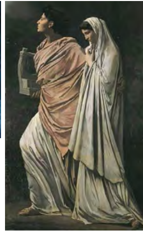
Anselm Feuerbach, Orfeo y Euridice (1869).

que el equipo artístico de las películas se cuida especialmente de mostrar cuáles fueron aquellas obras en concreto que les sirvieron como inspiración para la creación de las mismas; por tanto, la selección que hemos hecho deriva de nuestra propia investigación, cotejando artes plásticas y cine.