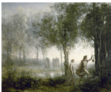
Camille Corot, Orfeo y Euridice (1861).