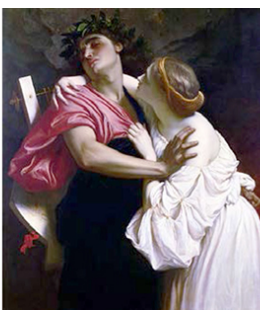
Frederic Leighton, Orfeo y Euridice (1864).