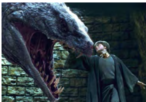
Fotograma de Harry Potter y la Cámara de los Secretos (2002).