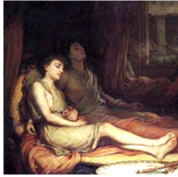
John William Waterhouse, El sueño y su hermanastro la muerte (1874).

poderosa e indestructible. Ésta sólo podía ser contenida al paso del rey egipcio, ya que si se destruía por completo desaparecía el ciclo solar. Algunos arqueólogos coinciden en señalar que se trataba de un reptil que no podía escuchar ni tampoco ver, sólo gritar (Castel, 2001: 28). En ambos casos, tanto en el de Harry como en el del faraón, se trata de un enfrentamiento arduo y exhausto.