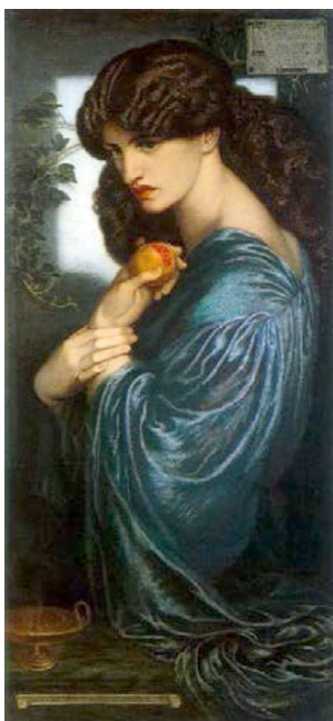
Dante Gabriel Rossetti, Proserpina .

encontramos con una mujer fuerte cuya carga psicológica y simbólica sentará las bases, junto con Pandora o Medea, de lo que conocemos como «mujer fatal». Ejemplo de ello podríamos verlo en la obra de Dante Gabriel Rossetti Perséfone (1874).