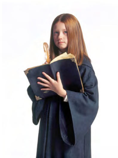
Ginny Weasley con el diario de Tom Riddle.

La finalidad de la posesión de Ginny por parte del Señor Tenebroso no era otra que matarla para así poder obtener más fuerza vital y poder materializarse.