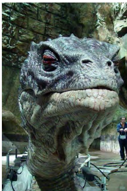
Detalle de la cabeza del basilisco en los estudios de Leavesden (Londres).

cuya vida dura varios siglos, nace de un huevo de gallina empollado por un sapo. Sus métodos de matar son de lo más extraordinario, pues además de sus colmillos mortalmente venenosos, el basilisco mata con la mirada, y todos cuanto fijaren su vista en el brillo de sus ojos han de sufrir instantánea muerte. Las arañas huyen del basilisco, pues es éste su mortal enemigo, y el basilisco huye sólo del canto del gallo, que para él es mortal (Rowling, 1998: 245).