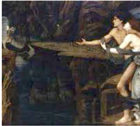
John Roddam Spencer Stanhope, Orfeo y Euridice en los bancos de la Laguna Estigia (1878).

Campos Elíseos y cuya entrada estaba cerca del mar o de un río. Llama la atención que la escritora británica situase la entrada a la Cámara en el baño de los prefectos de la cuarta planta, a través de una cañería. A diferencia de los griegos, que tenían que cruzar la Laguna Estigia para llegar al Inframundo, Harry tiene un camino que le lleva hasta la misma entrada. No obstante, el agua también está presente en la Cámara, ya que parece que tenemos una especie de laguna en donde se sitúa la plataforma que lleva hasta la colosal estatua de Salazar Slytherin.