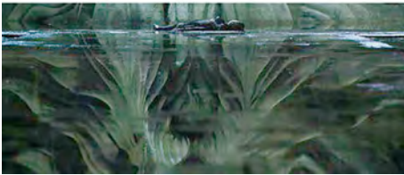
Fotogramas de Harry Potter y la Cámara de los Secretos (2002).