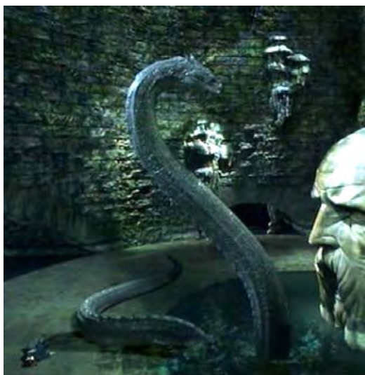
Fotograma de Harry Potter y la Cámara de los Secretos (2002).