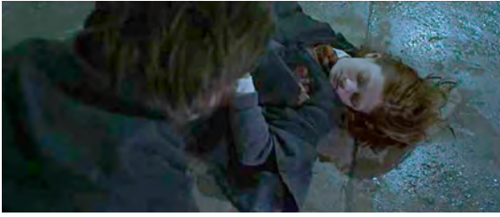
Fotograma de Harry Potter y la Cámara de los Secretos (2002).