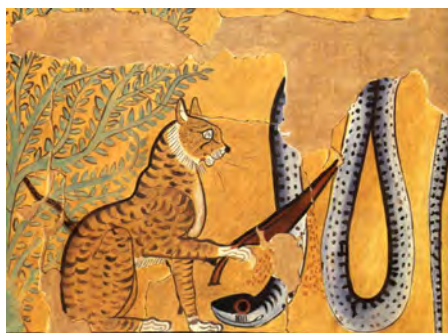
Pintura egipcia sobre la muerte de Apofis.

Para concluir debemos indicar que Ginny no sufre un ataque propiamente, pero sí es el instrumento de Tom Riddle para atemorizar a estudiantes y profesores de Hogwarts tras los ataques perpetrados por la bestia.