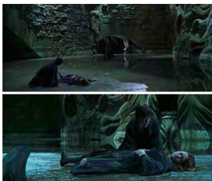
Fotogramas de Harry Potter y la Cámara de los Secretos (2002).