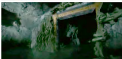
Fotogramas del documental El Inframundo egipcio (2008).

documental emitido por la National Geographic y dirigido por Rob Lyall, Zahi Hawass y la Dra. Salima Ikram reflexionan sobre el tema con las siguientes palabras: