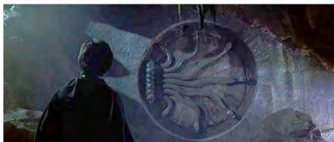
Fotogramas de Harry Potter y la Cámara de los Secretos (2002).