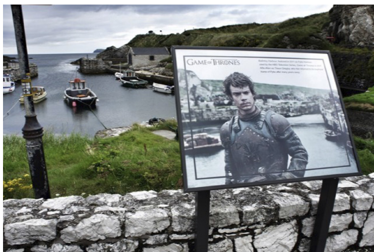
Figura 3. Cartel del movie map 6 de Juego de Tronos en Croacia.

la estación de Charing Cross. En este caso ya no sólo hablamos del impacto que un filme produce en el lugar de destino, sino que este parque hace que Leavesden y Londres sean lugares de paso obligatorio para todos los fans de la saga.