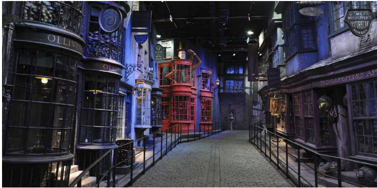
Figura 2. Callejón Diagon. Parque temático de Harry Potter en Inglaterra.