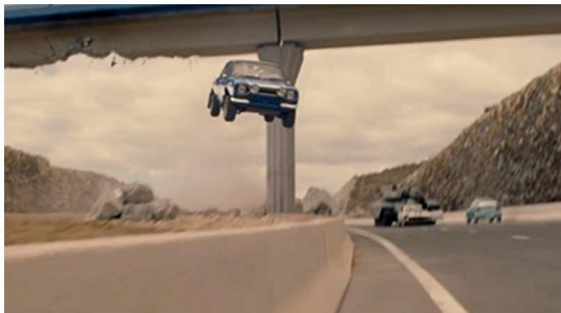
Figura 11. Fotograma de Fast & Furious 6 . Anillo Insular, Sur de Tenerife.

Y, por último, la más reciente, Exodus de Ridley Scott, quien, sobrevolando la isla en helicóptero meses antes del rodaje, escogió los mejores arenales para recrear la increíble apertura de las aguas del Mar Rojo y la travesía en el desierto del pueblo judío. Finalmente el director estadounidense se desplazó hasta Fuerteventura, concretamente a la playa de Cofete y punta Jandía para recrear la persecución del pueblo judío por parte del ejército egipcio. El uso que Scott hace del paisaje es el mismo que Leterrier hacía para Furia de Titanes , se vale de la geografía mayorera para recrear un acontecimiento «mítico» sin ninguna relación con el archipiélago.