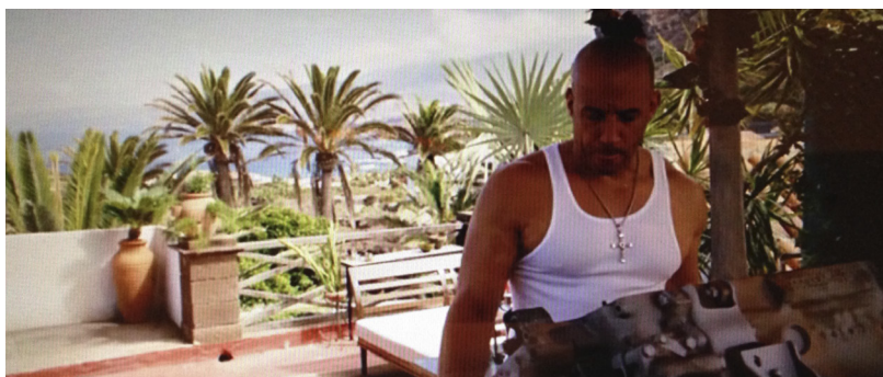
Figura 10. Fotograma de Fast & Furious 6 . Garachico, Tenerife.