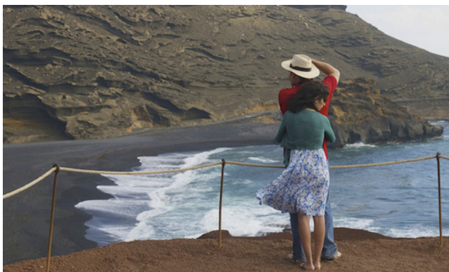
Figura 6. Fotograma de Los abrazos rotos . Mirador del Río, Lanzarote.