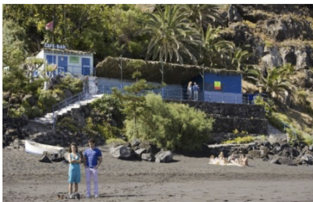
Figura 8. Fotograma de Una hora más en Canarias . Playa del Bollullo, Tenerife.

En la cinta emplea la isla de Lanzarote como una salida emocional a los malos tratos y vejaciones que estaba sufriendo la protagonista, Lena. Un oasis de paz en donde poder disfrutar de su amor con Mateo Blanco, Lluís Homar. Almodóvar nos introduce con una amplia panorámica en el paisaje volcánico que la caracteriza. Durante la estancia de los protagonistas, que dura aproximadamente un año, podremos verlos pasear por la playa del Golfo. Ese aislamiento físico y emocional funciona como un refugio para los ellos, que huyen de todo lo que temen en Madrid, lo que el realizador subraya gracias a la singularidad y la espectacularidad de los parajes naturales que ofrece la isla.