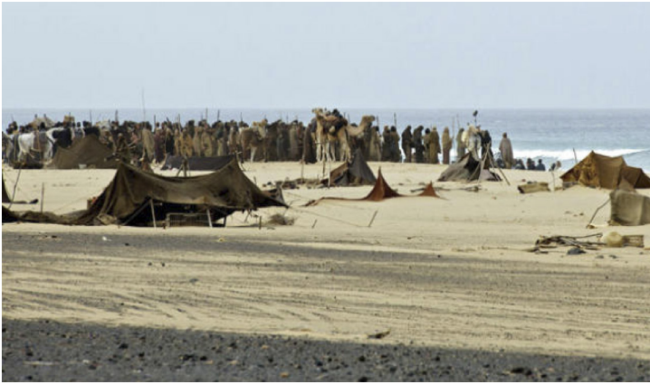
Figura 12. Fotograma de Exodus . Playa de Cofete, Fuerteventura.

Así pues, si separamos los largometrajes nacionales de los internacionales vemos dos tendencias. La nacional prefiere los paisajes canarios para alimentar y potenciar lo que por muchos es conocido: el buen clima y los diferentes paisajes que las islas ofrecen. Por otro lado, las producciones foráneas hacen un uso bien distinto y variado del paisaje del archipiélago, recreando espacios ambientados en la Antigüedad, como es el caso del último rodaje realizado en Tenerife, en donde han transformado la capital de la isla en Atenas, lugar en donde transcurre parte de la acción de la película.