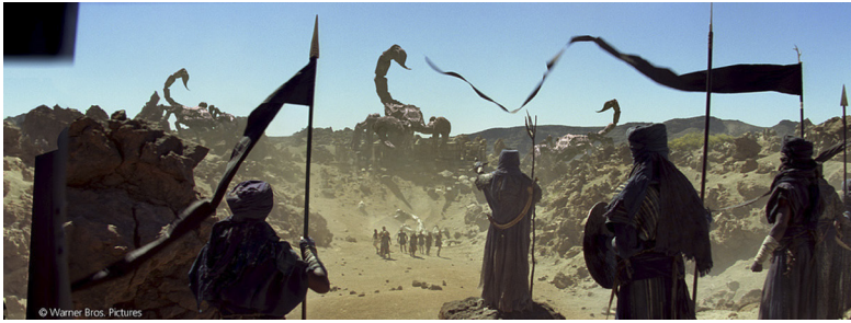
Figura 9. Fotograma de Furia de Titanes . Parque Nacional del Teide, Tenerife.

forman un elemento muy importante y sustancial de la película; son unas islas muy pequeñas donde puedes encontrar todo un continente de paisajes 22 .