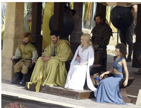
Figuras 4 y 5. Rodaje de la 5ª temporada de Juego de Tronos en la Plaza de Toros de Osuna, Sevilla.

Tras estar aproximadamente un mes buscando localizaciones, la Andalucía Film Commission llegó a cifrar en cien millones de euros el impacto económico que podría tener el rodaje, hablando de la creación de hasta 4.000 puestos de trabajo directos e indirectos, datos que se han ido desinflando considerablemente en estos meses, pues los extras contratados por la productora apenas superaron el medio centenar. Con todo, nadie duda del extraordinario impacto que la transformación de Sevilla en uno de los siete reinos de Poniente puede suponer en términos de promoción de la ciudad 8 . Sobre este caso también se pronunció James Costos, embajador estadounidense en España, destacando que en sólo