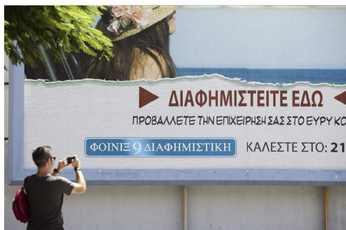
Figuras 13 y 14. Carteles en griego que ambientarán las calles de Santa Cruz para el próximo rodaje de la quinta entrega de la saga de Bourne.

Teniendo todo esto en cuenta, debemos ser conscientes de que el efecto en la promoción se detecta más a medio y largo plazo que a corto; y todos los rodajes mencionados anteriormente han contribuido a colocar a las islas en el mapa cinematográfico internacional, ya no sólo por tener bellos y variados paisajes, buen clima y ser un destino de descanso —ya lo decía Toretto, uno de los protagonistas de Fast & Furious: Esto me gusta. Es tranquilo, buen tiempo (...) —; sino por tener unas atractivas y jugosas deducciones fiscales. Lo que tenemos que hacer, tanto la industria como el Ejecutivo Canario, es un análisis real y ver si verdaderamente lo único que atrae a las productoras son los incentivos fiscales, porque en este caso, cuando éstos dejen de ser atractivos Canarias desaparecerá del mapa cinematográfico a la misma velocidad que se ha colocado en el lugar destacado en el que está.