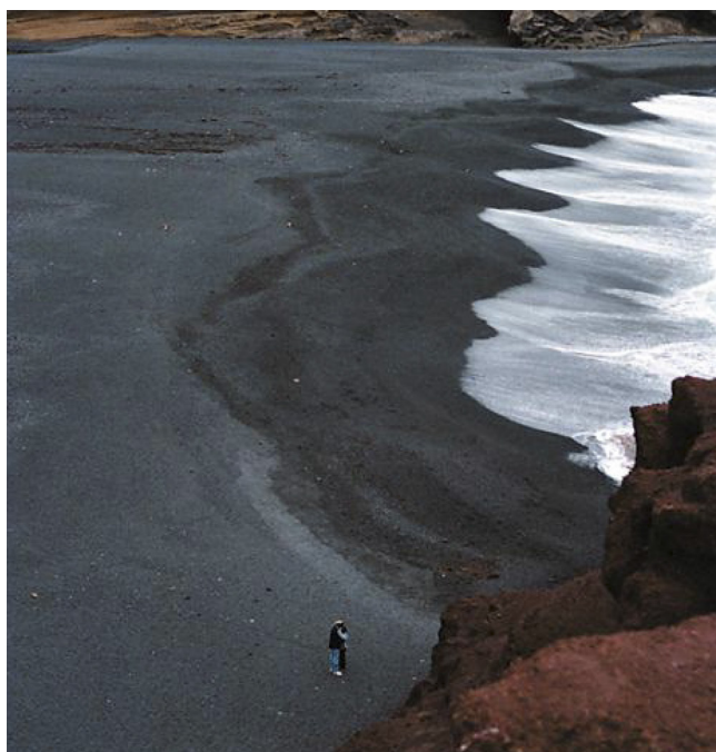
Figura 7. Fotografía sacada por Almodóvar en su primer viaje a Lanzarote y que le inspiró el guión de Los abrazos rotos .

2008. URL: http://www.laprovincia.es/cultura/2008/05/08/misterioso-abrazo-playa-golfo-inspiro-pelicula-canaria-pedro-almodovar/149262.html (Consulta: 02/02/2015).