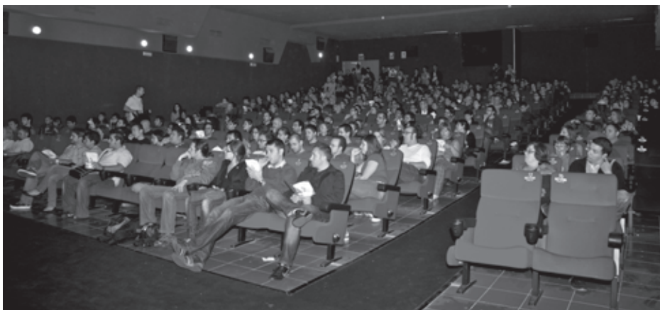
Público asistente al estreno de cortometrajes en los cines Renoir-Price de Santa Cruz de Tenerife.

largos digitales canarios como un pase más de su oferta de películas, y este debe ser el camino que durante la próxima década adopten otros espacios, tanto públicos como privados, para apoyar a la consolidación de un sector que se debe hacer más fuerte y profesional.