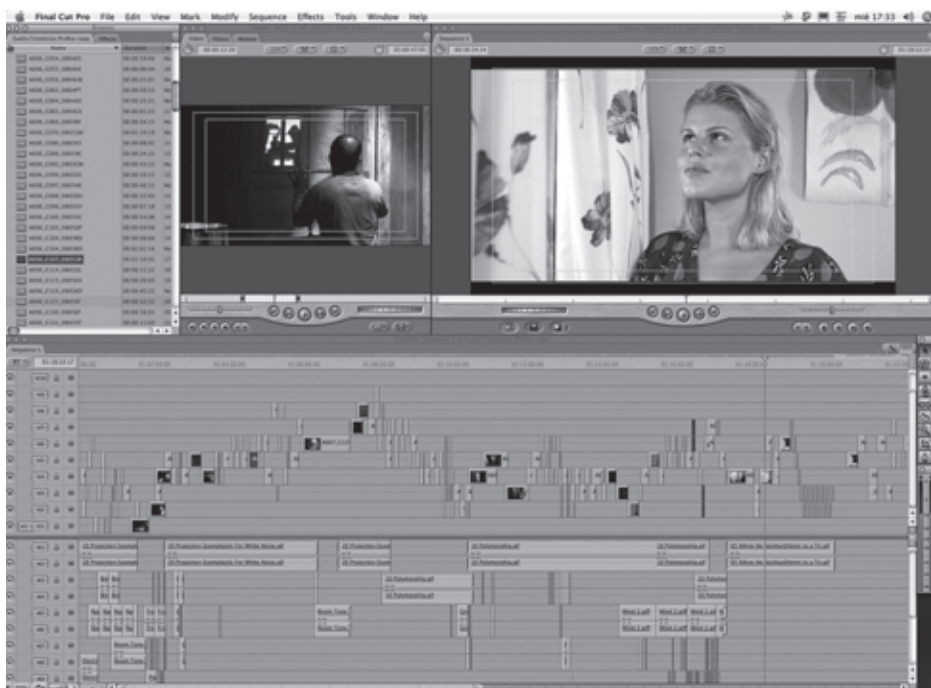
Vista del timeline de montaje del cortometraje Sueño fronterizo en Final cut (David Delgado).

menor importancia en relación a la imagen, este suele ser un campo en el que fallan numerosas obras, con una banda sonora deficiente, sobre todo en los rodajes con menos medios, en los que a veces es muy difícil siquiera escuchar los diálogos. Esta dificultad técnica también tiene una consecuencia estética, fácilmente identificable en numerosos cortos que, en lugar de pistas de sonido ambiente, usan (y abusan) de la música y de la voz en off grabadas en estudio o, directamente, en historias con pocos diálogos.