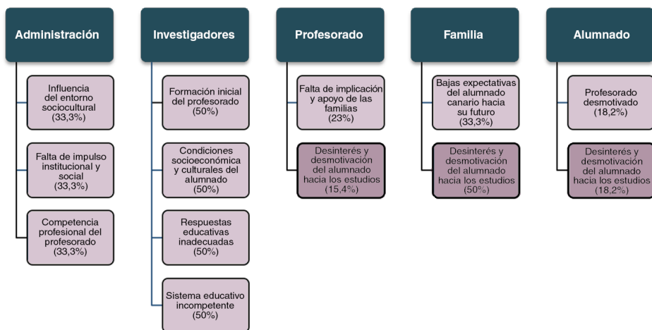
Figura 1. Causas señaladas por cada subgrupo de expertos.

«El desfase educativo de Canarias se debe, entre otros factores, al bajo nivel educativo de la población (entre ellos y ellas, los padres y las madres del alumnado) (...)» (Id. 7).