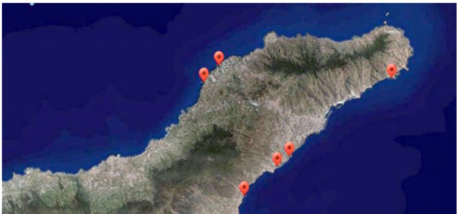
Fig. 2. Visión de satélite del noroeste de Tenerife con las zonas muestreadas. (A: El Pris. B: El Roquillo. C: Igueste. D: Añaza. E: Bocacangrejo. F: Las Caletillas). Imágenes obtenidas mediante el visor Grafcan.