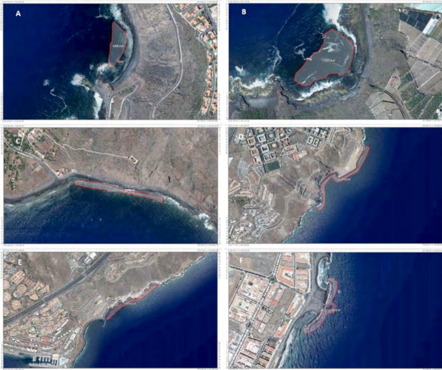
Fig. 3. Visión de satélite de las zonas muestreadas. (A: El Pris. B: El Roquillo. C: Iguete. D: Añaza. E: Bocacangrejo. F: Las Caletillas).