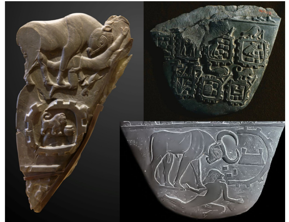
Figura 1. Paleta de los Toros, paleta de las Ciudades, paleta de Nármer (registro inferior del anverso) (composición basada en imágenes de commons.wikimedia.org).

Ahora bien, como se apuntaba más arriba, esta notoria presencia egipcia en el sur del Levante corresponde a un período relativamente breve, que remite a la fase del Bronce Antiguo IB2. Es el momento en el que, en el valle del Nilo, se completa el proceso de unificación política, en los umbrales de la Dinastía I. De hecho, la mayor parte de los serekhs identificables que se han hallado en el Levante corresponden al rey Nármer. Daría la impresión de que la propia dinámica estatalmente expansiva que desemboca en la unificación continúa por un tiempo e impacta más allá del valle del Nilo, aunque luego se retrae 13 . Los testimonios iconográficos de la época –los así llamados “documentos de la unificación”– tienden a caracterizar el proceso expansivo en términos de una violencia a través de la cual el rey triunfa sobre sus enemigos. Estos últimos, al menos a partir de Nármer y en consonancia con la concreción del proceso de unificación en el Nilo, comienzan a ser definidos como las poblaciones que vivían más allá de Egipto: libios, nubios y asiáticos. Una de las formas a las que iconográficamente se acude en esos documentos para representar los objetivos de los ataques egipcios es la que describe una serie de