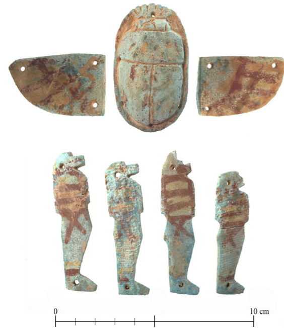
Figura 4. Escarabeo alado con vestigios de pintura amarilla y roja (arriba; No. Inv. 15757) y conjunto de hijos de Horus (abajo; No. Inv. 15758 A-D). 2018.