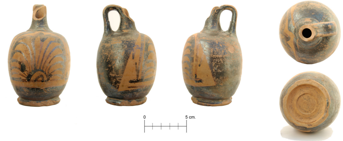
Figura 7. Vaso de figuras rojas (No. Inv. 15856). Fotografía: Inés G. 2018.

La criba que se efectuó en el desescombro de esta tumba aportó también un elemento de interés, pero de época muy posterior. Se trata de una punta triangular de hierro, sin evidencias de óxido, perteneciente a un antiguo proyectil foráneo 20 (No. Inv. 15841). Una segunda pieza de este tipo,