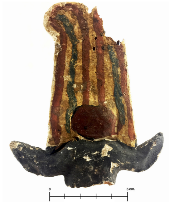
Figura 6. Corona de madera con restos de policromía perteneciente a una estatuilla de Ptah-Sokar-Osiris (No. Inv. 15780). Fotografía: Inés G. 2016.

En conclusión, esta tumba 22 presenta una estructura superior que puede ser datada, en origen, durante la segunda fase de la necrópolis tardía de El Assasif, que corresponde esencialmente a la dinastía XXVI. Aun cuando hay que investigar en profundidad los elementos arquitectónicos y los abundantes hallazgos, se pueden establecer algunas pautas históricas: hay evidencias de un primer