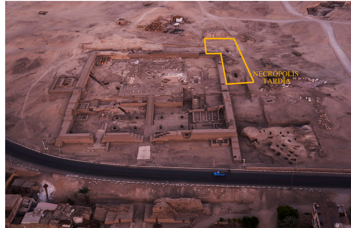
Figura 1. Vista panorámica de la zona.

que hay sobre necrópolis tardías en la zona de El Assasif 2 .