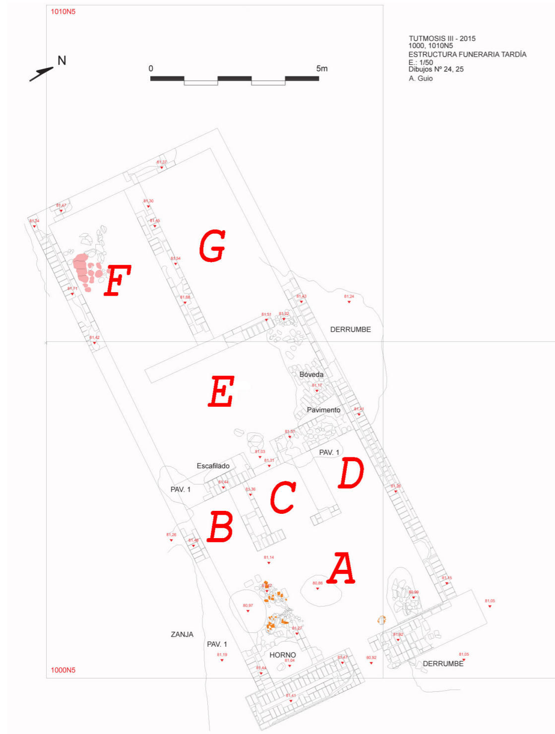
Figura 2. Plano de la estructura superior de la tumba 22. Dibujo: Reyes Somé y Javier Tre.