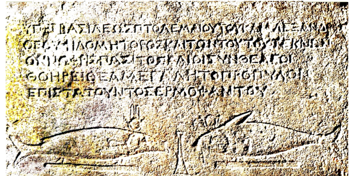
Figura 2. Inscripción de Tréveris. G. Catálogo Galería Nefer, nº 8, 1990: nº 42.

Con la llegada de los griegos, se produce un nuevo cambio y ahora esta localidad será conocida bajo el nombre de Oxirrínco, muy posiblemente