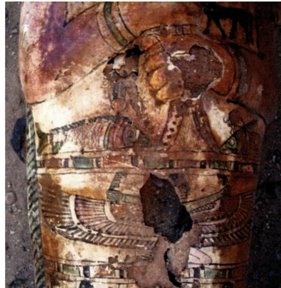
Figura 12. Detalle con la imagen del oxirrinco y lepidoto afrontados. Tumba nº 11. Misión Arqueológica de Oxirrinco.

peces oxirrinco Mormyradae ( Mormyrus Cashiove y Mormyrus Kamume ) 41 . Este depósito estaba formado por diversas capas de peces separadas entre ellas por otras capas de hojas de palma y láminas de madera; en la siguiente campaña de 2013, no solo se localizó un número mayor de peces,