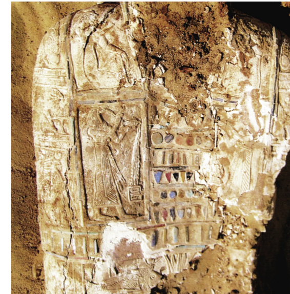
Figura 14. Cartónaje con la imagen del pez oxirrinco hallado en la Tumba nº 11. Misión Arqueológica de Oxirrinco.

llegando hasta los casi 50.000 peces entre las dos campañas, sino que, además, éstos estaban pseudomomificados y habían sido envueltos con fibras de esparto y, en ocasiones, con tela. Dependiendo del tamaño de los peces, el envoltorio era individualizado o por grupos.