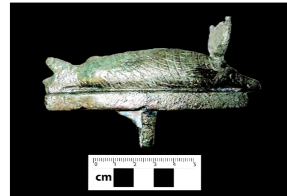
Figura 9. Anverso de escultura de bronce de pez oxirrinco hallada en Tumba nº 23. Misión Arqueológica de Oxirrinco.

la Tumba nº 11 38 . El primero de ellos muestra una decoración pintada en la cual, bajo los brazos del individuo, se puede ver una figura del