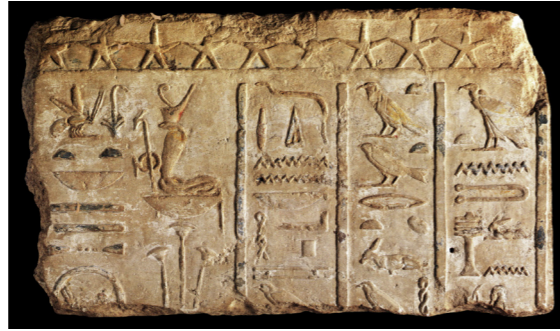
Figura 3. Besançon, Musée des Beaux-arts et d'Archéologie. Inv. A.995-7-2. Barbotin et alii 2010: 67.

Un ejemplo de esto último, lo tenemos en un bloque de piedra localizado en esta área, que se encuentra en el Museo de Besançon 14 , y en el que hay inscrito un cartucho de Ptolomeo I o II, acompañado de un texto que dice lo siguiente: “Palabras dichas: te ofrezco la gran crecida... Tueris, que impregna de humedad / que llora (?)... Madre de Dedun, señor..., te doy la inundación...” (fig. 3).