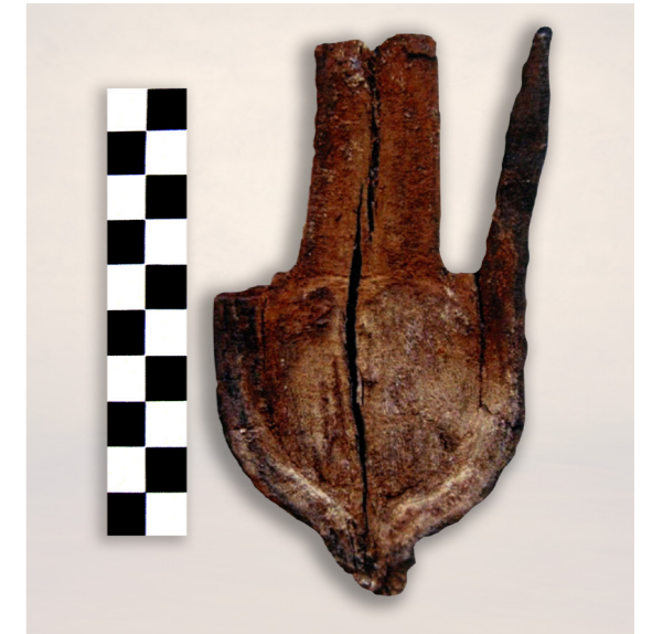
Figura 15. Corona hathórica de madera hallada en la ofrenda votiva de peces. Misión Arqueológica de Oxirrinco.

Finalmente, es interesante señalar que, durante la campaña del año 2005 y trabajando en la Cámara de Ofrendas nº 4 de la Tumba Saíta nº 14, se hallaron junto al muro oeste una serie de objetos in situ , entre los que se encontraba una olla de barro que contenía 55 piezas de bronce. La mayoría de ellas eran figuras del dios Osiris, pero también había 2 fragmentos de coronas. Una de ellas corresponde a una corona hathórica consistente en dos cuernos de vaca en forma de lira que enmarcan un disco solar. En la parte inferior tiene una larga lengüeta para fijar la pieza. Este tipo de corona la solían llevar diosas femeninas como Hathor o, en épocas tardías, Isis, pero como ya hemos apuntado, en la ciudad de Oxirrinco la divinidad que la ostenta es la diosa Tueris, representada como pez