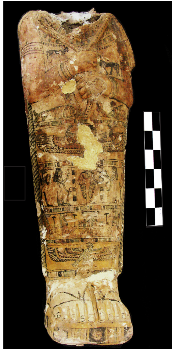
Figura 11. Cartónaje con la imagen del oxirrinco y del lepidoto afrontados hallado en la Tumba nº 11. Misión Arqueológica de Oxirrinco.

peces oxirrinco Mormyradae ( Mormyrus Cashiove y Mormyrus Kamume ) 41 . Este depósito estaba formado por diversas capas de peces separadas entre ellas por otras capas de hojas de palma y láminas de madera; en la siguiente campaña de 2013, no solo se localizó un número mayor de peces,