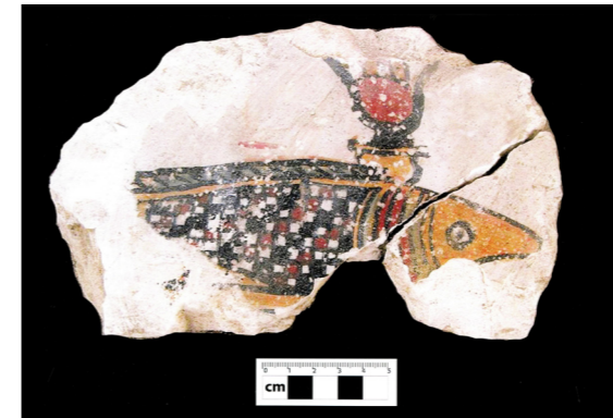
Figura 8. Representación pictórica del pez oxirrinco en Tumba nº 18. Misión Arqueológica de Oxirrinco.

la Tumba nº 11 38 . El primero de ellos muestra una decoración pintada en la cual, bajo los brazos del individuo, se puede ver una figura del