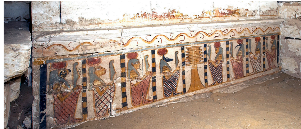
Figura 6. Representación pictórica de los peces oxirrinco y lepidoto afrontados en la tumba nº 3. Misión Arqueológica de Oxirrinco.