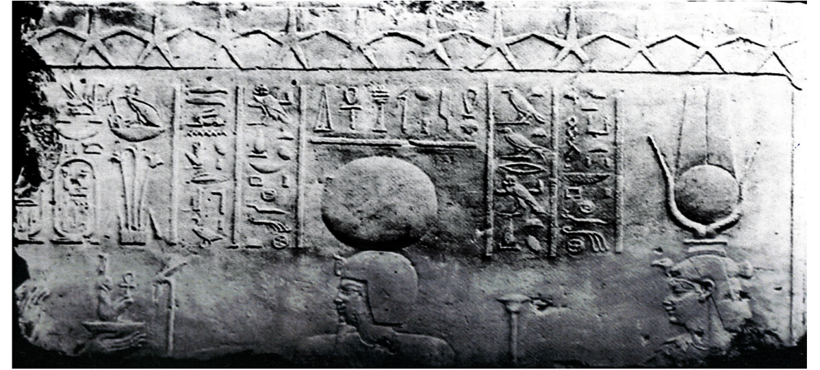
Figura 4. Leiden, Rijksmuseum van Oudheden. Inv. F.1961/12.3. Schneider 1982: 28, fig. 20 b.

Las primeras noticias que tenemos del templo del Per-khef datan de 1957 cuando Sauneron 18 da a conocer 13 bloques de piedra decorados y con inscripciones que provenían de El-Bahnasa y que había visto dos años antes en el mercado de antigüedades de El Cairo. Con posterioridad, estas piezas acabarán formando parte de distintas colecciones privadas y museos europeos como los que se conservan en el Rijksmuseum van Oudheden (Leiden) 19 , que hacen referencia respectivamente a: “Tueris, la Medyat, grande en sortilegios,