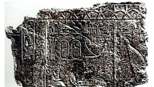
Figura 5. Leiden, Rijksmuseum van Oudheden. Inv. F.1961/12.2. Schneider 1982: 28, fig. 20 a.

Por otro lado, y según relata el denominado papiro de los Pescadores 22 , en la ciudad de Oxirrincó había unos sacerdotes que recibían el nombre de Pescadores Sagrados , los cuales trabajaban en el Templo Atenea-Tueris, puesto que esta diosa fue identificada en época griega con Atenea 23 . En este papiro se da una lista no solo de