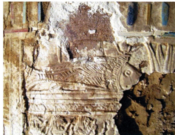
Figura 13. Detalle con la imagen del pez oxirrinco. Tumba nº 11. Misión Arqueológica de Oxirrinco.

llegando hasta los casi 50.000 peces entre las dos campañas, sino que, además, éstos estaban pseudomomificados y habían sido envueltos con fibras de esparto y, en ocasiones, con tela. Dependiendo del tamaño de los peces, el envoltorio era individualizado o por grupos.