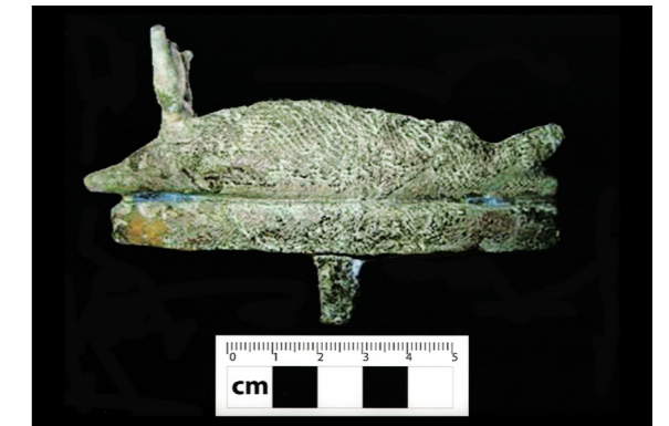
Figura 10. Reverso de escultura de bronce de pez oxirrinco hallada en Tumba nº 23. Misión Arqueológica de Oxirrinco.

En el año 2012, en el complejo funerario de época romana y concretamente en una zona donde no se constató ninguna tumba (Ámbito 32), apareció una gran ofrenda de alrededor de 20.000 peces no momificados con tamaños que oscilaban entre 10 y 120 cm de longitud 40 . Tras su estudio se comprobó que casi un 95% de ellos eran