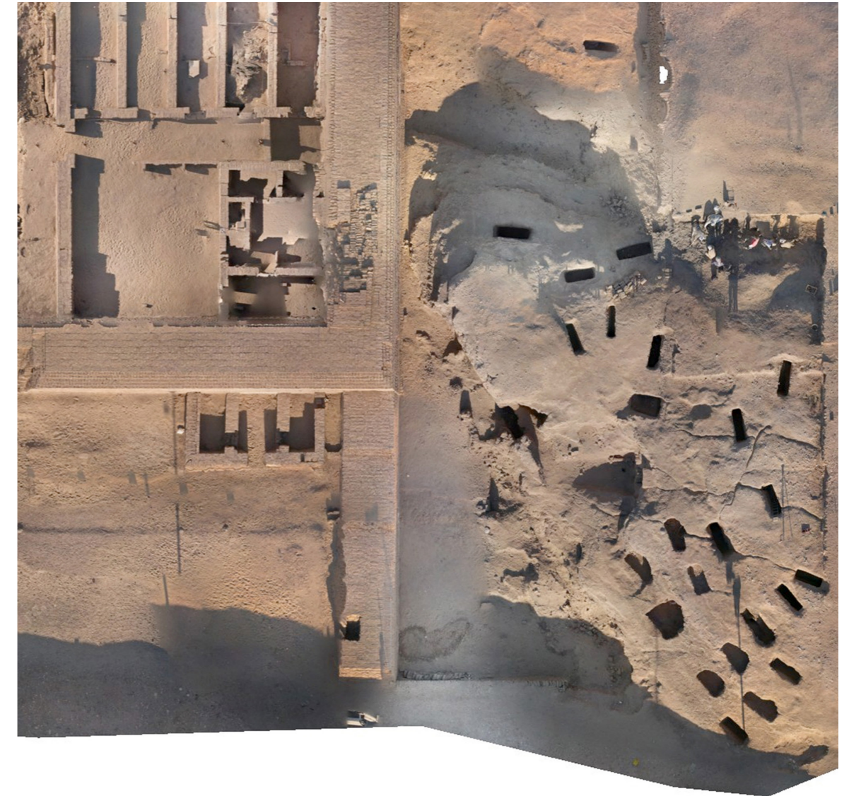
Figura 2. Ortofotografía zona excavada, realizada por José Martínez Rubio. © Thutmosis III Temple Project.

La fosa 6, situada al sur de la 5, también presenta un pozo de forma rectangular con medidas de