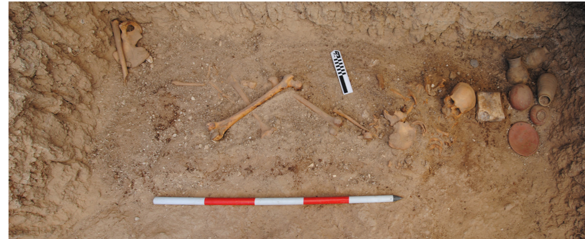
Figura 5. Enterramiento fosa 13, fotografía de Manuel Abelleira Durán. © Thutmosis III Temple Project.

edad. Este individuo, número 28, presentaba la cabeza, sin conexión anatómica con el cuerpo, orientada hacia el este. A pesar de ello, detrás de la cabeza del difunto descubrimos un reposacabezas de piedra caliza al que dimos el número de inventario 15847. Y junto al reposacabezas había un depósito de cinco recipientes cerámicos y una bandeja (fig. 5) 13 .