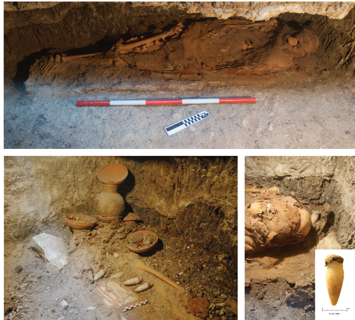
Figura 7. Enterramiento del nicho 3 de la fosa 18, fotografía de Manuel Abelleira Durán. © Thutmosis III Temple Project.

una de ellas con su tapón original de barro 18 , y una concha situada delante de la cabeza.