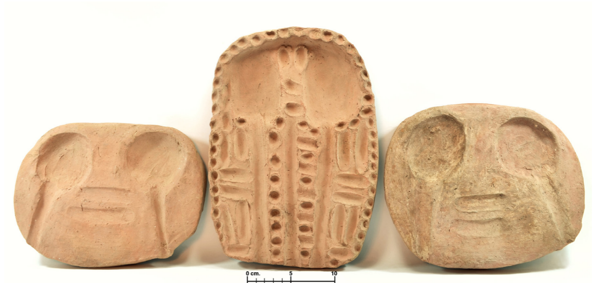
Figura 4. Bandejas de ofrenda, fotografía de Inés García Martínez. © Thutmosis III Temple Project.

Estas bandejas, que tienen los números de inventario 15733 y 15735, presentan una forma ovalada