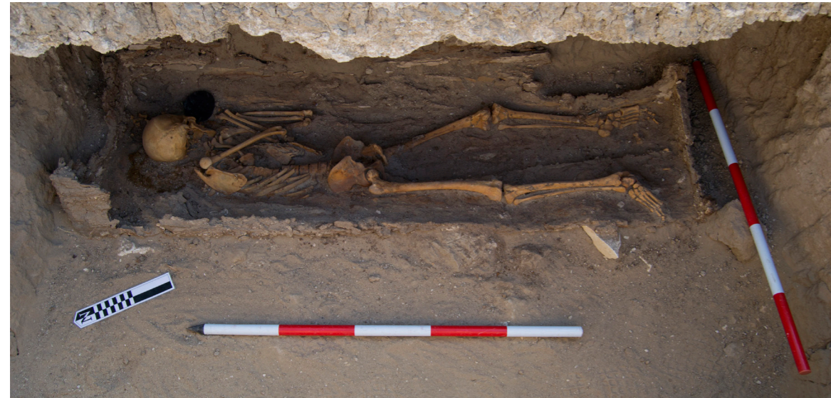
Figura 3. Enterramiento fosa 5

40 años, con la cabeza orientada hacia el noreste, que ocupaba el también deteriorado ataúd situado en el suelo del nicho.