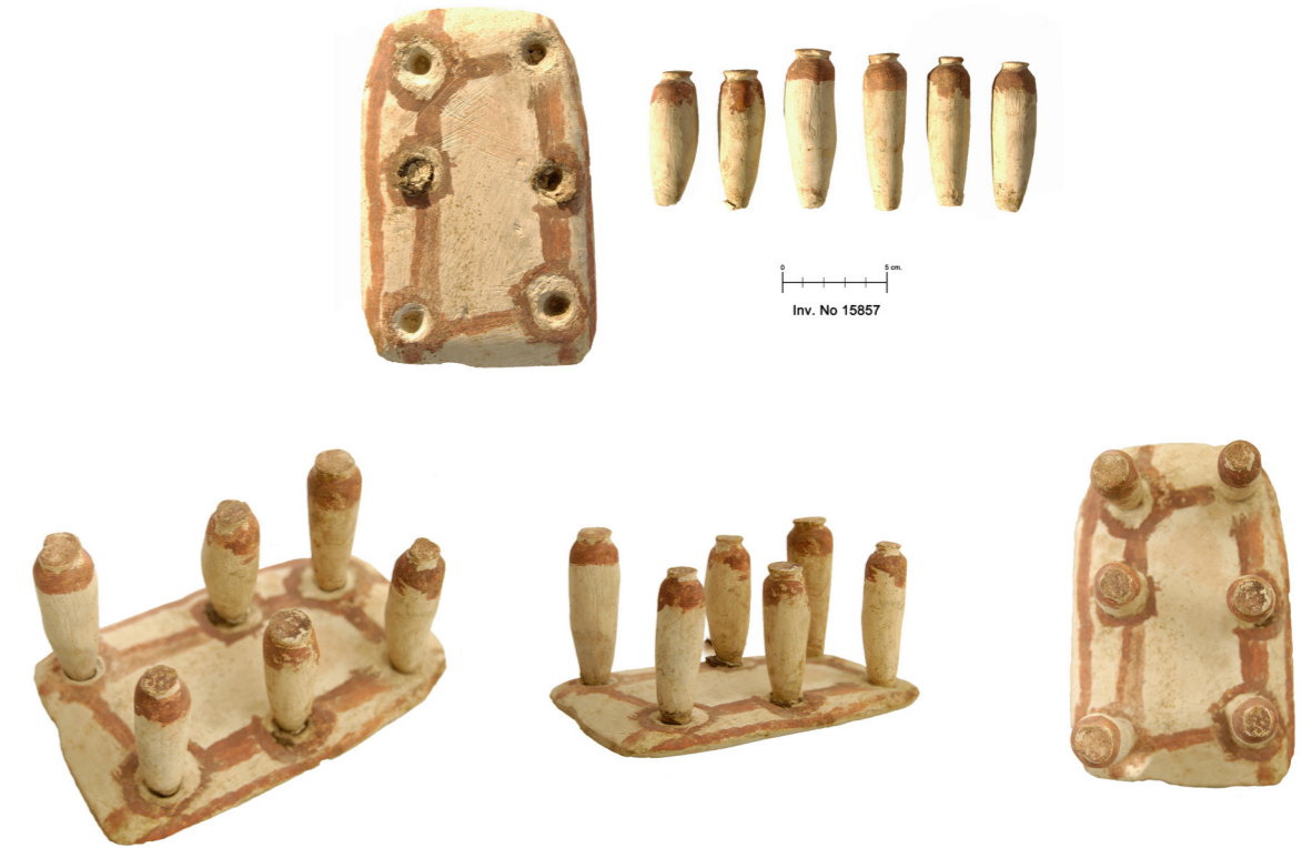
Figura 8. Bandejas de ofrenda

cadáver de un hombre de entre 20 y 30 años, aún momificado, que correspondía al número 40 de esta necrópolis (fig. 7). En aquel nicho había sido depositado un ajuar consistente en las siguientes piezas: un pequeño recipiente de alabastro (No. Inv. 15859), que conservaba un tapón de barro, situado en la cabeza del difunto 19 ; nueve recipientes cerámicos de distintas formas, colocados en la esquina oeste, y una hermosa maqueta de bandeja de ofrendas, con seis pequeños recipientes, elaborada en caliza (No. Inv. 15857)